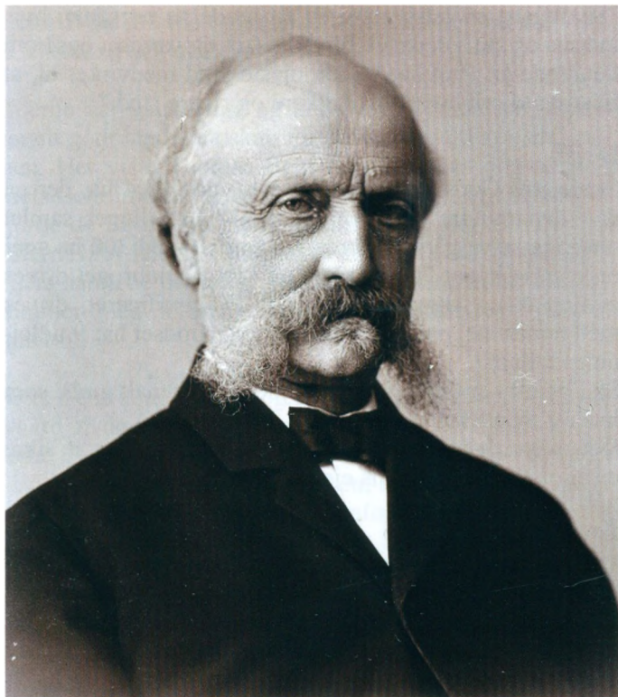
J.B.S. Estrup.

Estrup var den stærke og ledende skikkelse indenfor den politiske konservatisme i sidste tredjedel af 1800-tallet og i betydelig grad helt frem til sin død. Der var også en kulturel og en teologisk konservatisme, men dem havde han ikke meget at gøre med. Dengang var kirke og kultur to departementer i eet ministerium kaldet "Kultusministeriet", men de kultusministre, som Estrup indstillede til kong Christian den Niende, virkede, som om det mest handlede om, at de ikke skulle være så kristne, at det gjorde noget. Hos kirkeligt konservative som biskop H.L. Martensen og den teologiske professor Henrik Scharling var der skuffelse over dette. Først i den senere del af 1890-erne fik Danmark kultusministre, som var kirkeligt konservative. En kulturelt konservativ skikkelse som digteren Ernst von der Recke var på sin side skuffet over en kultusminister, som indtog et ukonservativt standpunkt i retskrivningsdebatten. Den kirkelige og den kulturelle konservatisme kunne altså ikke regne med at få støtte fra den politiske, mens Estrup var konseilspræsident. 2 Estrups politiske konservatisme viste sig markant på forsvarsområdet, på finans- og skatteområdet og i det principielle statspolitiske spørgsmål om kongens ret til at udnævne og afskedige sine ministre, en ret som var nedfældet i grundloven. Han havde en klar politisk linje.