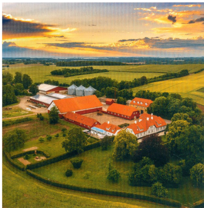
Saltoftehus er udgangspunktet for årsmødet 2023. www.saltoftehus.dk