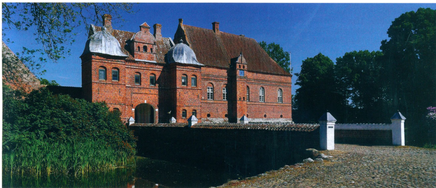
Hovedbygningen.