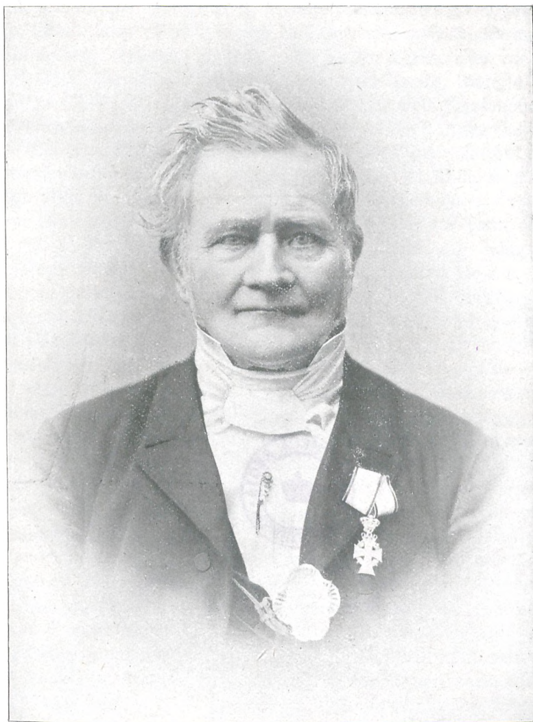
Sidste Portræt af samme.