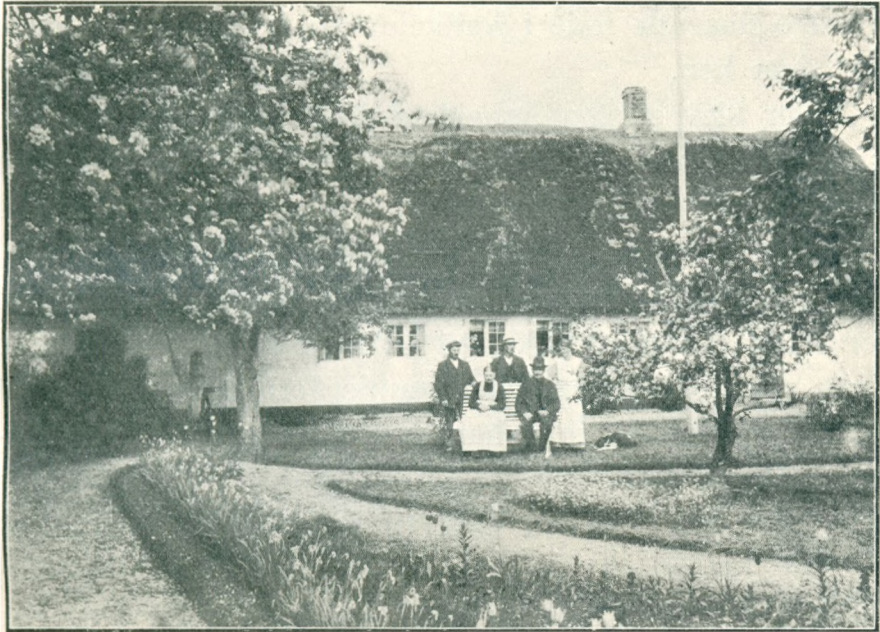
Slægtsgaarden set fra Haven.

i „Slaget“. kom sejlene fra hver sin Side og mødtes ved „Borrebjerg“, der den Gang var helt omgivet af Vand. Med løftede Aarer gik Baadmandskabet mod hverandre, og Opgaven var at faa vippet Modparten udenbords. Selvfølgelig var det kun for Løjer, man lavede „Søslag“.