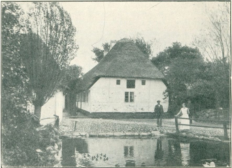
Slægtsgaarden set fra Indkørslen mod Syd.

De gamle af Slægten har fortalt mange Træk fra denne Tid; for Nutidsøren lyder de næsten som et Eventyr. Saaledes hedder det, at Børnene fra „Elnegaard“ ikke saa sjældent sejlede over Noret til Magleby Skole. Var det Højvande, og der ikke blev brugt Baad, maatte Skole-