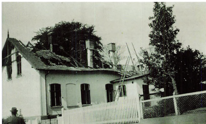
Gendarmboligen efter branden

Det var nok planen den 26. maj 1944, hvor civilklædte Gestapo folk kl. 5.00 ringede på døren og bad ham lukke op. Obersten bad dem komme på hans kontor kl. 10.00. Herefter slæbte han en svær egetræskiste hen foran hoveddøren, gik op på loftet og smed et skab ned af trappen for at blokere den.