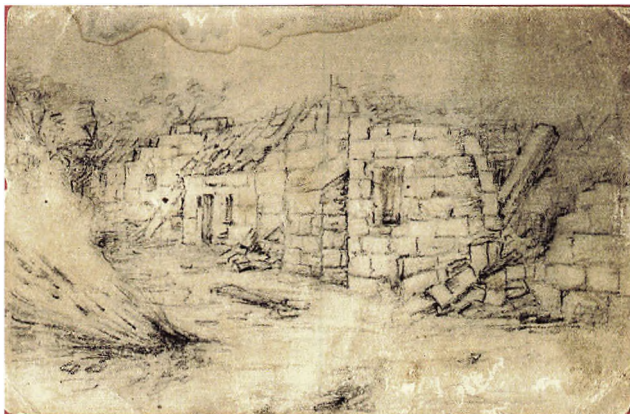
Håndtegnet postkort fra 1. verdenskrig. Tegnet af Jes Peter Larsen, Bojskovskov

HISTORISK FORENING FOR GRAASTEN BY OG EGN