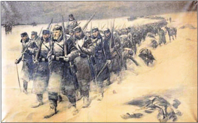
Tilbagetoget fra Dannevirke, efter Niels Simonsens maleri