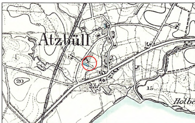
○ Præstegården i Adsbøl