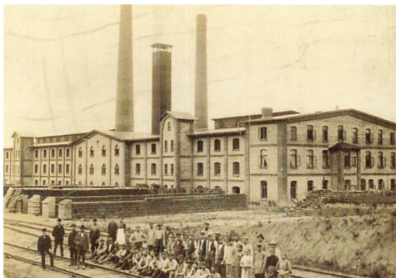
Teglværket ca. 1906-07