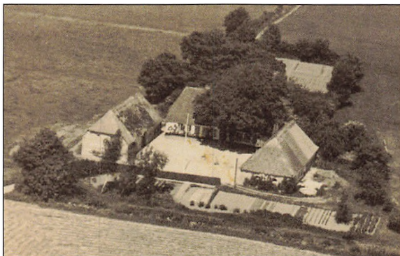
Præstegården i Adsbøl, ca. 1947-49.