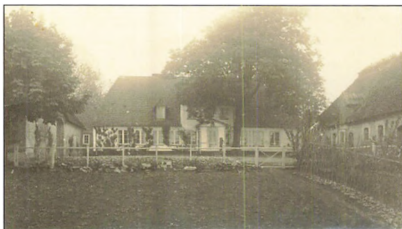
Præstegården i Adsbøl, ca. 1925

Deres fredelige hjem i Adsbøl oplevede en række besættelser af fremmede tropper, der huserede slemt og voldte dem store tab.