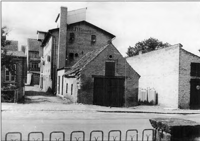
Kornfirmaet Laurits Nielsen A/S

I starten af TPs læretid skulle han også passe høns, der var en 10-12 stykker, og så selvfølgelig også fyringen. Det var et centralvarmeanlæg. Det skulle tændes op om søndagen, og så skulle der fyldes på, så der var varmt hele dagen. Posten skulle hentes på postkontoret – også om søndagen.