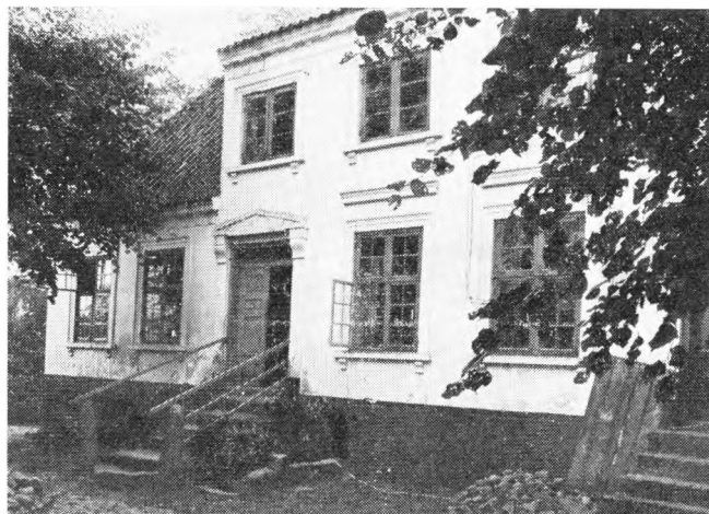
Søbygaards Hovedbygning.

bygaard og Gudsgave samt Nordborg og Melsgaard paa Als, mens Hjortspring og Østerholm tilfaldt Kronen. Frederik Carl drog derefter udenlands, og i hans Fraværelse styredes hans Besiddelser af en Kommission. Da han 1729 ogsaa arvede de plønske Besiddelser, overdrog han i Henhold til Aftalen de nordborgske og ærøske Godser til Kongen, mens han selv som Hertug af Plön overtog Slægtens holstenske Besiddelser.