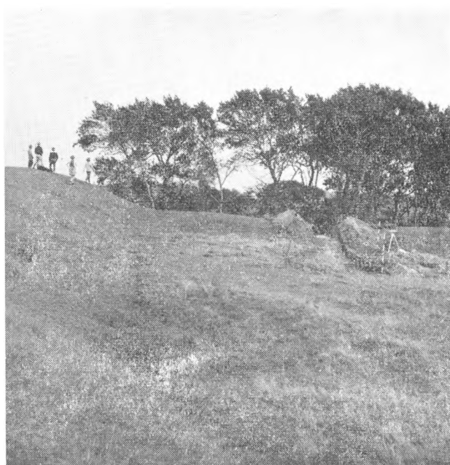
Udgravningen paa Toppen af Voldstedet Sept. 1961 Arbejdet fulgtes ikke mindst af Børnene med stor Interesse.

I September 1961 foretog Nationalmuseet under Ledelse af Museumsinspektør Stiesdal en mindre Prøvegravning paa Toppen af Voldstedet, hvorved man førte en Grav igennem Volden og et Stykke ind paa Borgpladsen. Som det var at vente, viste Volden og den yderste Del af Borgpladsen sig at være paafyldt. Selve Borgpladsen var i Tidens Løb blevet dækket af et tykt Lag Muld, og først en god halv Meter nede stødte man paa den gamle Overflade med en Slags Brolægning af spredte Kampesten. Mellem Stenene fandt man flere Armbrøst-Jernpile (Bolte), et Vidnesbyrd om de krigerske Begivenheder, som i sin Tid har fundet Sted her. De Armbrøstbolte fra 16. Aarhundrede, der findes i Tøjhuset, er betydeligt sværere end Boltene fra Søbygaard, hvad der øjen-