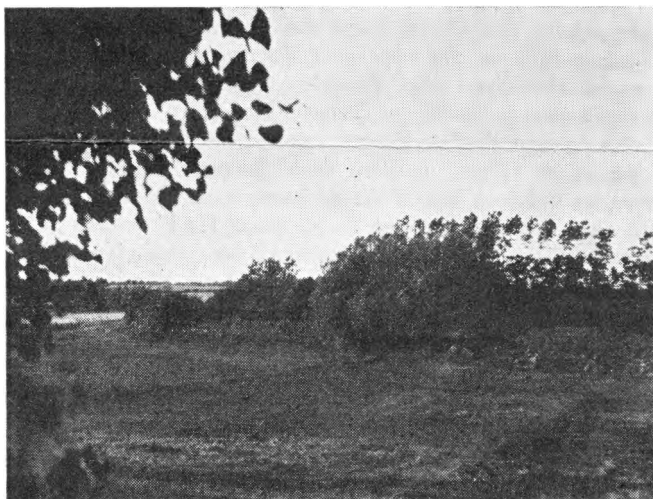
Tomten af det gamle Graasten set fra Søndermose.