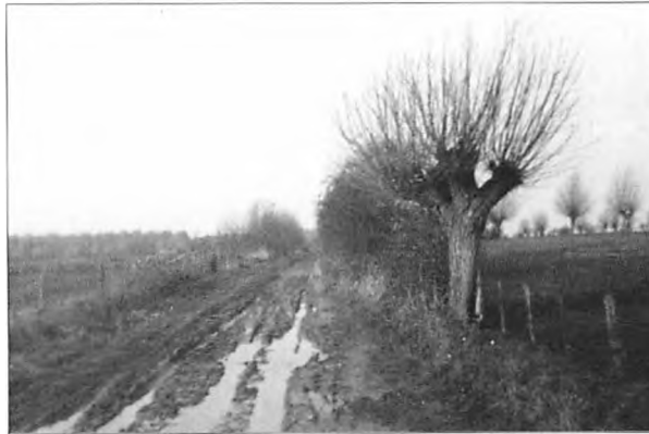
En tidlig forårsdag ved Krårup Strand.