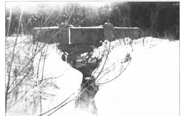
Den østligste "røde bro", der ligger tæt ved det, der i dag i "Småland".

Der var dengang ikke noget der hed offentlige snepløve, og da det meste af samfundet på landet bestod af bønder, ja så var trafikken på vejene også for det meste hestevogne, og i slemt sneføre, kaner og slæder. Postvæsenet havde