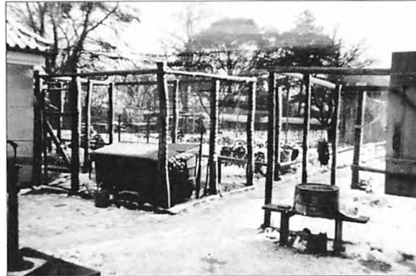
Et kig ud fra vores baggård en vinterdag. Bag ved vores hønsegård skimtes stenmuren ved de høje træer.

Men dette udbrud af lyksalighed var også afslørende for ham, for hvis han i utide sneg sig ned i kælderen uden at sige noget om sin trang, så var der ingen der var i tvivl om