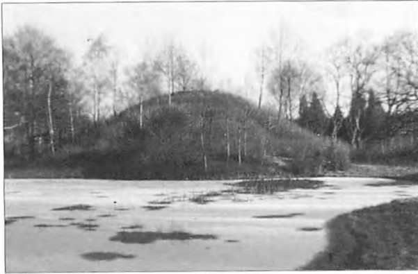
“Svanehojen” og søen en vinterdag.