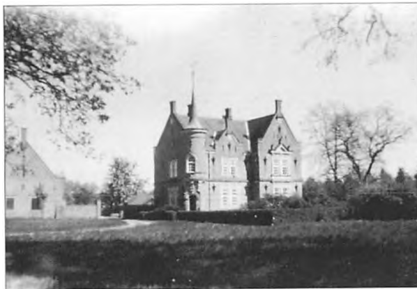
"Dyrlægeboligen" kaldte vi dette majestætiske hus, der er beliggende lige efter Maglemersporten.