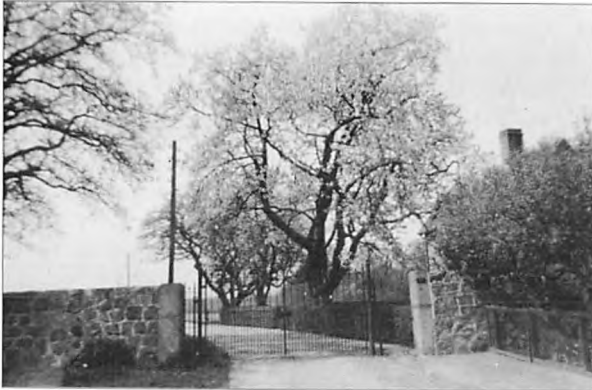
Den østlige port ind til Parken, jeg fravalgte som "stopklods".

sigtet, på hele forreste del af kroppen og på arme og ben! Jeg fo' r vrælende ind til mor, der måtte bruge over en halv time med en nål til at pille alle tornene ud, og jeg skulle ikke prøve den nye cykel lige med det første.