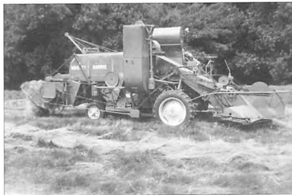
Næste forsøg var med en selvkørende mejetærsker, som var lejet til formålet.