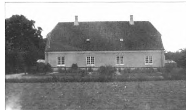
Mit barndomshjem. Vi boede i den højre halvdel, set herfra.

Det var ikke et sted, man tilbragte med avisen en rigtig varm sommerdag, for det var ikke just violer, der duftede af! Toilettepapir fandtes ikke, - (eller var for dyrt) – derfor brugte man avispapir i stedet, en helside blev revet i 4