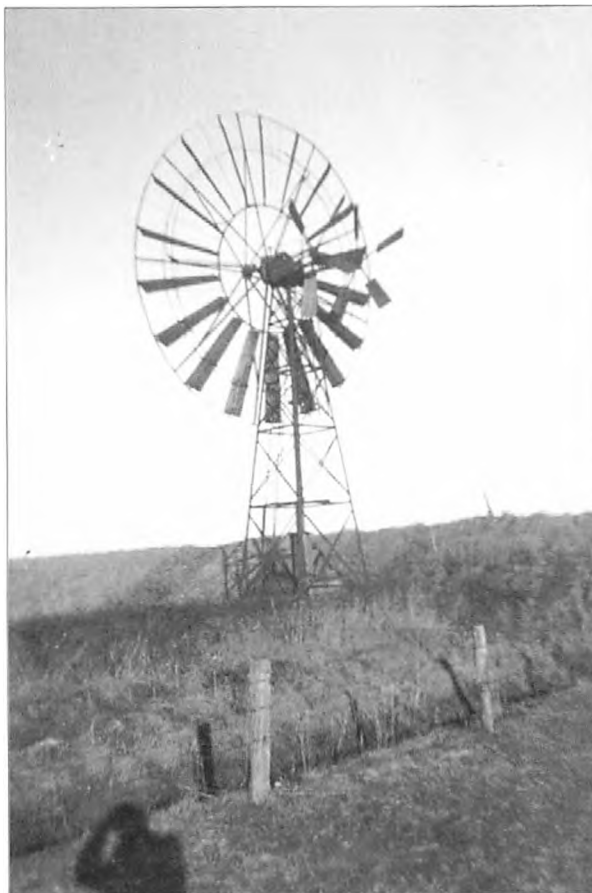
Den største af de to vindmøller på Knuthenborg.