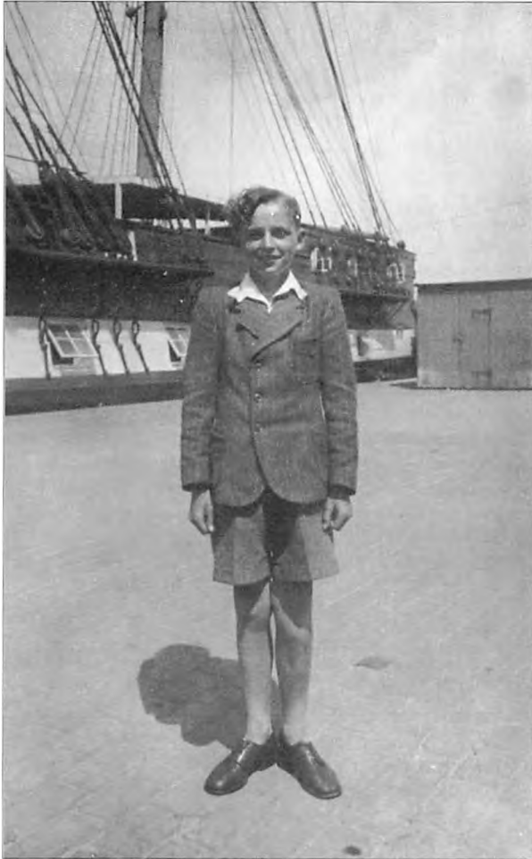
Jeg er her afbildet foran Fregatten Jylland. Billedet er taget af en "kanonfotograf".

Selve rejsen var en oplevelse i sig selv, der var en masse nyt at se, især turen over Storstrømsbroen, som var min første tur over den lange bro. Men vel ankommet til Hovedbanegården, måtte jeg alligevel måbe: et mylder af mennesker, jamen, jamen det var noget helt andet end Maribo! Og så alle de biler, og sporvogne, det var dog helt utroligt!