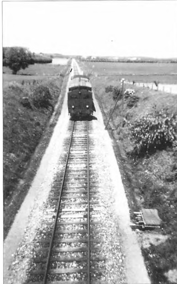
"Bandholmgrisen" fotograferet fra viadukten i Grimstrup.

Jeg kan huske at far havde sådan en lygte. Vi cyklede hjem fra Maribo en nat, da lygten lyste svagere og svagere. Far hoppede af cyklen, og konstaterede, at lygten var løbet tør, ikke for karbid, men vand.