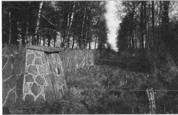
"Min" stenmur ved Strandskoven. Den kraftige støttepille på siden af muren skyldes sandsynligvis den meget bløde mosebund på stedet.

Det havde jeg aldrig smagt før, og jeg synes at det var så lækkert, at jeg åd som en sulten ulv, trods alle de kager, jeg havde fortæret, med det resultat, at jeg blev dårlig, og