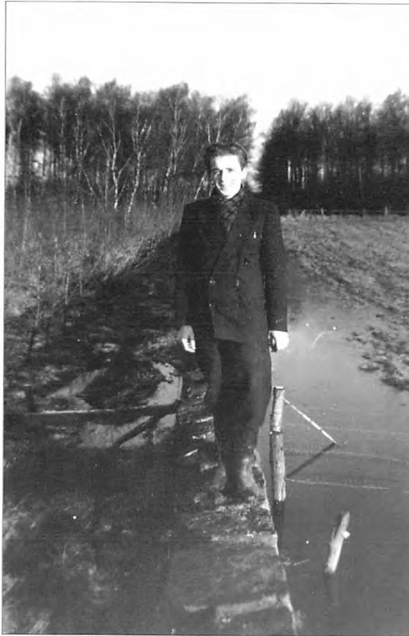
Tæus har fotograferet mig på stenmuren nede ved mosen. Det var her til højre, jeg skvattede ned en sommerdag.

Det gjorde vanvittigt ondt så jeg var lige ved at besvime, men det må have været en probat kur, for efter at have viklet lidt gazebind om foden, blev jeg sluppet fri igen, og bortset fra, at foden naturligvis var øm, så skete der ikke