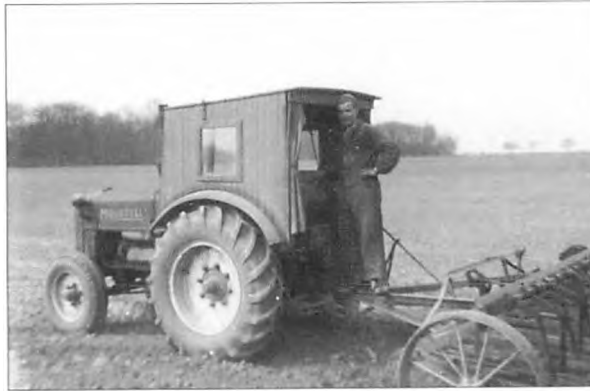
Munktell'en, kaldet "hønsesuset" på grund af det hjemmelavede førerhus.

Men en sommerdag, det har vel været i 1946-47, hørte jeg en helt ny, dyb brummende lyd nede fra Gården, og jeg