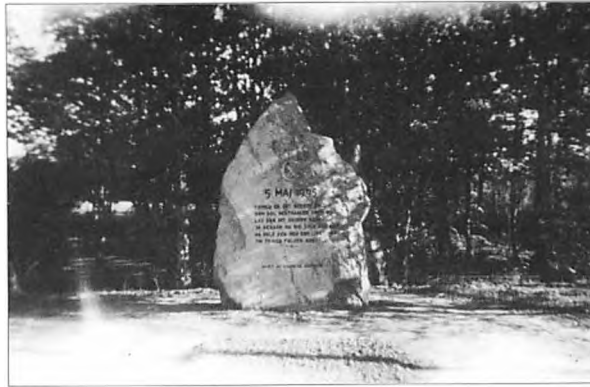
Mindestenen for befrielsen 5. maj 1945 ved det tidligere alderdomshjem over for kirken.