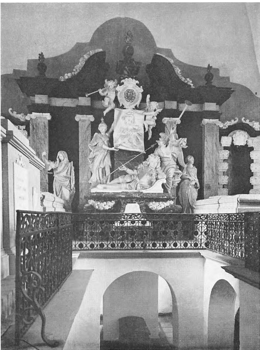
Scheele's Gravkapel i Auning Kirke.