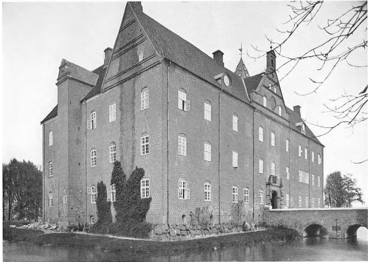
Schæel (Sostrup, Benzon).