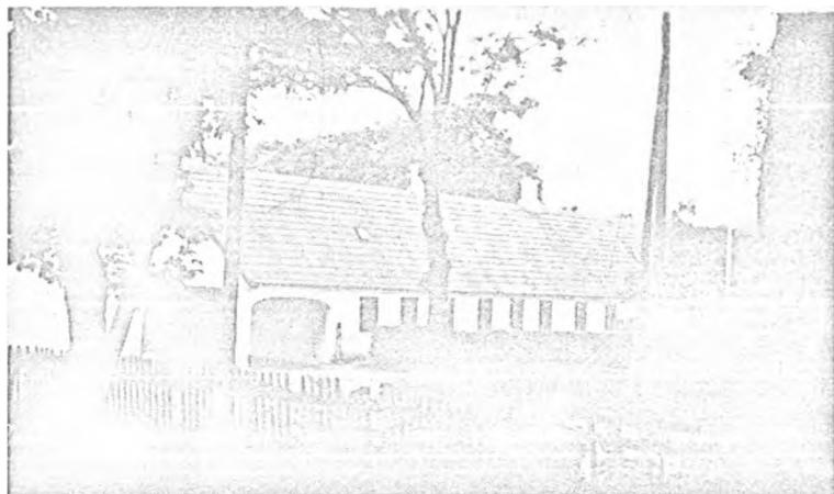
Nye Gaard i Lillevorde.