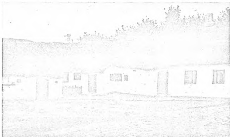
Den gamle Gaard.