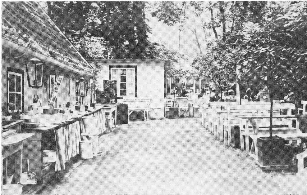
Familiehaven, Pileallé 16

man sang som sædvanlig „Helan går...“ til Snapsen, som Selskabet selv maatte bringe med — der vankede yderligere et stort Stykke Lagkage til Kaffen, og Stemningen i det snart tobaksfyldte Lokale blev hyggelig og munter.