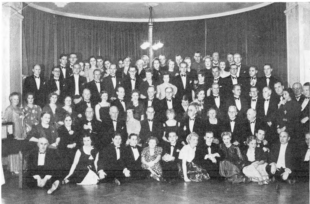
Borgerdydscoleselskabets 40 Aars Jubilæumsfest 31. Oktober 1939

N AAR man blader i det Festskrift, som Borgerdydscoleselskabets Bestyrelse sendte Medlemmerne ved 40 Aars Jubilæet, maa man jo indrømme, at Perioden 1939—1949 ikke har budt — eller rettere sagt — ikke har kunnet byde Medlemmerne saa mange muntre Oplevelser som i Selskabets første 40 Aar. Som antydnet i Indledningen, har Krigen med den for os Danske saa triste Besættelse, og Eftervæerne af det store Drama, sat dybe Spor i alt Foreningsliv i Danmark — og vort Selskab gik da heller ikke fri.