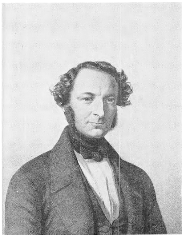
Carl Plessen (Scheel-Plessen) (1811-92)