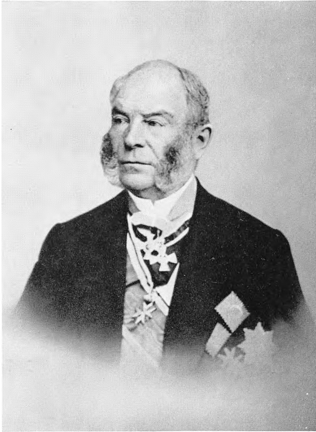
Botho Heinrich zu Eulenburg (1804-1879)