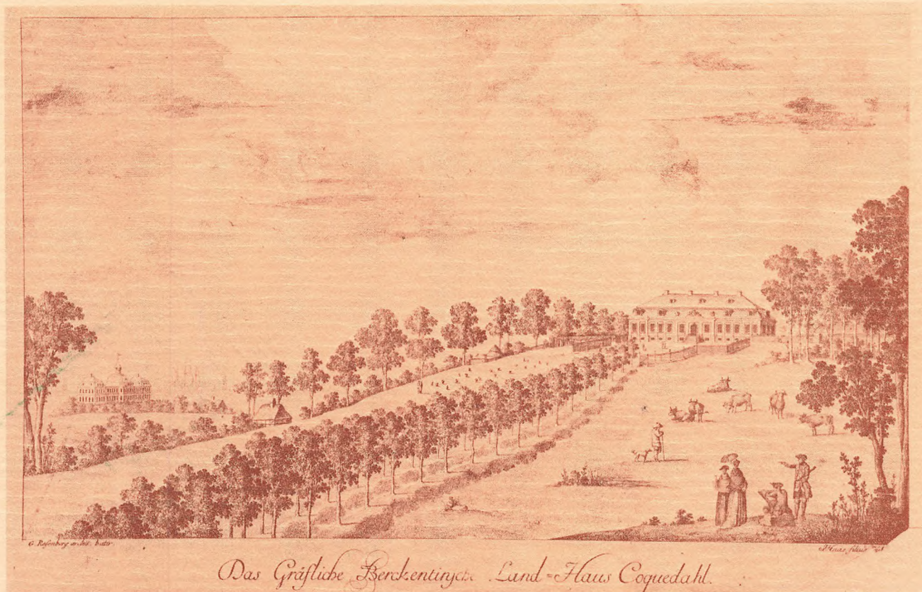
Das Gräfliche Berckentinget. Land-Flauw Coquedahl.