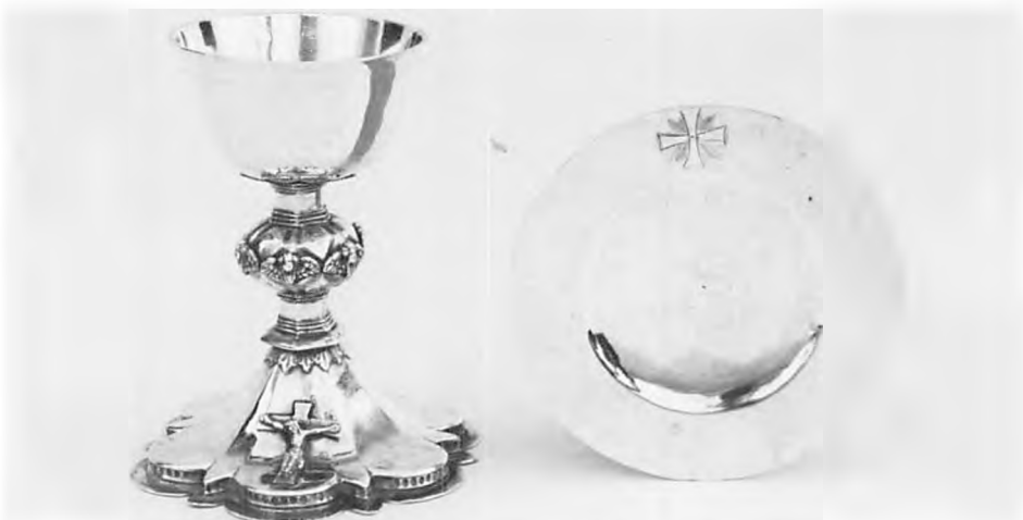
Fig. 3. Skt. Katharinæ kirkes smukke sygesæt er udført 1687 af guldsmed Jens Andersen Klyne, den sidste bærer af Klynenanvet i Ribe. Kort før sin død i året 1700 gav den gamle ungkarl sine opsparede 190 rigsdalere dels til Skt. Katharinæ kirke, dels til de fattige og dels til reparation af stamfaderen Søren Jacobsen Stages epitafium. På dette da mere end 100 år gamle gravminde lod han tilføje sin egen gravskrift med et malet billede af de 190 strålende dalere, som han »i Eenlighed med Møje havde samlet«.