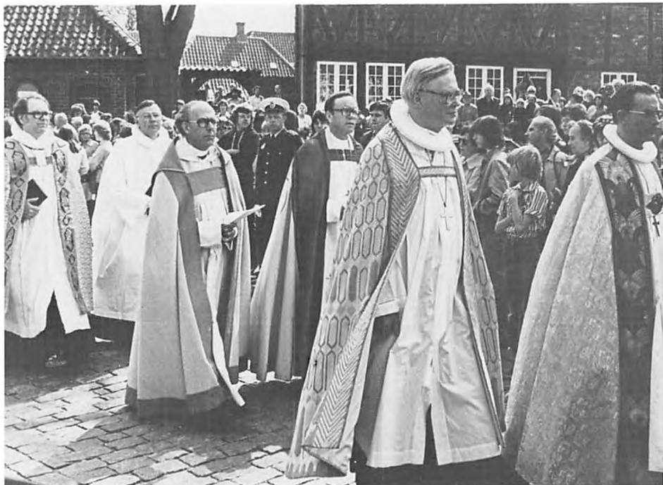
Fra bispevielsen i Ribe Domkirke søndag den 11. maj 1980.