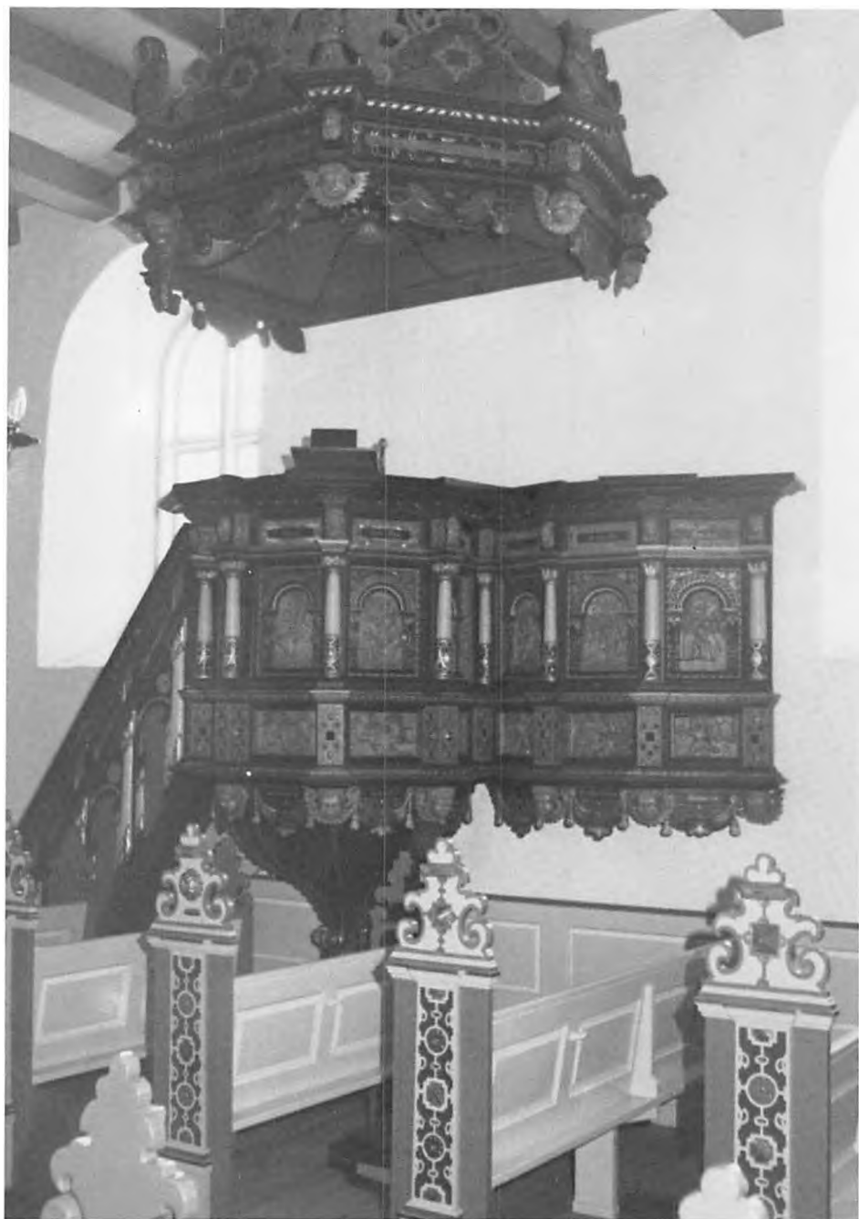
Staining kirke. Prædikestolen.