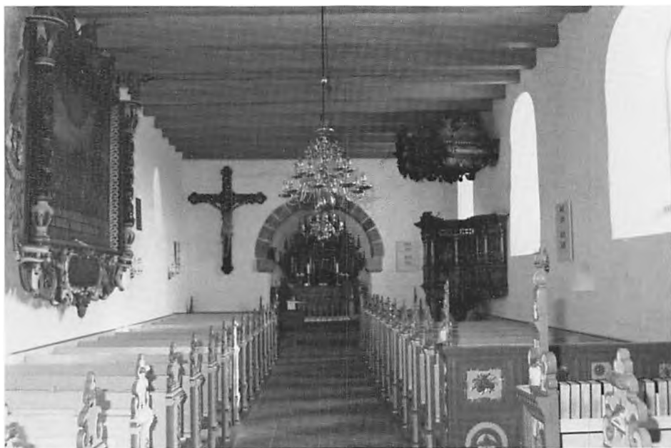
Stauning kirke. Interiør.