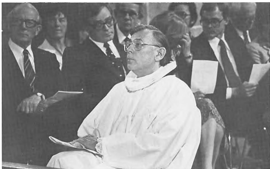
Fra bispevielsen i Ribe Domkirke søndag den 11. maj 1980.