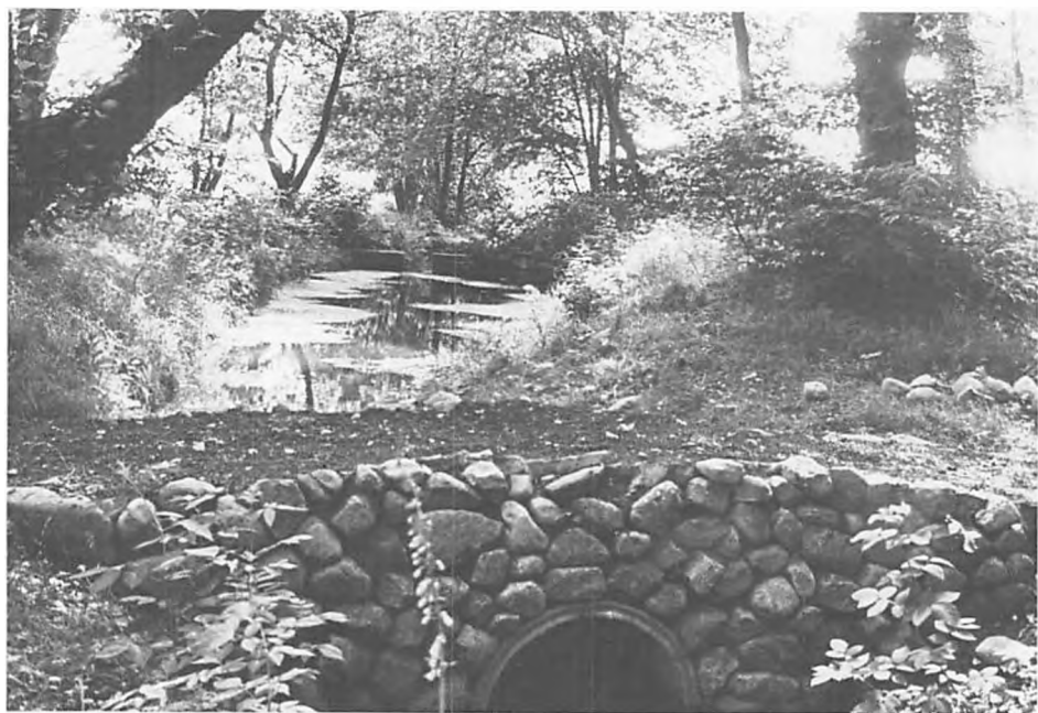
»Dammen« i Ho præstegårdshave.