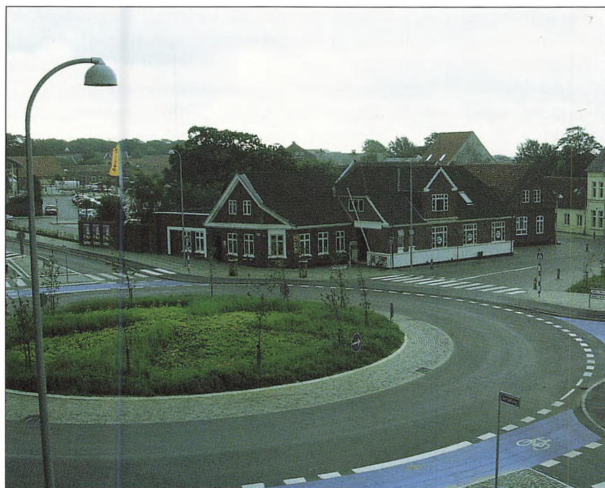
Udsigt fra det nye Føtex i Varde.