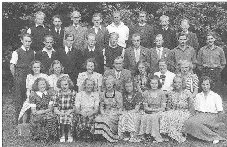
Årgang 1949 Nørre Nebel Realskole

Eleverne kom med meget forskellig baggrund, forkundskaber og begavelse. Nogle var flittige, nogle passede deres ting, og enkelte var dovne. Det var en almindelig opfattelse dengang, at en realskole skulle opsamle en slags "intelligensreserve", som man mente måtte gemme sig i lands- og stationsbyer. En opfattelse, som jeg igen mødte 15 år senere som lærer i Ølgod kommune, og som så vidt lever endnu visse steder. Generelt er og var det en tvivlsom påstand, men der var nogen, som skilte sig ud. Jeg kan nævne to skolekammerater, begge blev ingeniører. Den ene skabte en stor arbejdsplads i Midtengland, og den anden blev professor på Danmarks tekniske Universitet (tidl. Danmarks tekniske Højskole). De var naturligvis over middel, ellers var de ikke nået så langt. Den ene døde for år tilbage, kun 57 år gammel, mens den anden har virket indtil fornylig.