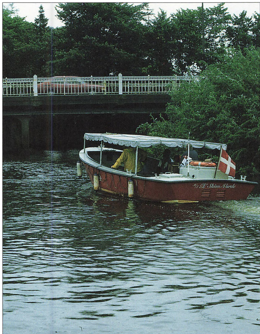
Æ' Skiiv i Varde a.