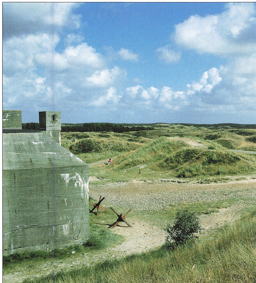
Tirpitz-stillingen ved Blåvand.