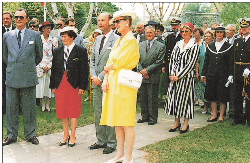
Der blev taget mange billeder i forbindelse med dronningebesøget ved Byjubilatet Varde 550 år.