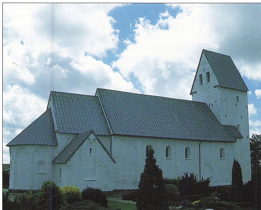
Billum Kirke.