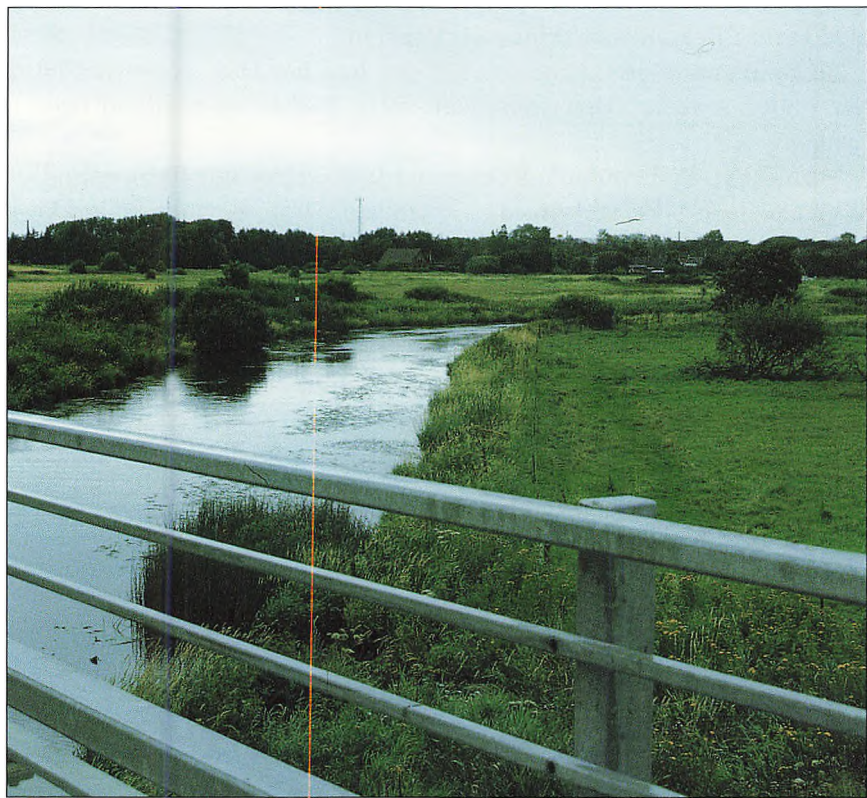
Varde å.