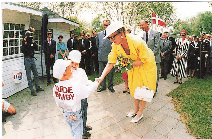
Dronningen på besøg i Mini-byen Varde 1992. (Dronningen spørger drengene "hvordan har I kunne holde jer rene så længe?")