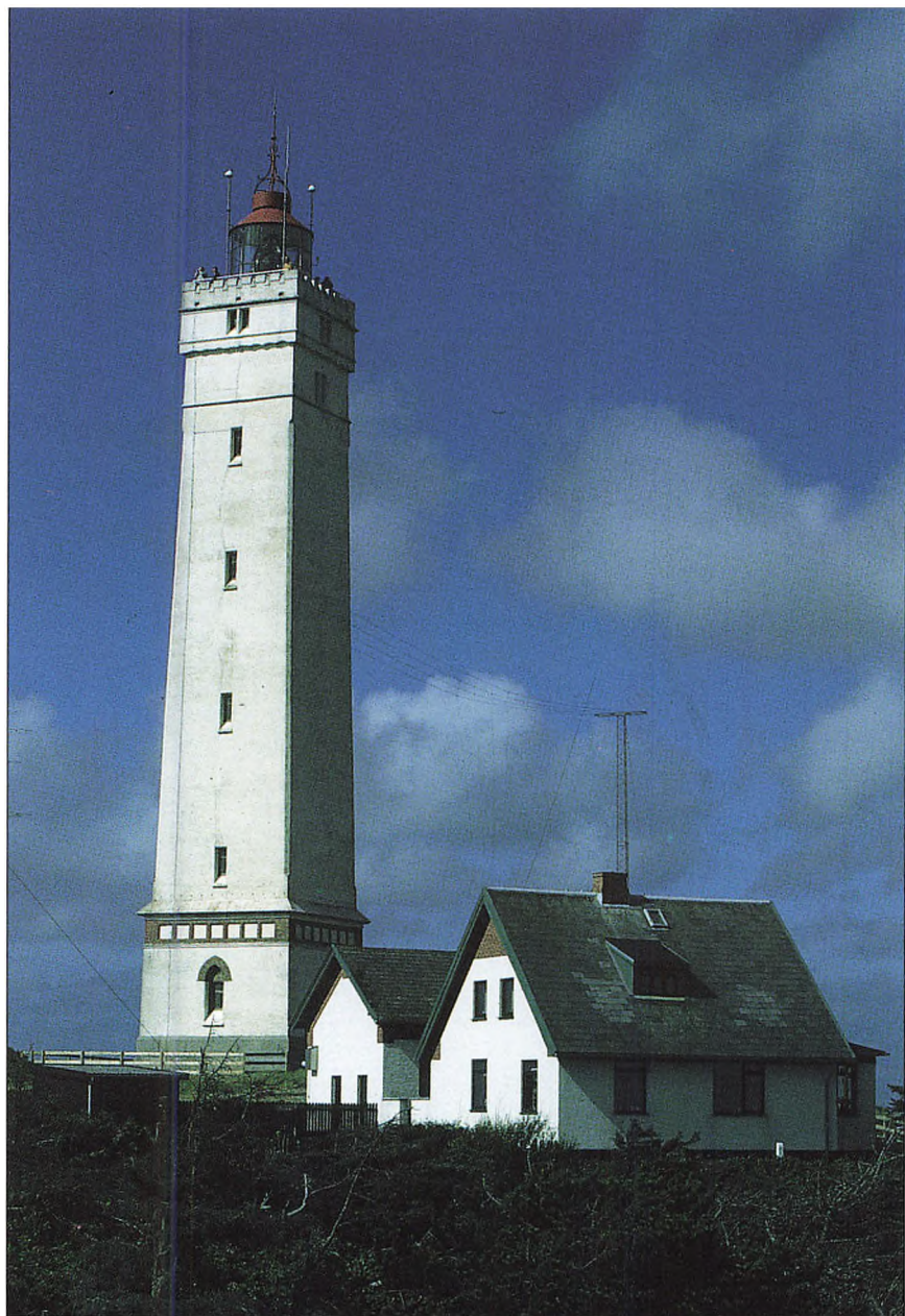
Blåvandshuk fyr.