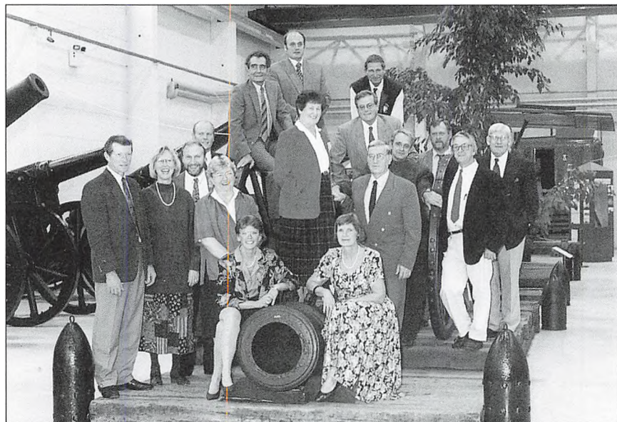
"Vardes kanoner" Byrådet i forbindelse med Bydstyen 1996.