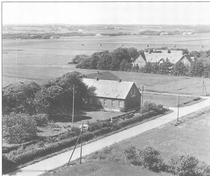
Kildegaard med skolen i baggrunden.

For at faa god arbejdsdisciplin banket ind var det nærliggende, baade pædagogisk og fysisk, at jeg blev kodreng paa Kildegaard fra klokken 13 til 20. Aftenmalkningen skulde jeg ikke gaa glip af. Formiddagen var afsat til hjemmefronten.