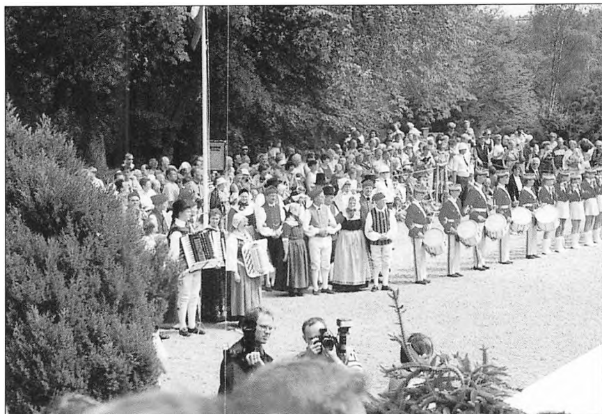
Kvik optræden for regentparret i Arnbjerg.