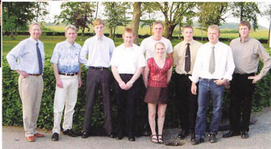
D. 28. maj afsluttede 7 modul 4-studerende med bevis for udvidet driftslederkursus.