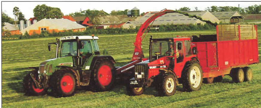
1. slæt tages på markerne bag "Fiskbæk"