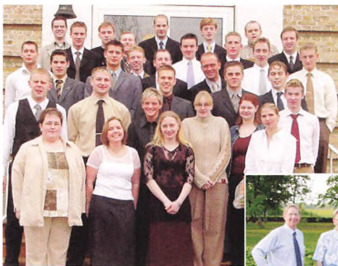
D. 27. februar tog de nyudklækkede driftsledere opstilling til tære for fotografen.