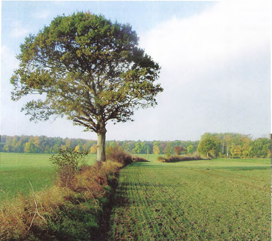
Dige i vestlig retning fra skolen mod skovbrynet.

Naturpleje indgår i dag som en obligatorisk del af undervisningen på alle moduler i landmandsud-dannelsen. Indgangsvinklen til faget er dog forskel- lig på de enkelte moduler. På Modul 1 tages der ud- gangspunkt i biotopernes flora og fauna. På Modul 2 arbejdes der med naturplaner på ejendomsnive- au, mens der på Modul 3 og 4 fokuseres på til-