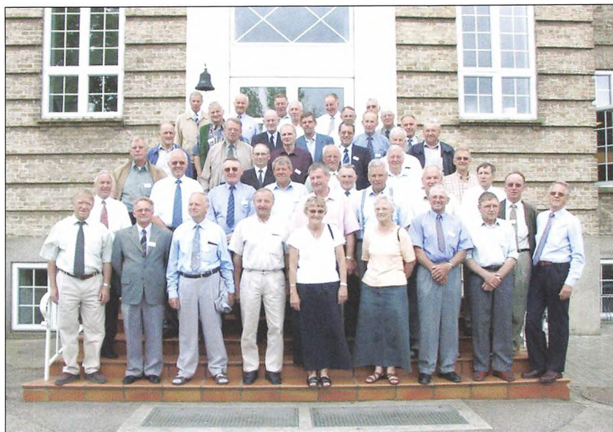
40 års jubilarer