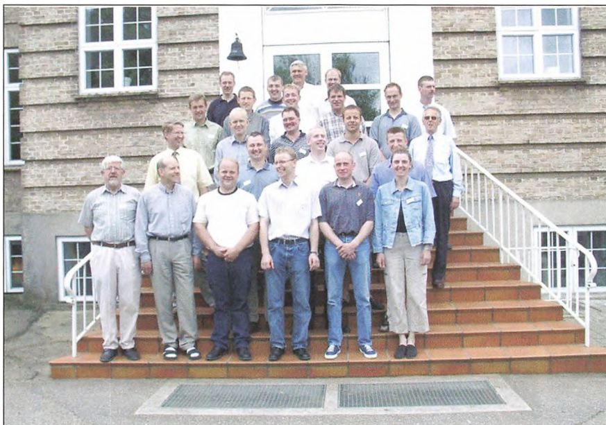
10 års jubilarer