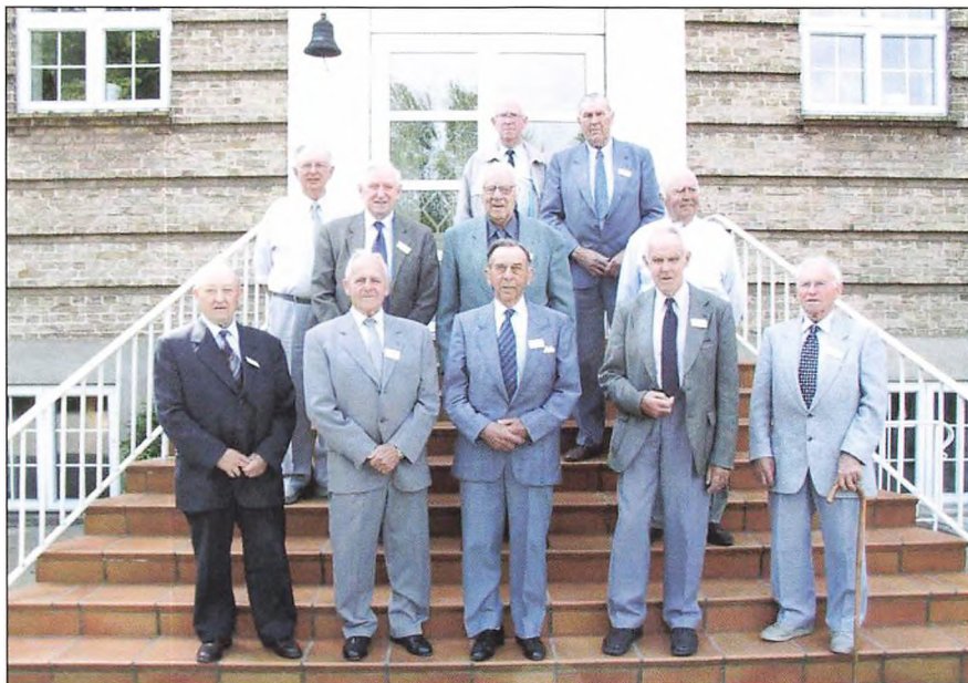
60 års jubilarer