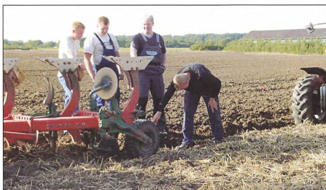
Pløjeundervisning med Modul 1a