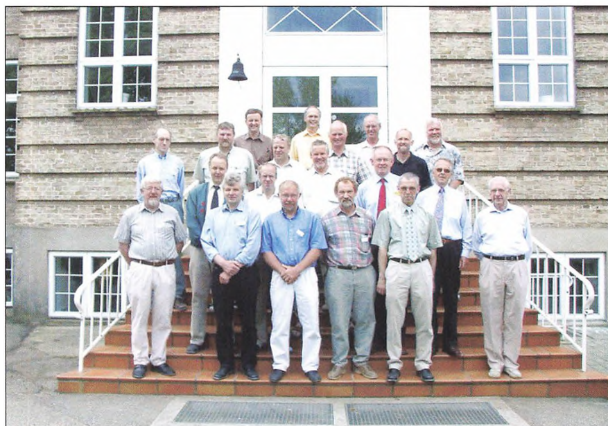
30 års jubilarer