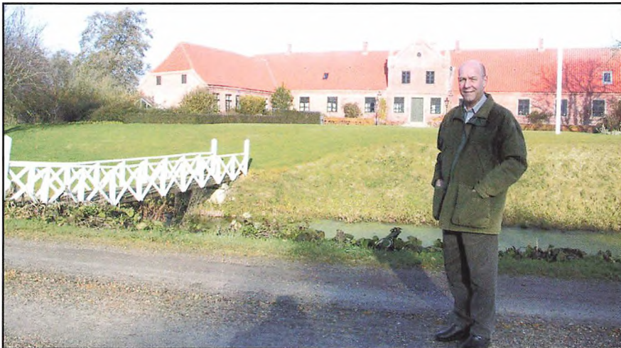
På Volstrup må der broer til for at komme tørskoet til middagsmaden

ne opfordret til at lade sig vælge til en post i Vestjyske Slagteriers bestyrelse og så gik det slag i slag og så med interessen for dette arbejde. Næstformand i 1992 og formand i 1995 og ved fusionen i 1998 flaskede det sig så sådan, at han blev formand for det nye Danish Crown.