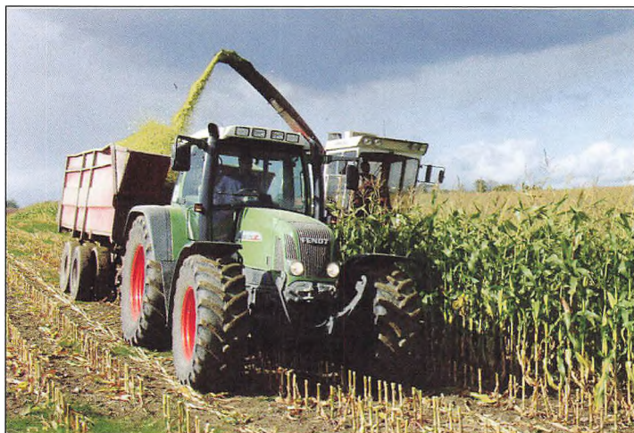
Tidlig majsbøst i september