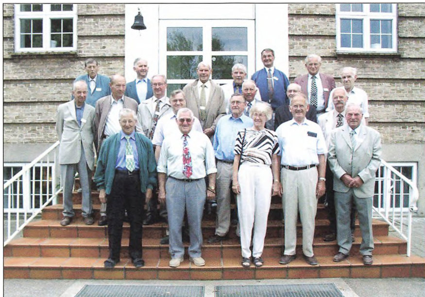
50 års jubilarer