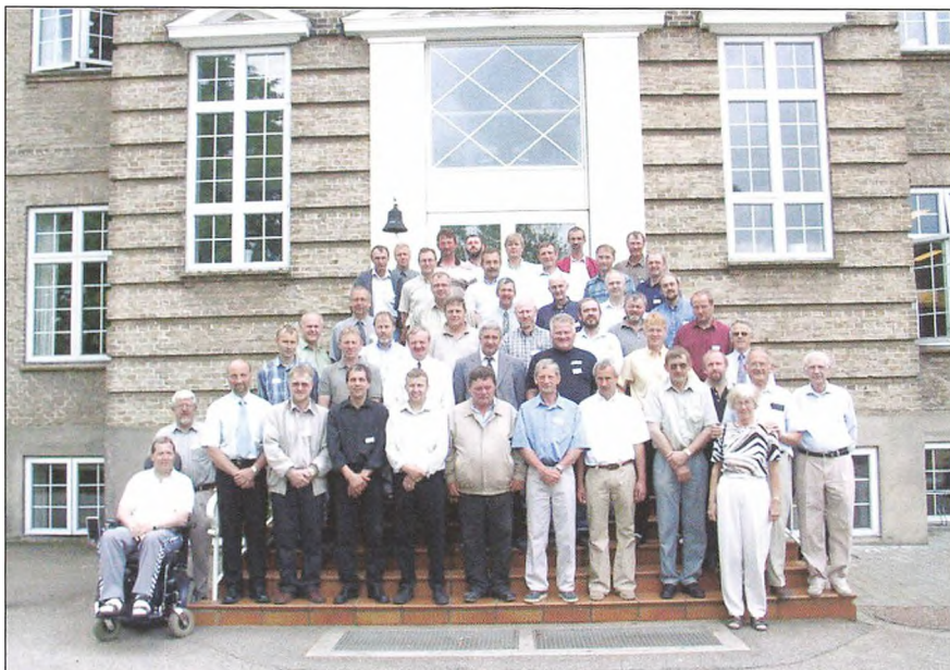
25 års jubilarer