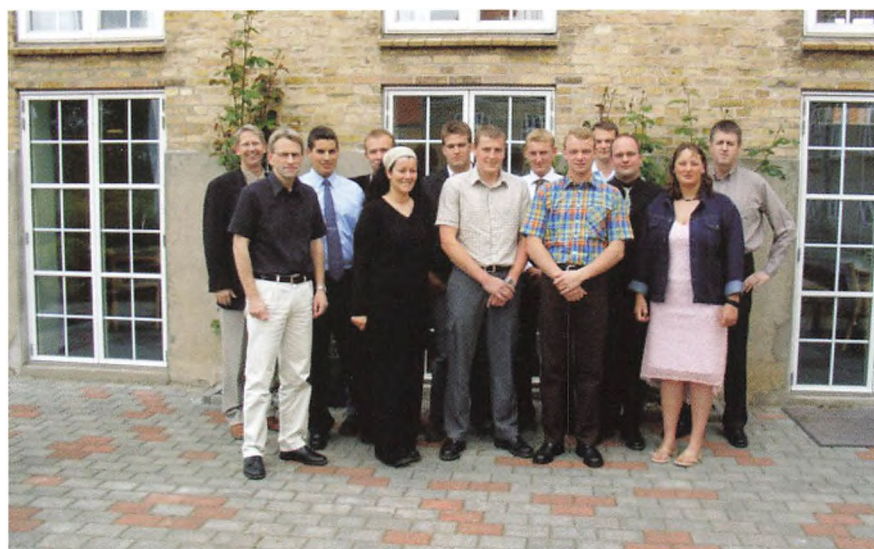
Modul 4-baldet sammen med forstanderen og et par af lærerne.