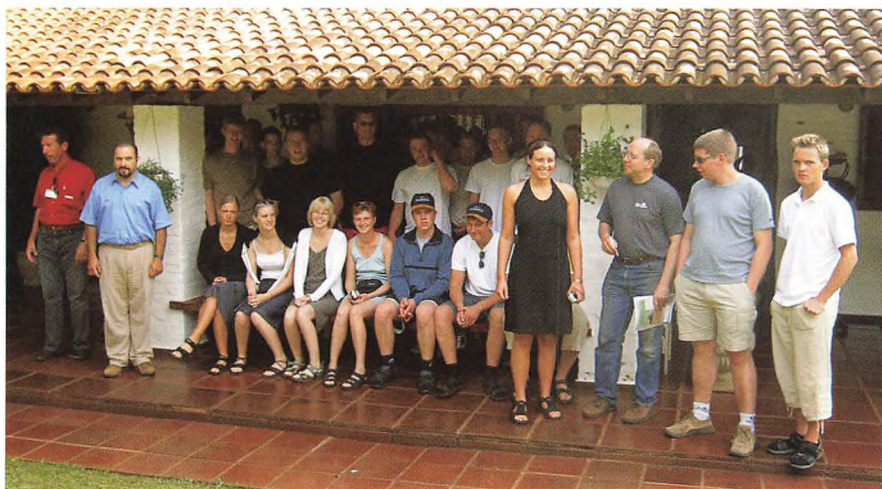
Nederst: På besøg hos en Brahmankvægarler