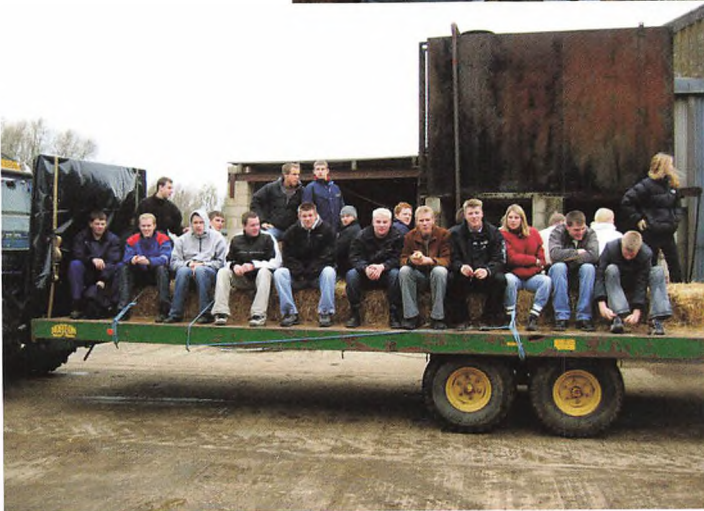
Nederst: Så skal vi ud og se frilandsgrise.