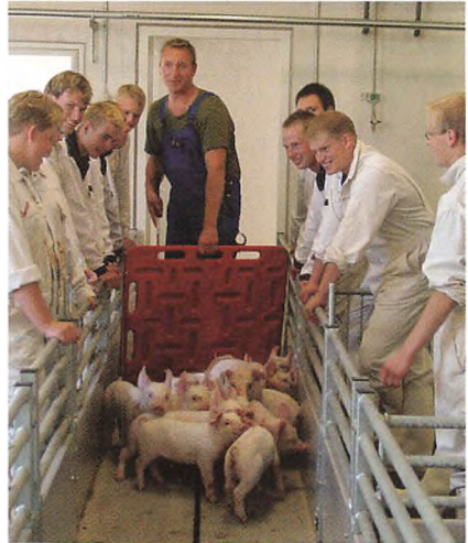
De første smågrise lukkes ind i den nye stald.

Hele svinestaldsanlægget er udstyret med besøgsrum med kig til hvert eneste staldafsnit. Derfor er Gråsten Landbrugsskole altid et besøg værd. Dette blev i høj grad benyttet den 19. september 2004, hvor vi deltog i den landsomfattende kampagne "Åbent Landbrug". Samlet havde knap 1200 mennesker valgt at bruge nogle timer på at besøge Gråsten Landbrugsskole, heraf havde vi i svinestald-