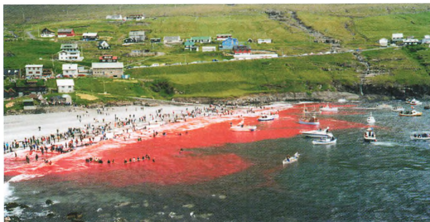
Grindedrab ved Leina