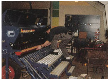
1B elev til eksamen.