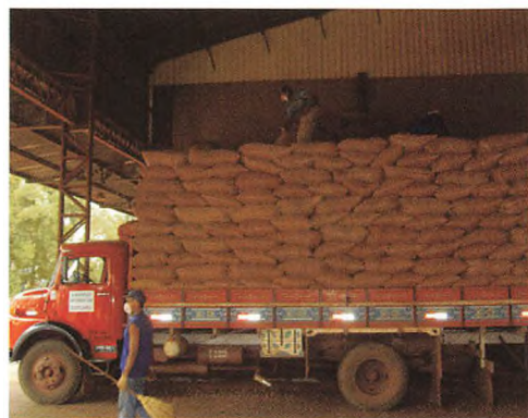
Venstre: Peanuts på vej til Europa