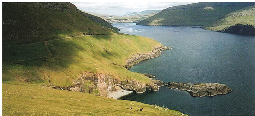
Storlået færøsk natur på Vágur.