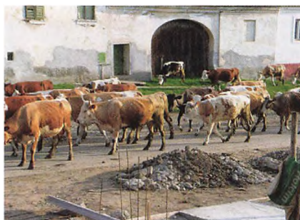
Landsbyens køer drives på græs.

knapt så spændende som det kan lyde, men turen dertil og hjem igen var alle pengene værd. Her fik vi for alvor et indtryk af, hvad Transsylvanien kan byde på af flotte landskaber.