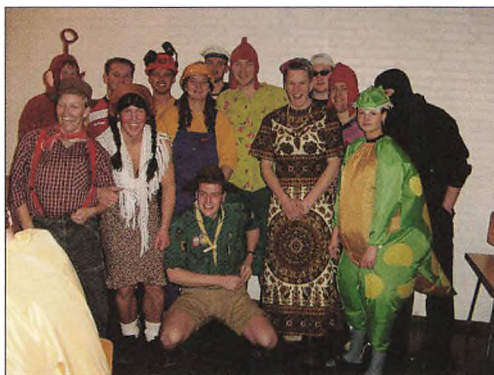
Fastelavnsfesten – en årligt tilbagevendende begivenhed.