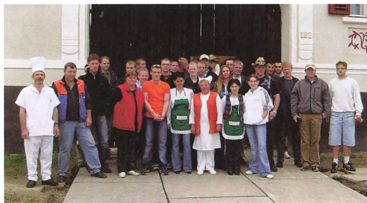
Klar til afrejse fra Bagaciu.