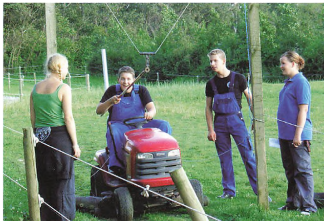
Modul 1A elever øver sig i traktor- ringridning.

4592 Sejersø 6280 Højer 6430 Nordborg 6230 Rødekro 6400 Sønderborg 8700 Horsens 6535 Brandrup 6372 Bylderup Bov 6360 Tinglev 6630 Rødding