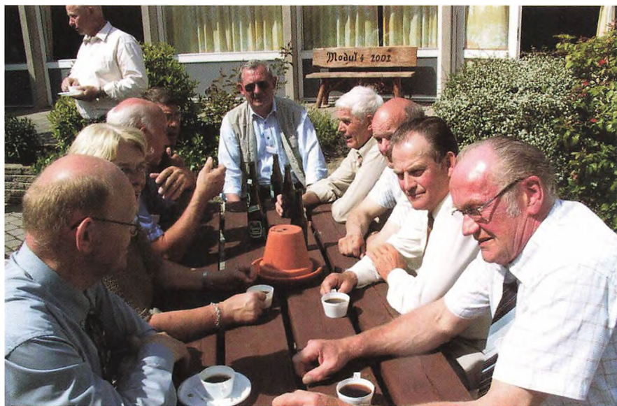
Hver sin smag til forfriskning.