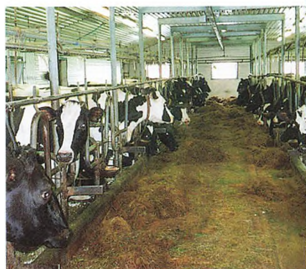
Færøernes højstydende besætning.