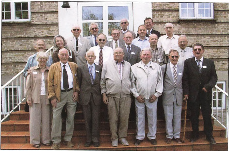
50 års jubilarer