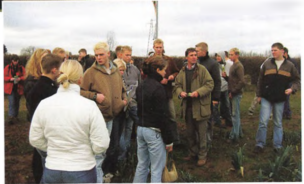
Midt: På besøg hos engelsk farmer.