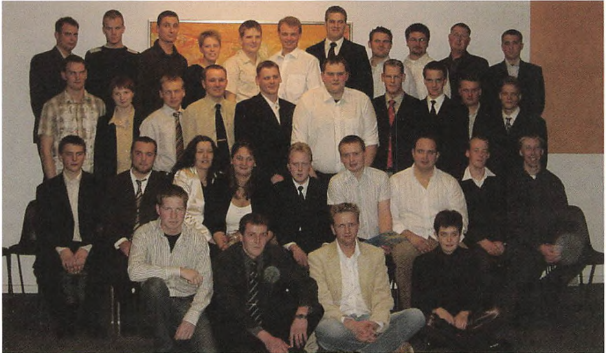
Sidst i februar var de nye driftsledere færdige.