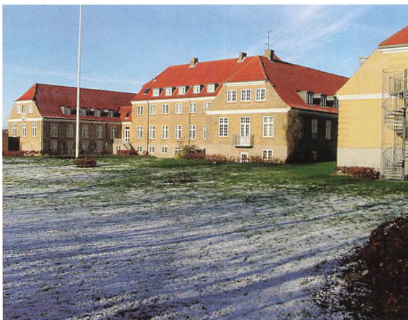
Gråsten Landbrugsskole på en frostklar dag i november.