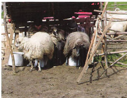
Malkning af får.

Da vi forlod fagskolen, var vi færdige med vore faglige besøg på turen. Resten af dagen gik med at foretage de sidste panikindkøb samt til kortspil.