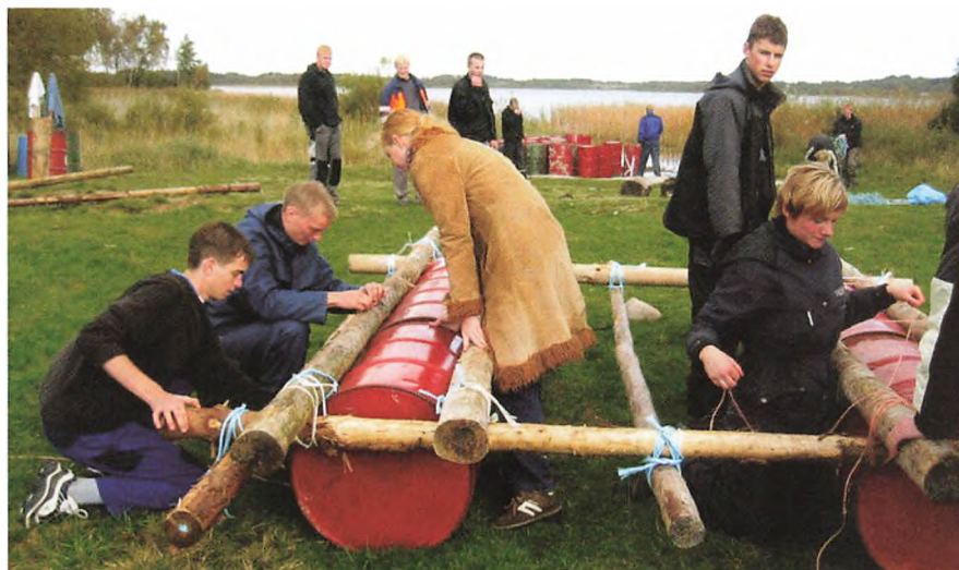
Modul 1B-boldet var på introtur til Stevningbus.

6280 Højer 6100 Haderslev 6520 Toftlund 6310 Broager 6240 Løgumkloster 6340 Kruså 6230 Rødekro 6372 Bylderup-Bov 6500 Vojens 6100 Haderslev 6630 Rødding 6400 Sønderborg 6360 Tinglev 5881 Skårup Fyn 6760 Ribe 6500 Vojens