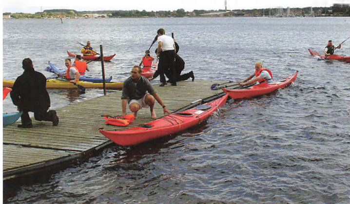
De nye drifts- ledere på kajaksejls ved Gråsten Havn