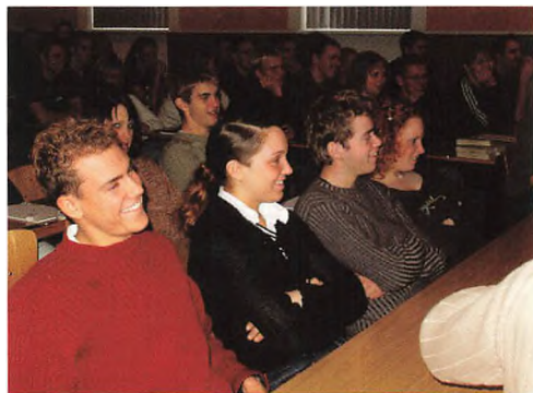
Højt bumør i foredragssalen.