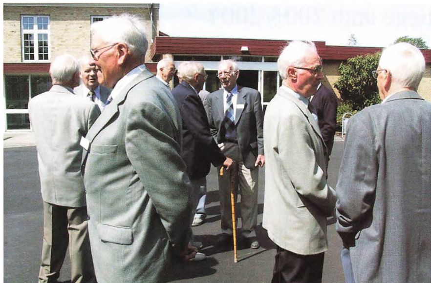
Hvad er der sket siden sidst?