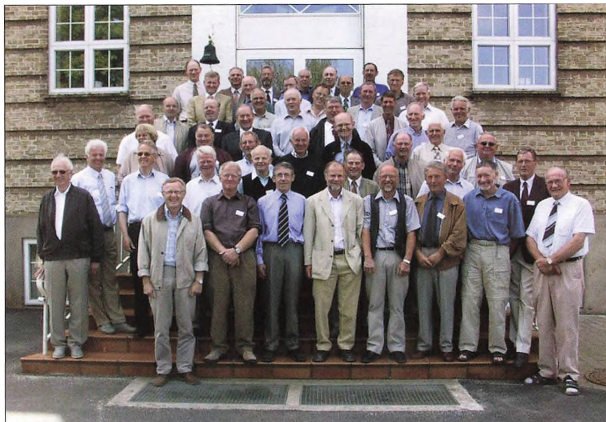
40 års jubilarer