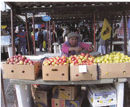
På marked i Tarnaveni.

Tilbage i Bagaciu var der biavl på programmet. En af landsbyens beboere fremviste og fortalte om sine 10 bistader. Han var en god fortæller, og sidegevinsten ved dette besøg var, at vi fik en masse at vide om, hvordan det har været at leve i Rumænien under Ceaucescu.