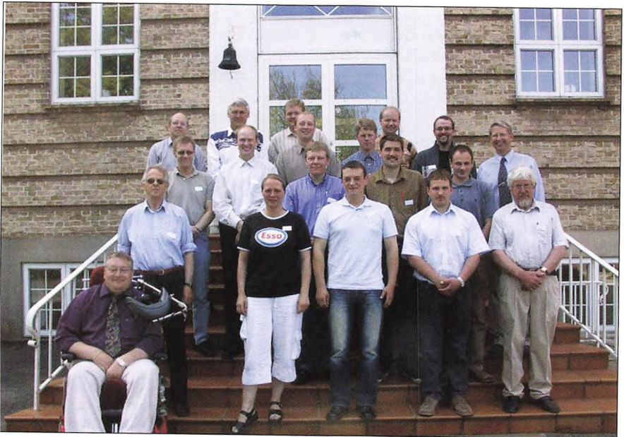
10 års jubilarer