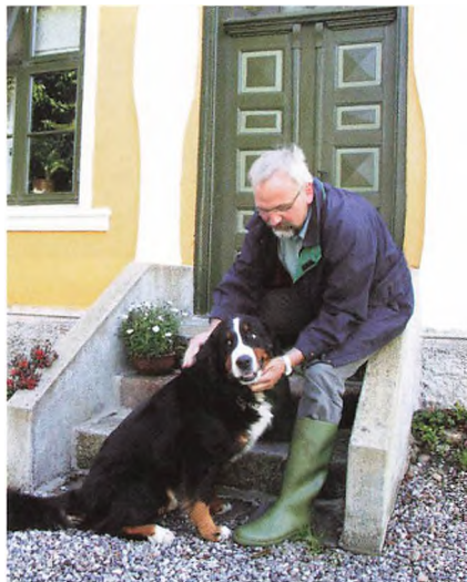
En trofast og tålmodig lytter til nye ideer i landbrugspolitikken