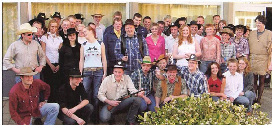
Fra cowboyfesten i april.