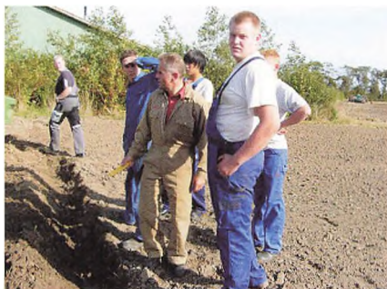
1A-ere ser om furekanten er skåret tilpas ren.

kendskab til rigtig brug af traktorens lift og øvrige betjeningsorganer, sikkerhedsmæssig/forsvarlig brug af traktoren og kørsel med almindelige redskaber.