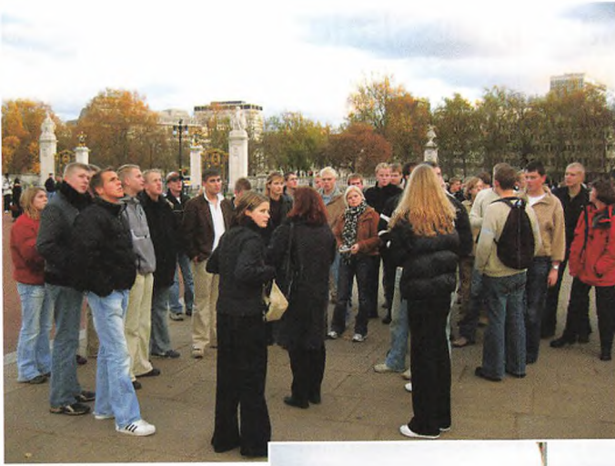
Øverst: Der var tid til at snuse til atmosfæ- ren i en rigtig stor- by.