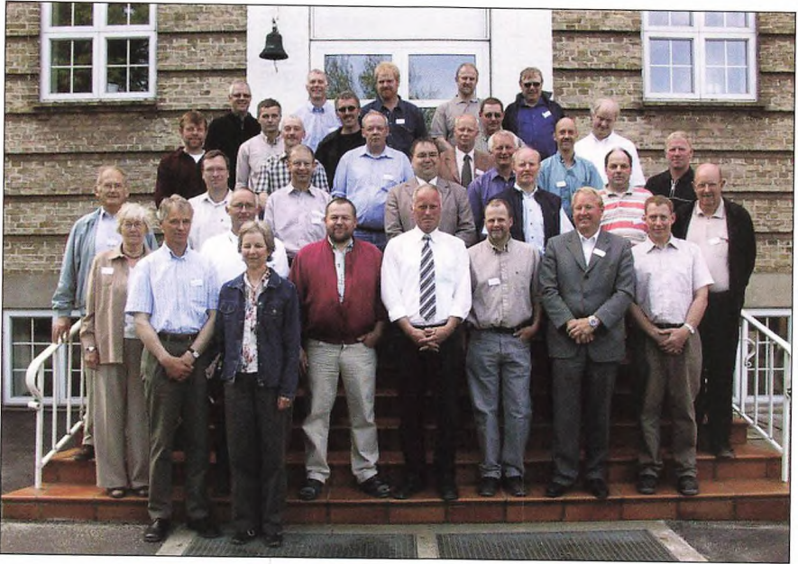
25 års jubilarer