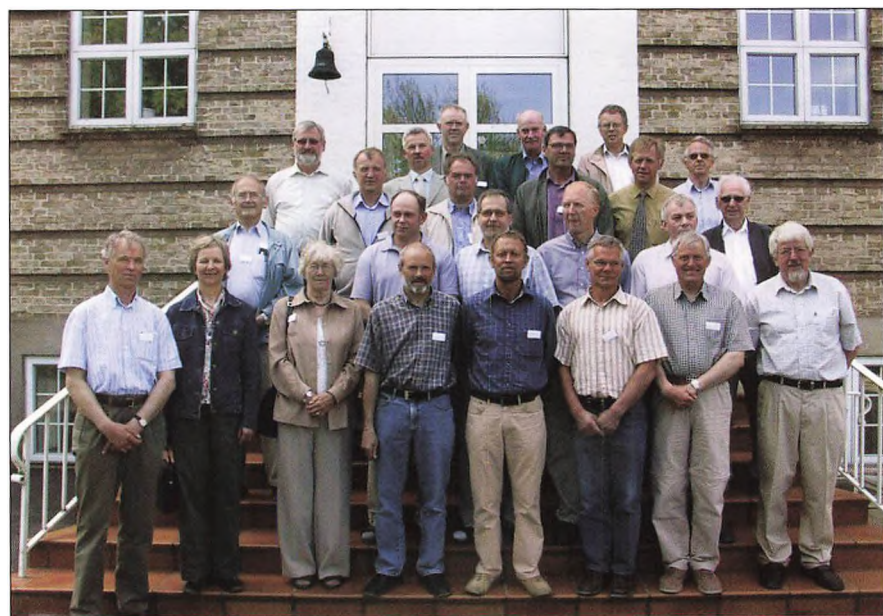
30 års jubilarer