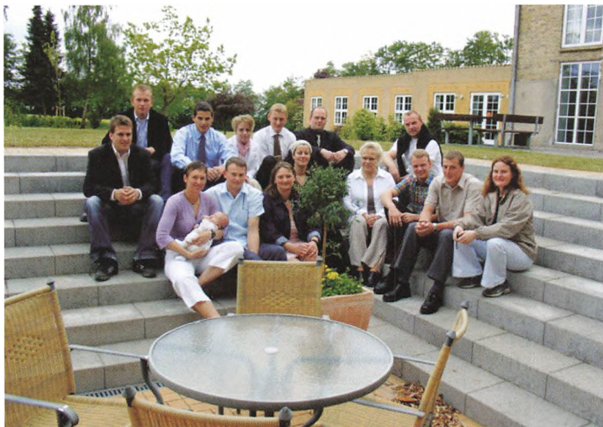
Hyggeligt samvær ved afslutningen på Modul 4