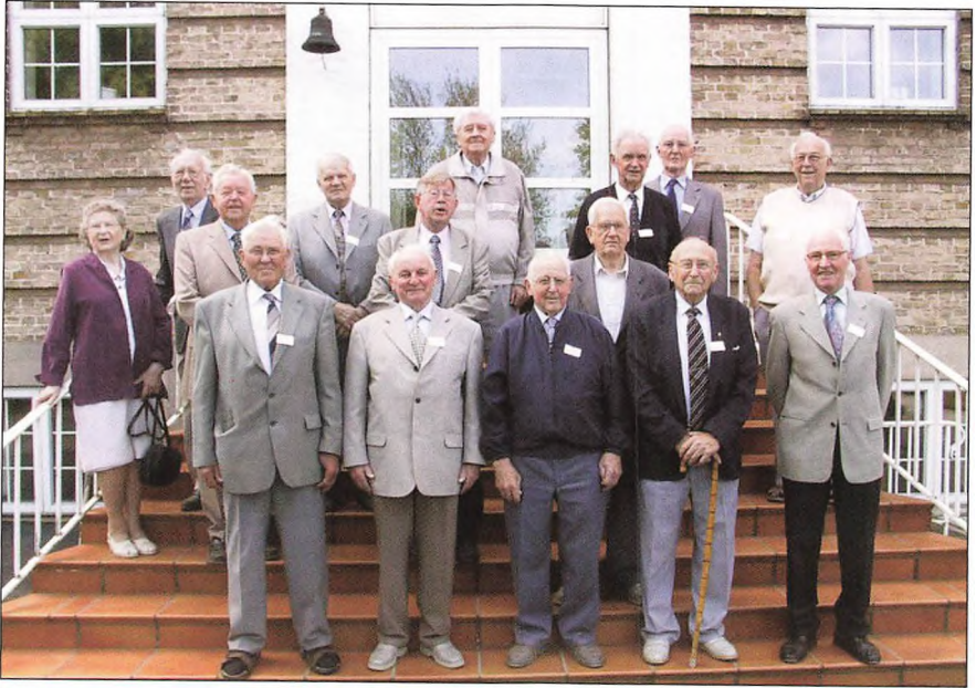
60 års jubilarer