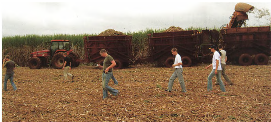
Øverst: Høst af 9 mill. tons sukkerrør på 60.000 ha.