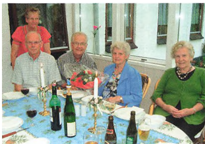
Gemytlet awten på Fiskbækvej