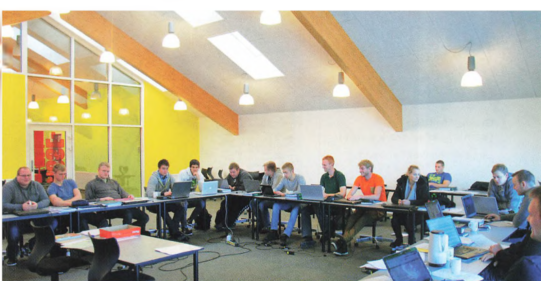
▲ Virksomhedslederne i helt nyt klasselokale. Samarbejde er nøgleord i udvikling af Gråsten Landbrugsskole.

profil baseret på gensidig respekt, samarbejde og dialog. De resultater jeg og mine tidligere medarbejdere har skabt, er opnået ved fastsættelse af ambitiøse mål, fælles referenceramme, klar kommunikation og et åbent og tillidsfuldt samarbejde. Som et eksempel kan jeg nævne resultaterne for Musik og Teaterhøjskolen, hvor jeg efter 6 gode år fratrådte forstander jobbet efter eget valg. Her havde vi, min bestyrelse og særdeles engagerede medarbejdere vendt højskolen fra en underskuds og lukningstruet virksomhed med få elever, til en succes med fyldt skole, overskud, fælles kultur og vision for fremtiden.