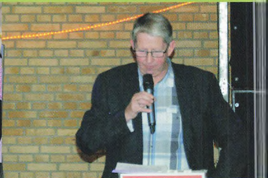
▲ PD har altid haft ordet i sin magt.

...og om aftenen var der oktoberfest for elever i hallen