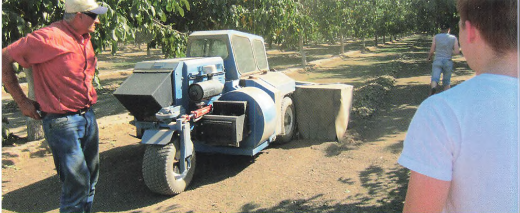
▲ Valnødder fejles sammen efter rystning af træerne

en lille time på egen hånd på skolens område i middagspausen. Det var absolut en oplevelse for vore danske elever at være sammen med så mange unge amerikanere og få et indtryk af den amerikanske skolekultur og deres uddannelsessystem.