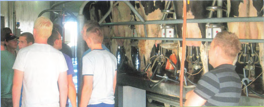
▲ På Elkhorn Dairy malkes der i en 80ér malkekarrusel