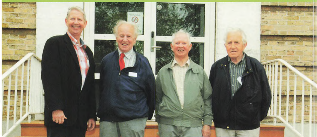
▲ Årgang 1951-52 (60 år)