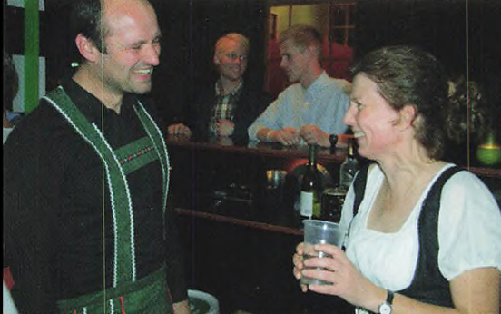
▲ Højt humor.