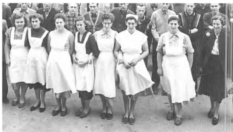
Forstanderpar og vore opvartende piger 1957-58.