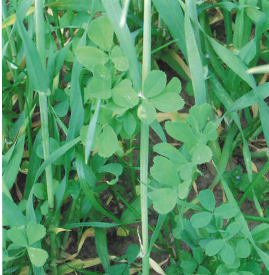
▲ Lucerne udlagt i vårbyg