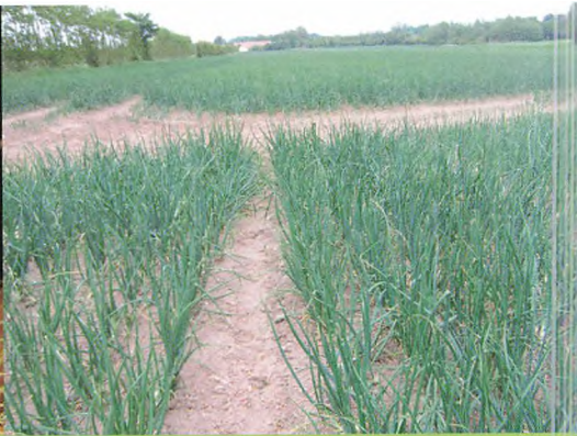
▲ Gyldensteen Gods