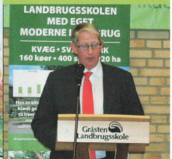
▲ .....og så kom turen til PD himself.