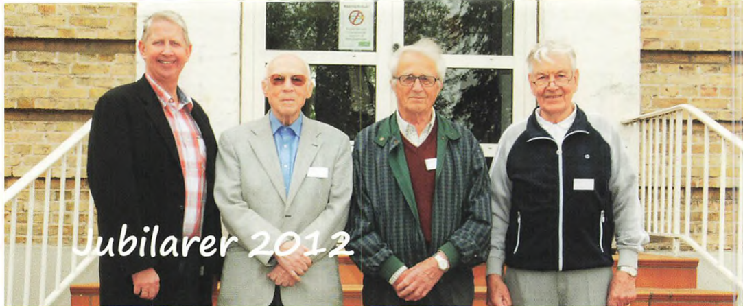
▲ Årgang 1946-47 (65 år)