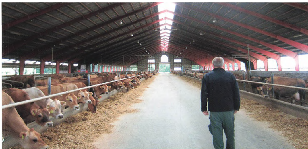
▲ 1000+ Jerseykøer med lucerne og majs på foderbordet

græskarplanter under fiberdug, som afsættes til Dansk Supermarked, med en stadig voksende efterspørgsel. Slutteligt var der rundvisning i jordbærmarkerne, hvor plukkesæsonen så småt var i gang, og der var rig mulighed for at smage på de dejlige danske jordbær.