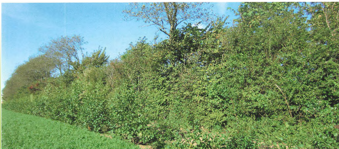
▲ Tøjtesløt fra kensigt vest for skoven ved sparrispløden