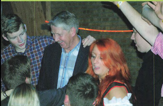
▲ En ombejlet herre.