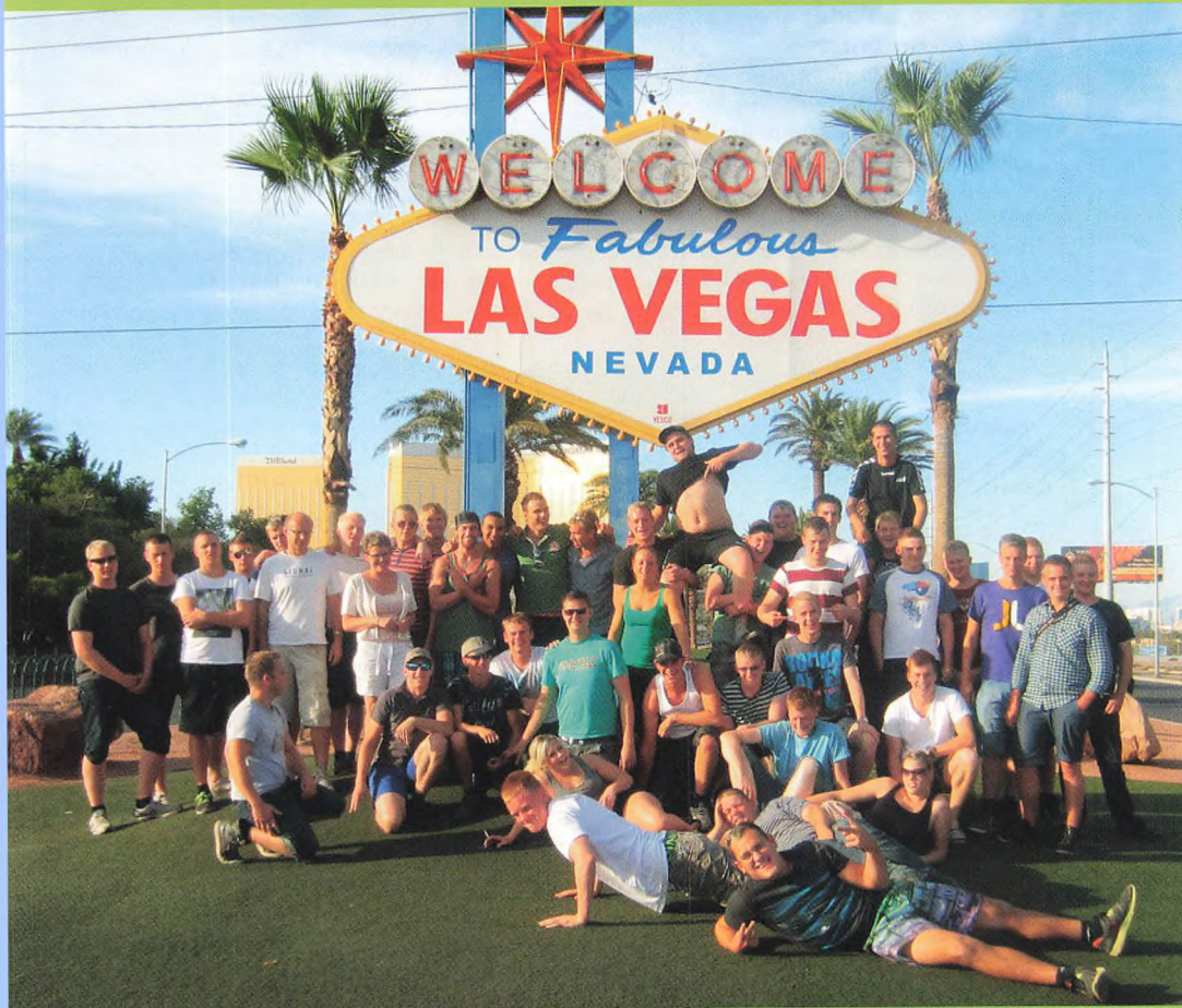
▲ Las Vegas Watch out here we come!