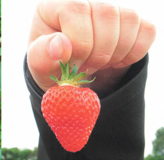
▲ Smagsprøver i jordbærmarken

kar, pyntegræskar samt som noget nyt, friske bønner til salater. Vesemosegaard har Danmarks største areal med hindbær, som rent etablerings- og arbejds-mæssigt er en meget krævende afgrøde, men som også kan give et tilfredsstillende dækningsbidrag, når ellers alt lykkes. Desuden så vi de endnu små halloween