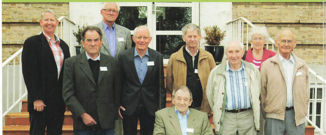
▲ Årgang 1956-57 (55 år)