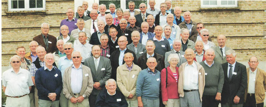
▲ Årgang 1961-62 (50 år)