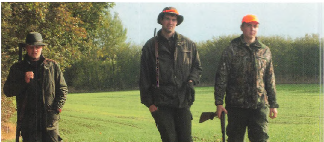
▲ Den årlige elevjagt blev afholdt i oktober i smukt vejr

Fødevareminister Mette Gjerskov har opfordret landbruget til at fremsætte alternative forslag til de ekstra efterafgrøder. Tidlig etablering af vintersæd har i praksis kunnet optage ekstra kvælstof om efteråret svarende til en veletableret efterafgrøde, så det er en oplagt mulighed udover de allerede eksisterende alternativer: reduktion af kvælstofkvoten, mellemafgrøder, efterafgrøder etableret på