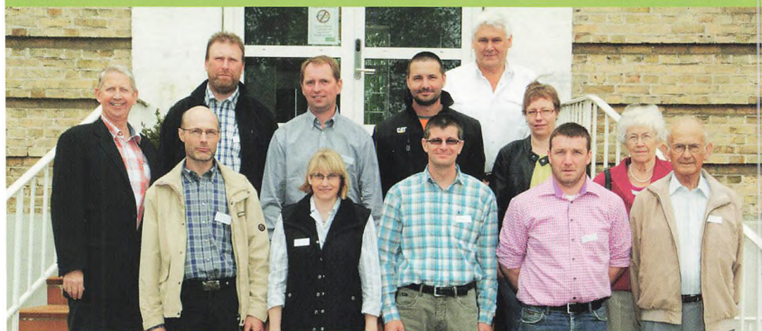
▲ Årgang 1992 (20 år)