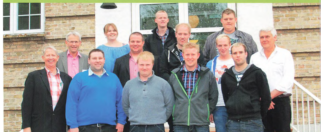
▲ Årgang 2007 (5 år)