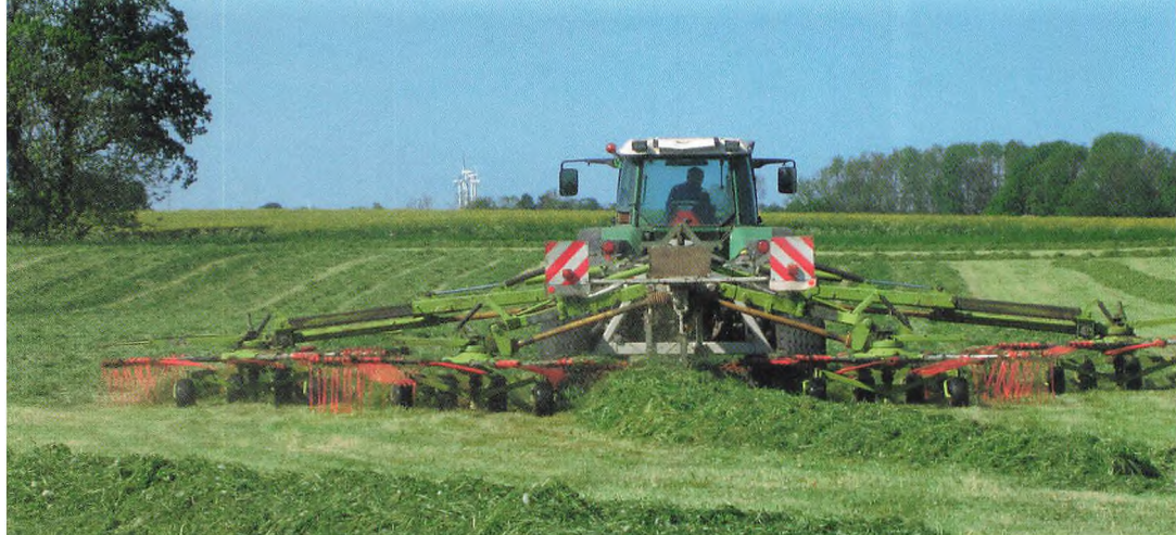
▲ 1. slæt rives sammen lige før pinse.

Sommermånederne blev køligere og mere regnfulde end normalt til glæde for kløvergræsset og ulempe for de øvrige afgrøder især majs. Kløvergræsset kunne heldigvis kompensere for et skuffende majsudbytte i år. Majsens stivelsesindhold er lavt i år og skyldes sikkert den kolde og solfattige sommer.