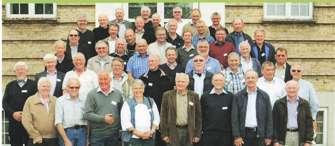
▲ Årgang 1971-72 (40 år)