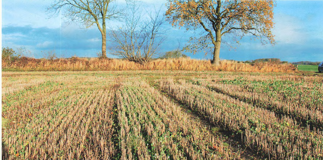
▲ Elreklamøde af Økocædøker under 1000, for firmaet i Svends: God fremstilling men dårligt udvalgt

anden bedrift, flerårige energiafgrøder eller gylleseparering og afbrænding af fiberfraktionen. Det er afgørende at den enkelte landmand frit kan vælge det virkemiddel som egner sig bedst på den pågældende bedrift.