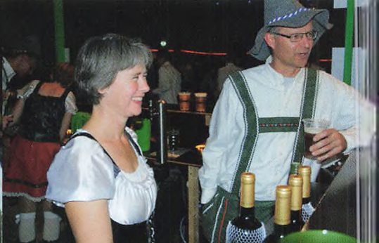
▲ Mere højt humor.