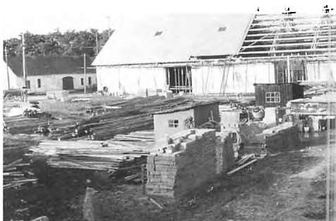
Der blev også bygget og renoveret i sommeren 1958. Udover lade, ny kostald også ny Naturskole og hestebokse.