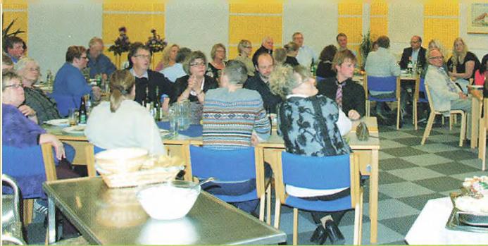
▲ Skolens personale i havesalen før at sige farvel.