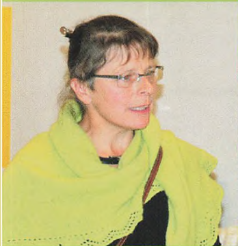
▲ Herle tog også ordet