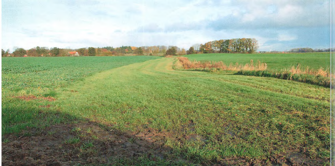
▲ Randzone på 10 ned mod Fiskbæk i vinterrapsmarken

grøder afhængigt af dyretætheden på ejendommen. Fra 2013 var det planen at udlægge yderligere 140.000 ha med efterafgrøder i de sårbare oplande, som afvander til fjorde eller søer. I praksis udvikler efterafgrøderne sig ikke altid som forventet, fordi jorden simpelthen er tømt for kvælstof efter høst eller, at etableringen ikke er lykkedes. Hvad er nytteværdien af en efterafgrøde i en sådan situation?