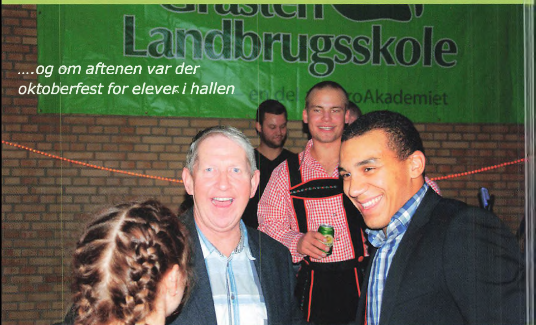
▲ Alle ville hilse på PD.

...og om aftenen var der oktoberfest for elever i hallen