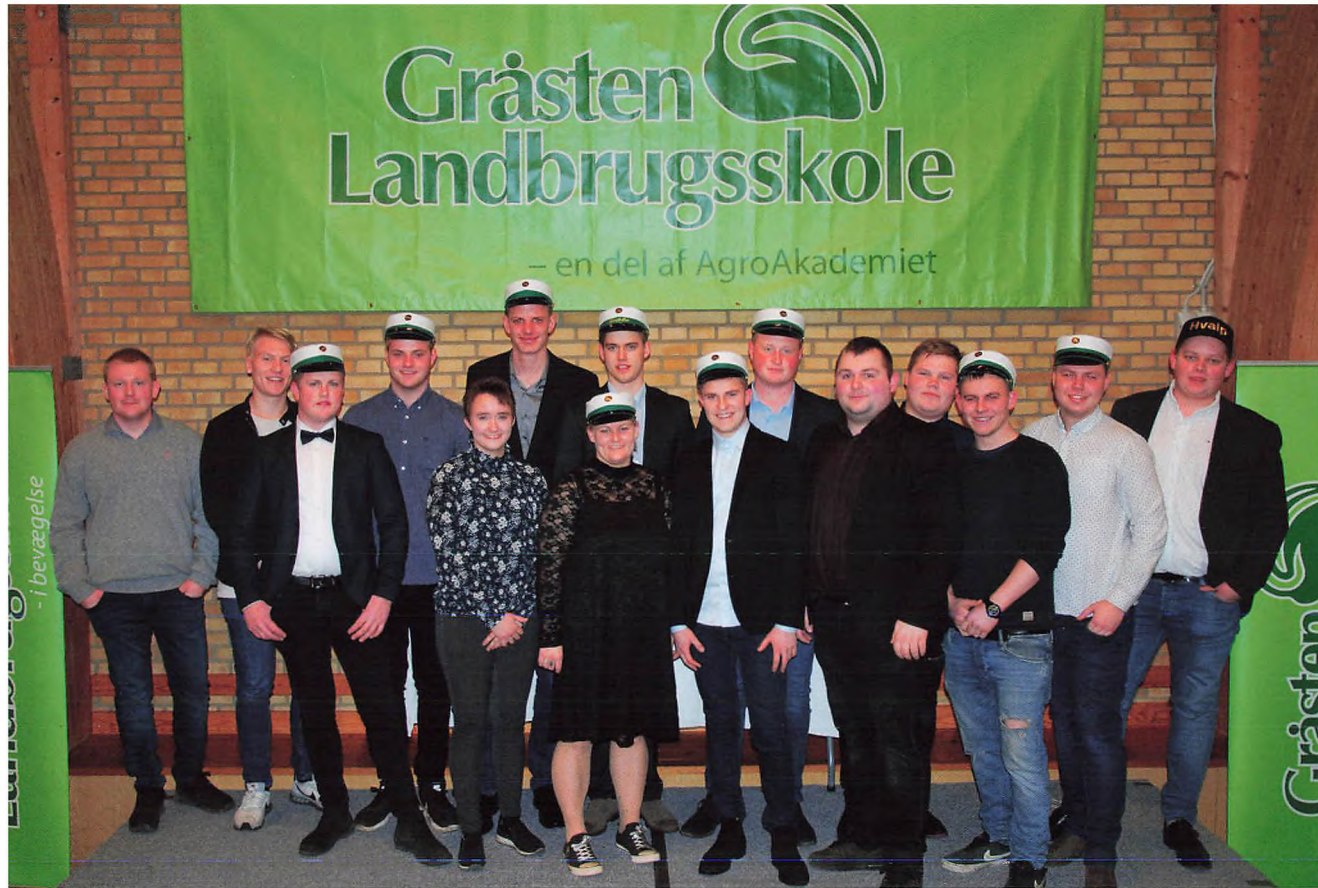
Landmand Planter 2018 (C-klassen)