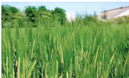
▲ Vinterbyg netop gennemskredet og i blomst.