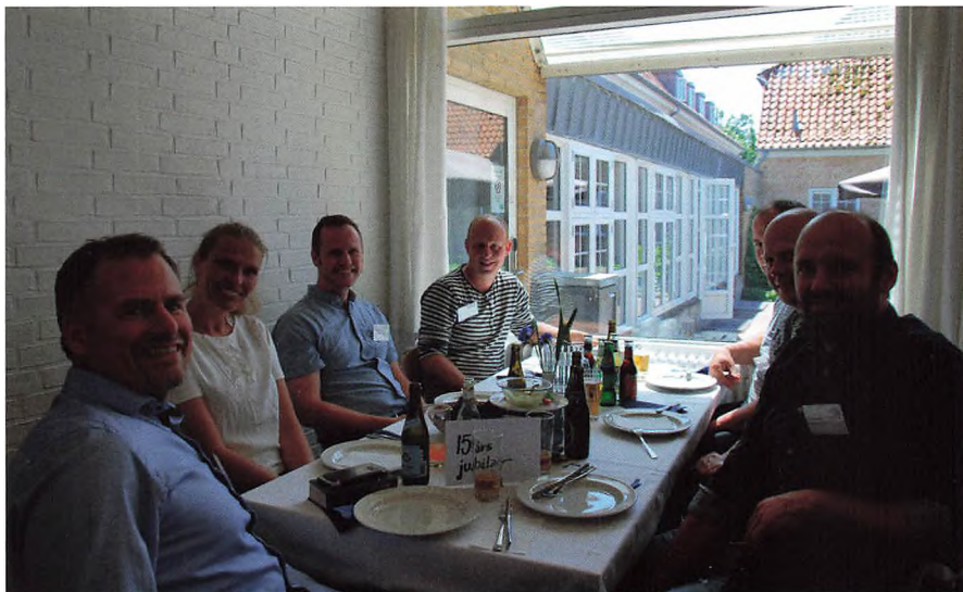
▲ Årgang 2003 er færdige med silden.