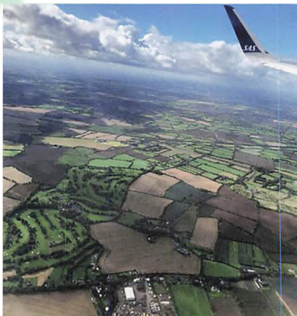
▲ Udsigt over Irland fra flyvinduet.

Vi rejste afsted fra Gråsten Landbrugsskole natten mellem d. 16. og 17. september, hvor vi blev hentet i bus og kørte til Københavns Lufthavn. Herefter fløj vi til Dublin med en mellemlanding i Oslo. Efter indkvartering på hotellet i Dublin gik resten af dagen med at udforske byen på egen hånd. Her var der nogen, primært pigerne, der fik tiden til at gå med at shoppe, mens andre var mere kulturelle og besøgte museer og Whisky destilleri. Dagen efter kørte vi fra Dublin, hvor rejseorganisationen Equipepeople havde planlagt vores tur, med guiden Heather. Vores første besøg var på øl-bryggeriet Guinness, som var en 7 etagers bygning. På hver etage kunne man læse om historien for bryggeriet og diverse stadier fra korn til øl. Det var interessant at opleve, hvordan Guinness har påvirket Irlands