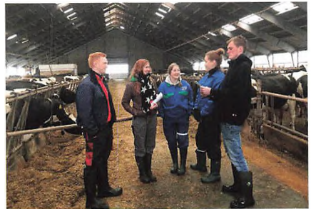
Løsning af en praktisk opgave mellem vores EUX elever og udenlandske elever.