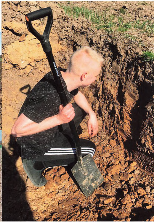
Fiskbæks lerede jord kan være tung at arbejde med.