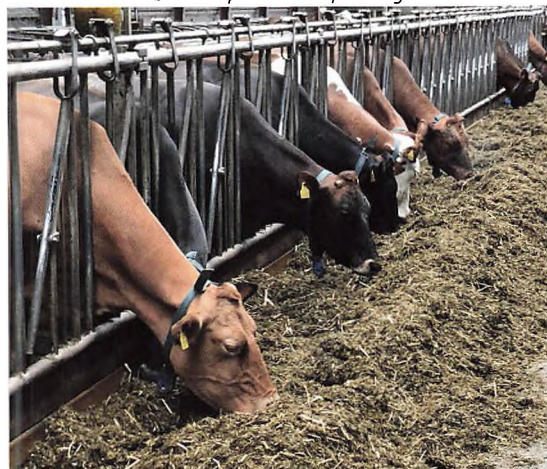
Røde køer på Mannerup Møllegård.