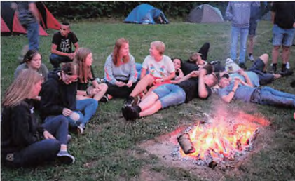
Der var også tid til bålhygge for at lære hinanden bedre at kende.