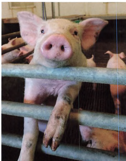
▲ En glad gris.

Sidste efterår startede vi op med et forsøg, hvor vi ville se hvor lidt zink vores grise kunne nøjes med. Vi må konkludere, at vi ikke helt kan undvære det. Vi kom ned på 800 ppm, så kan vi se at der begynder at komme problemer med fravænningsdiarre. Normalt tilsætter man 2500 ppm, så vi kan skære 2/3 væk uden at få problemer.