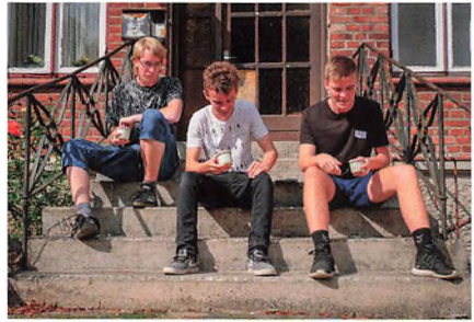
Der "rystes" smør i det dejlige augustvejr.