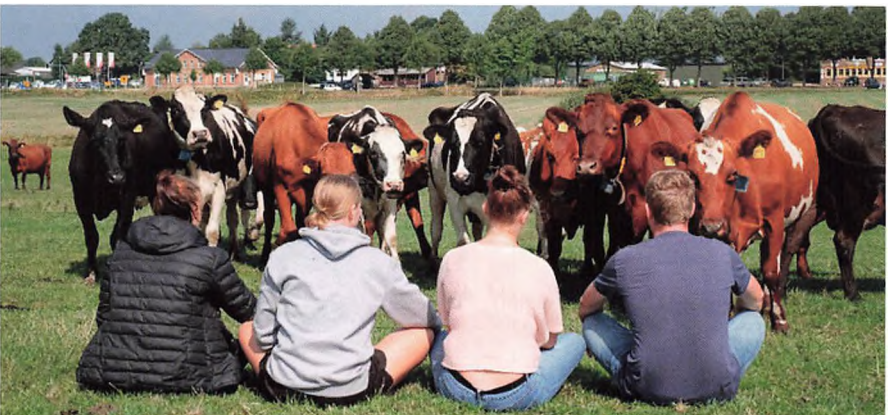
Og lidt kontakt til "det rigtige tyske landbrug" blev der også.