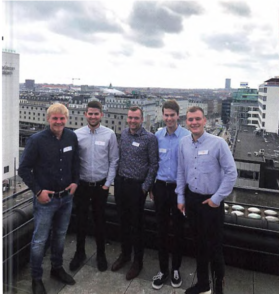
Højt til vejs på Axelborg.