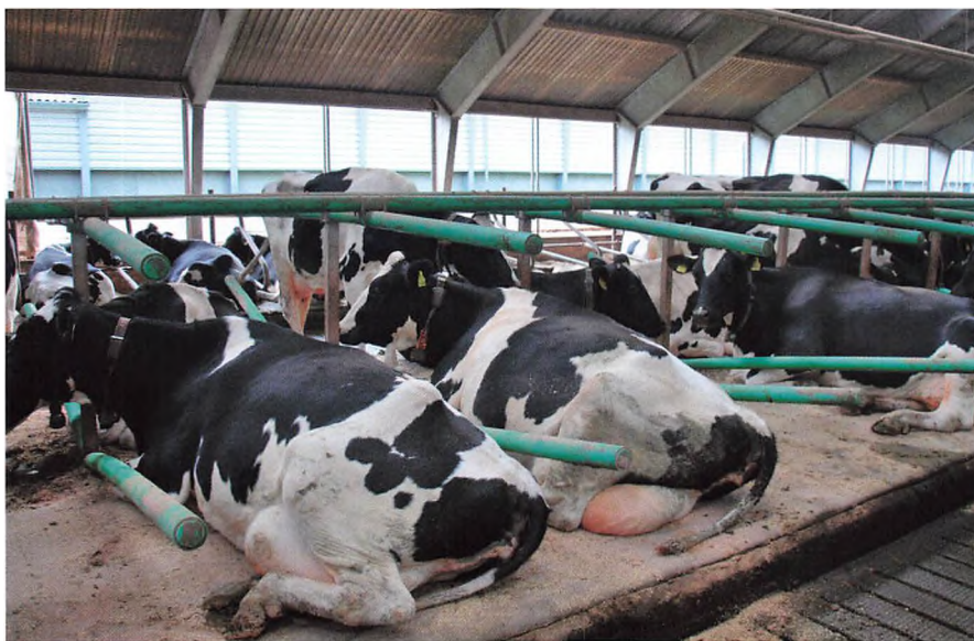
▲ De ældre køer nyder tilværelsen i de nye senge.

Fodringen af de malkende køer har igennem de seneste 12 mdr. kørt stabilt med fodermidlerne vist i nedenstående tabel. Med nye grovfoderlagre af prima kvalitet er det vores klare forhåbning, at køerne skal kunne æde en ration med en større andel grovfoder. Vi har desuden planer om at erstatte Cibomix 33 og sodahvede med Cibomix 22 og fint formalet majs. Formålet med denne justering er at gøre rationen billigere og opnå et højere restbeløb pr. ko.