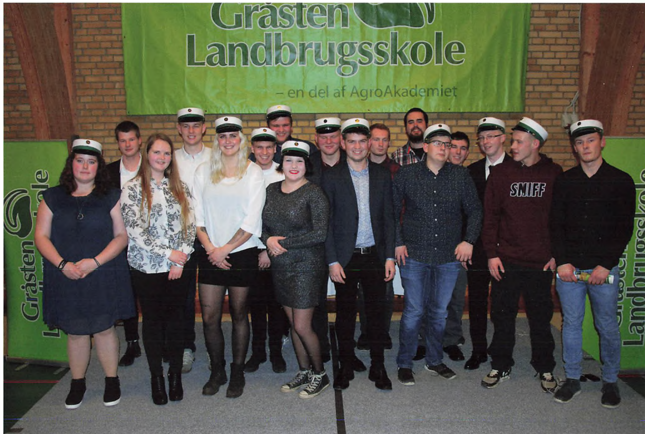
Landmand Kvæg 2018 (A-klassen)