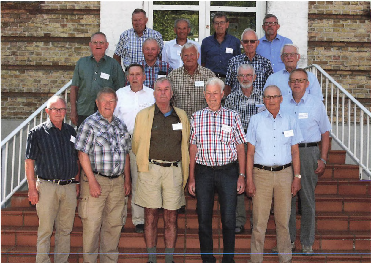
Årgang 1962-63 (55 års jubilæum)