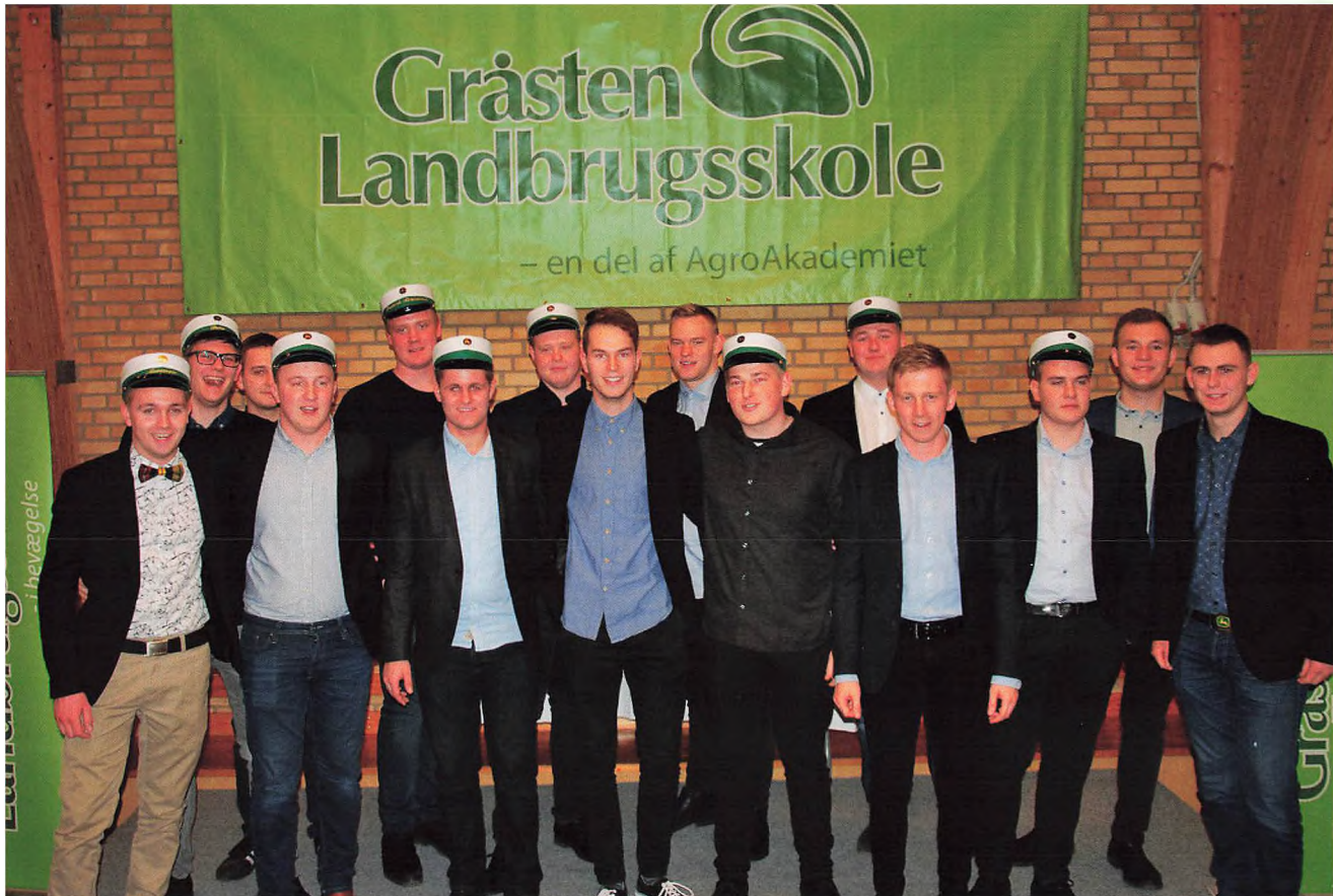
Landmand Planter 2018 (H-klassen)