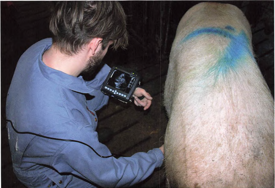
▲ Morten er ved at drægtighedsscanne søer.