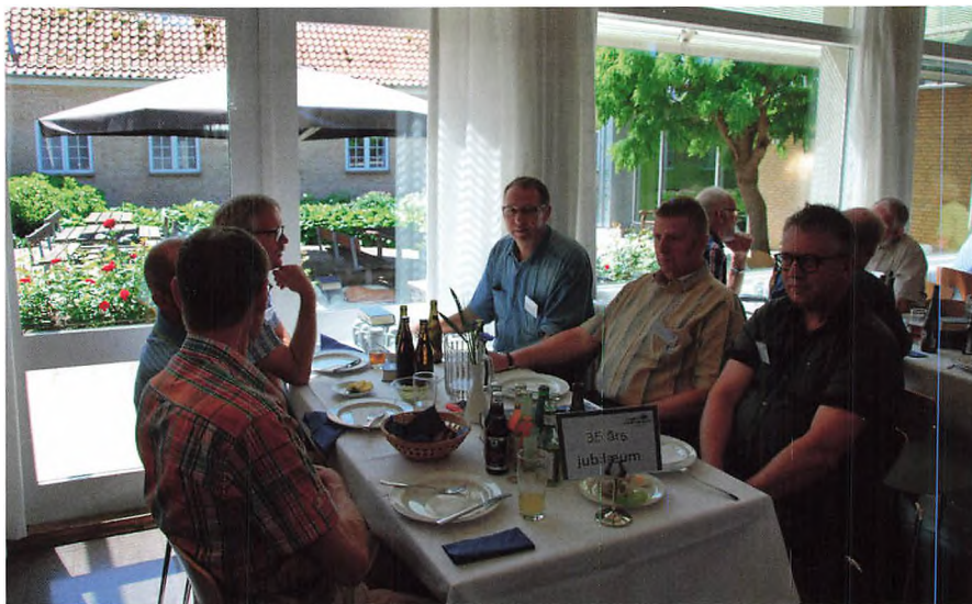
▲ Årgang 1972-73.

ordentlig høst. Uha, uha, det var vist ikke en smart beslutning vejret her i vækstsæsonen taget i betragtning.