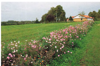
▲ Vejkanterne omkring Fiskbæk har stået i fuldt flor gennem hele sensommeren til glæde for folk og fæ.