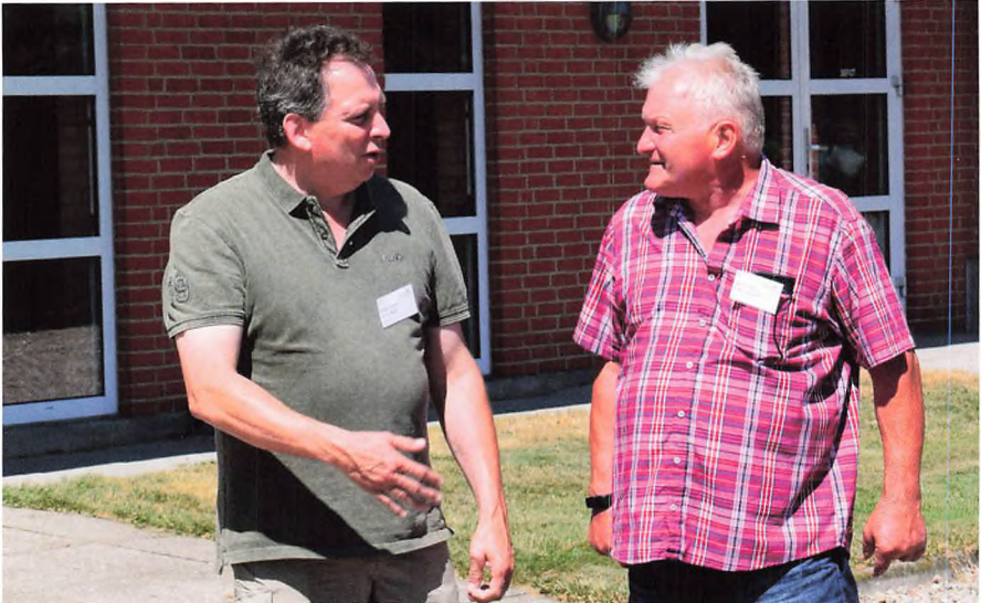
^ Til elevmødet mødes gamle venner.

rie sætter gang i arbejdsdagen om morgenen og står for papirarbejdet. Ægteparret har de seneste 6 år haft en medhjælper fra Ungarn. Datteren på 29 år, er dekoratør hos HM i Tønder, søn på 27 år arbejder som produktchef, den yngste søn på 25 afslutter uddannelsen til fysioterapeut i januar 2019.