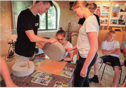
Der blev malet mel på gammeldags manér.