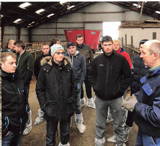
Faglig drøftelse i stalden.