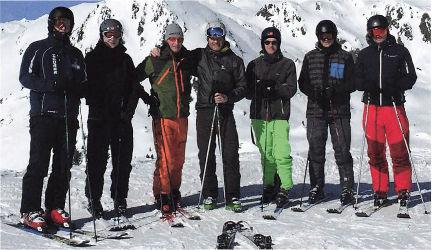
Der blev også tid til lidt skisport i Østrig.