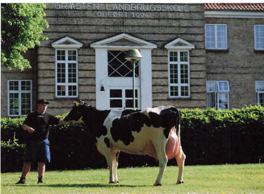
▲ Carsten sammen med 4. kalvskoen 4430. Koen fik 23 point på dyrskuet.