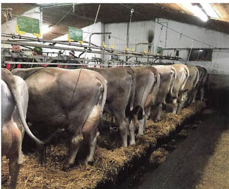
Malkekvægbrug i Zillertal, som AØ-holdet besøgte i marts.