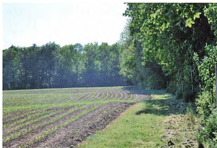
▲ Majsens spirede perfekt frem.