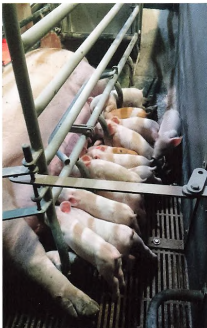
👉 Sørnerne malker godt.

Alle lysamature i stalden er på nuværende tidspunkt ved at blive skiftet til LED, så vi kan spare på strømmen. Vi har i år også skiftet alle foderkasser i farestalden, de var begyndt at stå og drysse