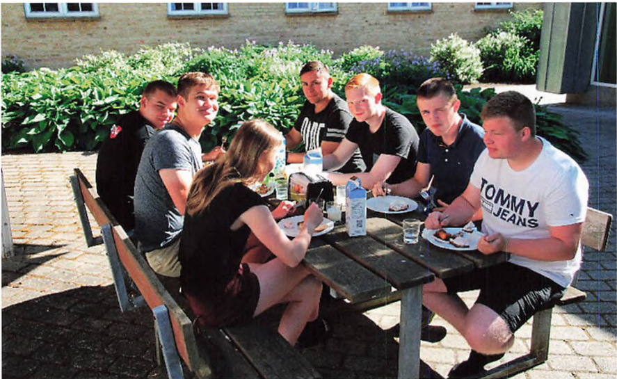
▲ EUX-elever fra forskellige årgange hygger.

Gymnasielærerne er hos GL ansat i huset, så vores elever skal ikke frem og tilbage til et gymnasie i nærheden. Derfor er hverdagen ofte en blanding af både landbrugsfag og gymnasiefag, hvilket også gør det lettere at arbejde tværfagligt mellem gymnasiefag og landbrugsfag, som er en stor fordel. Når det er muligt og giver mening, kombinerer vi også EUX-klasserne med de ordinære landbrugs elever i landbrugsfagene. Derfor ska-