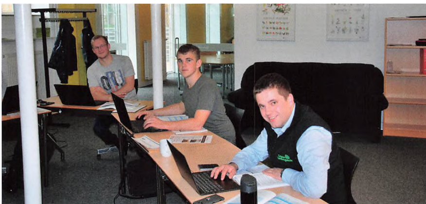
Godt humør i klassen!