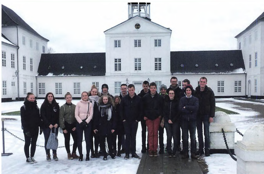
De 16 deltagere fra Belgien, Holland, Finland og Østrig foran Gråsten Slot.

– et samarbejde mellem 13 europæiske landbrugsskoler