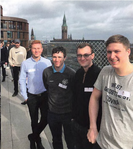
Med rådhusårnet i baggrunden.