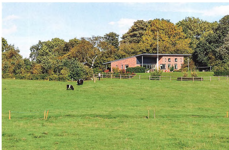
▲ Hjemme i Kollund.