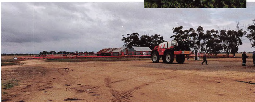
▲ Selvkørende sprøjte på 48 meter. Billedet taget af Jesper Wildenschild, der er i Australien i sin sidste praktik.