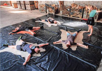
Der arbejdes kreativt.