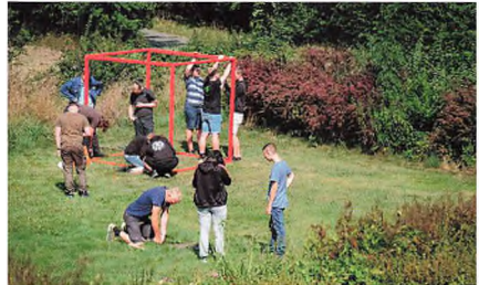
Fremstilling af kunstværker.