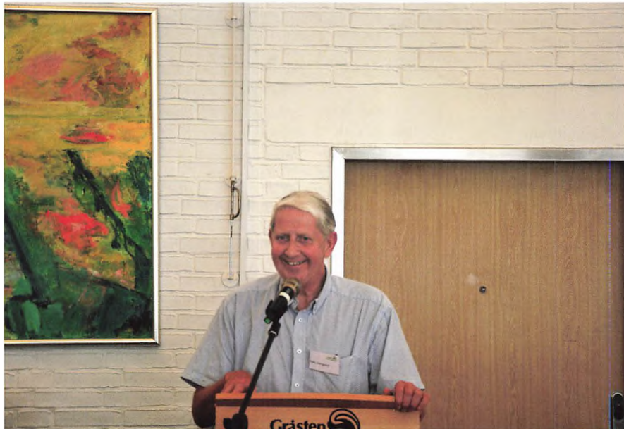
▲ PD er altid god for en tale ved jubilarmiddagen.

Ingen vækstår har vel været så forskellige - som 2017 og 2018. Fra den mest regnvåde sommer i '17, til den sommer med mindst nedbør, i de sidste flere generationer. Fra en besværlig høst - til den letteste høst. Desværre for lave udbytter, men uproblematisk. Fra et efterår i '17, hvor der blev tilsået alt for få marker med vinterafgrøder, til det letteste efterår. Selv stenene er blevet samlet (endog flere dage i oktober i shorts og T-shirt).