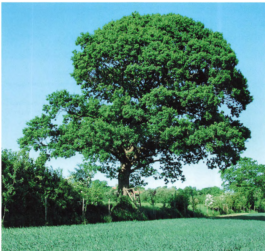
... Hvordan får vi stoltheden tilbage - og befolkningen med os?