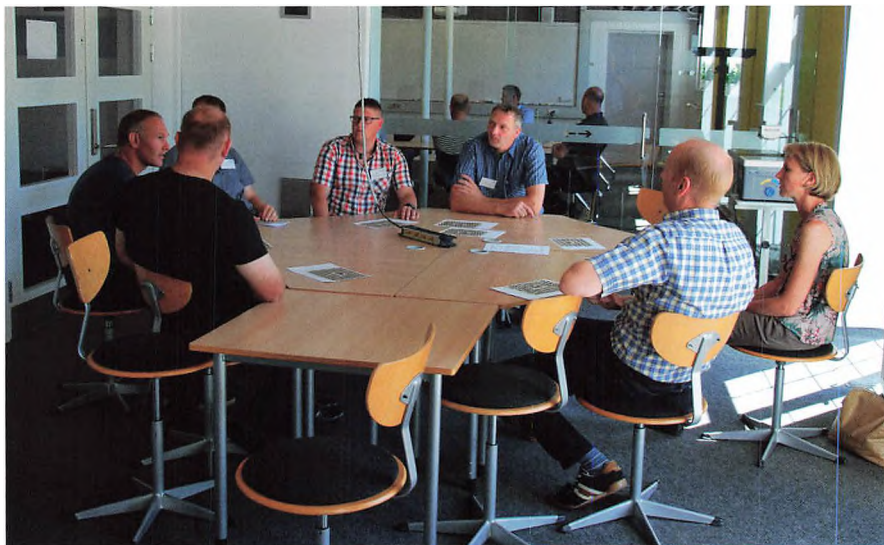
A Årgang 1998 udveksler erfaringer fra de 20 år, der er gået.

På bordet var årgangsbilledet også, vi tog turen rundt og det viste sig hurtigt at ved fælles hjælp så kunne vi fortælle lidt om hvad hinanden lavede. Vores veje havde siden GL delt sig mange gange. Nogle var stadig tilknyttet landbruget med ejendom eller ansat, andre havde et job som havde berøring med landbruget i en eller anden form og så var der