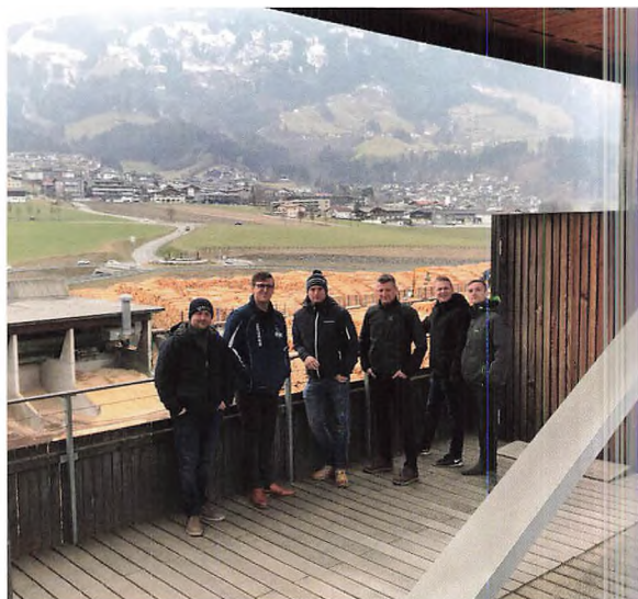
På et savværk i Zillertal.