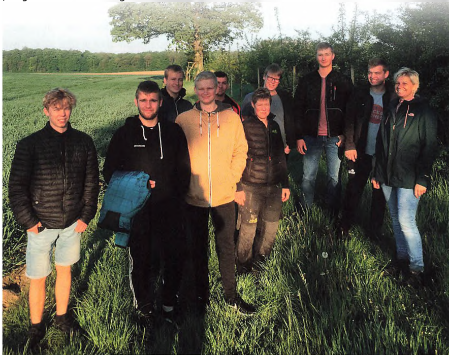
— En frisk flok på morgenfugletur i maj.

Hvordan får vi stoltheden tilbage i erhvervet, og hvordan får vi resten af befolkningen med os? Jeg er overbevist om, at vi må starte med os selv og ændre den måde vi kommunikerer på. Vi skal være langt bedre til at fortælle om vores vision med den produktion vi har. Vi skal være ærlige omkring ting vi gerne vil forbedre, for selv i den bedste produktion er der forhold som kan forbedres. Som eksempel kan nævnes den udbredte praksis der har været med at aflive nyfødte jersey-tyrekalve, fordi der ikke har været økonomi i at opfede dem. En del landmænd med jerseybesætninger har udtalt, at det var dem meget imod at aflive en nyfødt kalv og det ville de lave om på, og med det resultat at disse landmænd nu har fået en