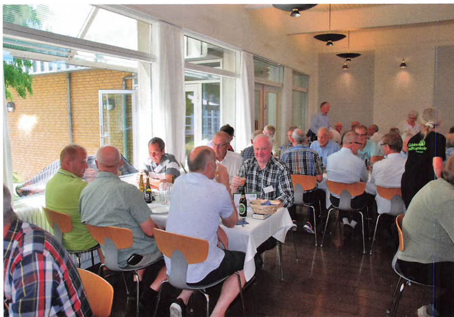
▲ Her ses bl.a. 40 årsjubilæerne