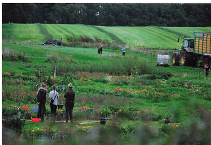
▲ Haver til maver og 4. slæt til kostalden.