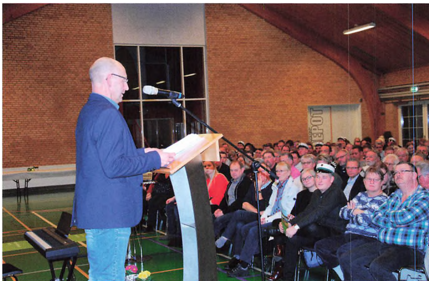
▲ Mange landmænd mener, at dannelse, grundviden, ydmyghed og nysgerrighed er det vigtigste eleverne kan lære på skolen.

Antallet af elever som er startet på landmandsuddannelsen har i de senere år ligget ret stabilt imellem 500 og 600 elever om året på landsplan. Det ser straks noget mere bekymrende ud når vi kigger på tallene i den anden ende af uddannelsen. På agrarøkonomuddannelsen startede der for fem år siden 249 elever og i år er tallet faldet til 77. Tallene