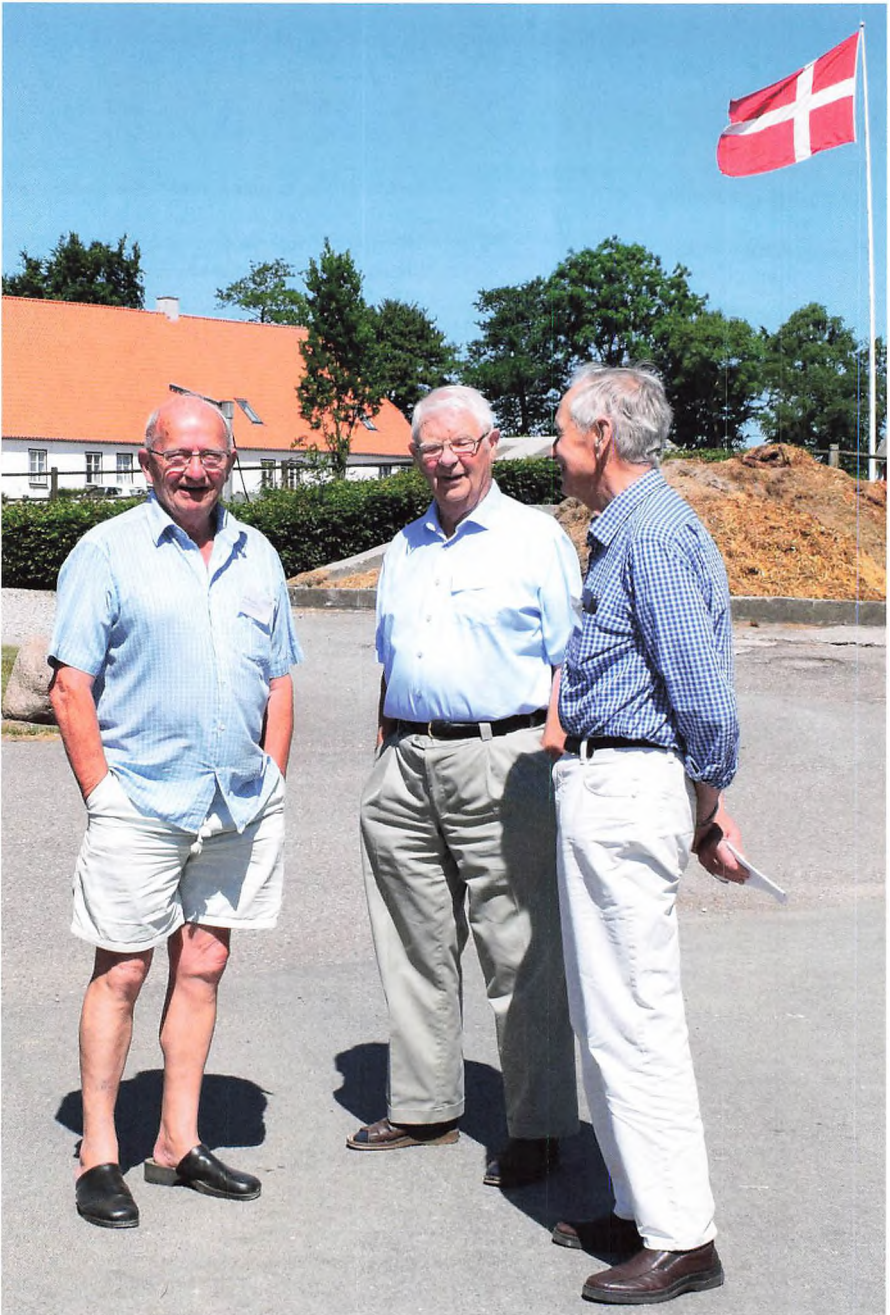
Årgang 1957-58 skulle lige se gården.