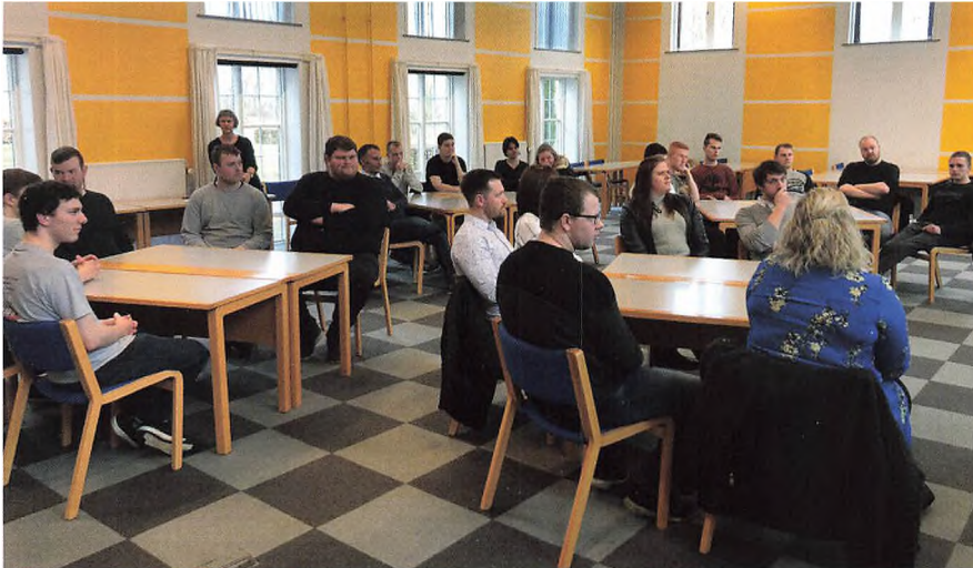
I maj var der igen ledernetværksaften.