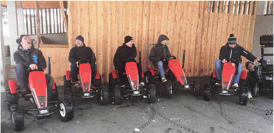
Sjov og ballade.