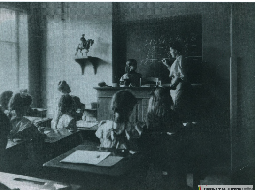
Fra en regnetime på N. Zahles Skole, udat.