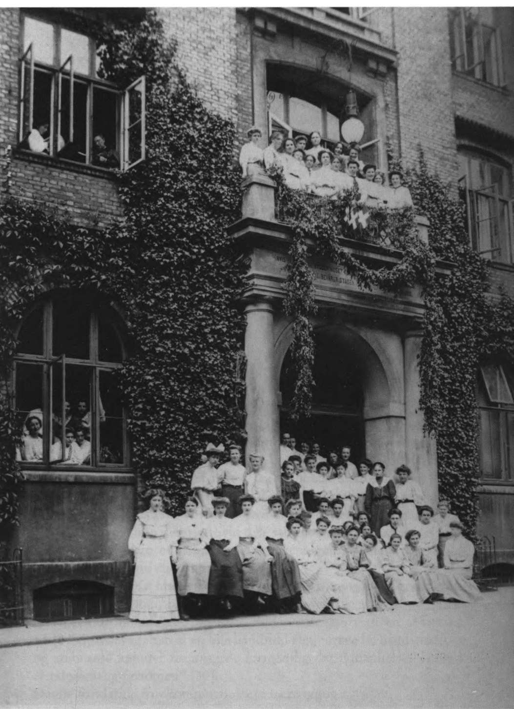
Eleverne formelig vælter ud af hoveddøren til N. Zahles Skole. Fotografiet er næsten et sindbillede på den succes, som den ældre Natalie Zahle ved sin fratræden kunne notere for sin skole, 1900.