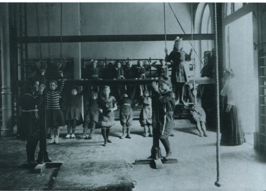
Fra en gymnastikttime på N. Zahles Skole, udat.