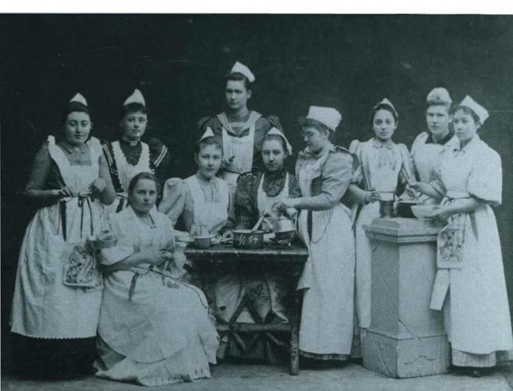
Klasse fra N. Zahles Husholdningsskole, januar 1894.