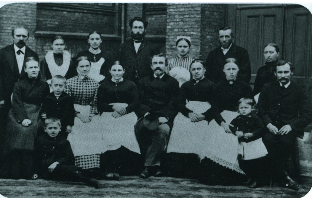
Tyendet på N. Zahles Skole 1889.