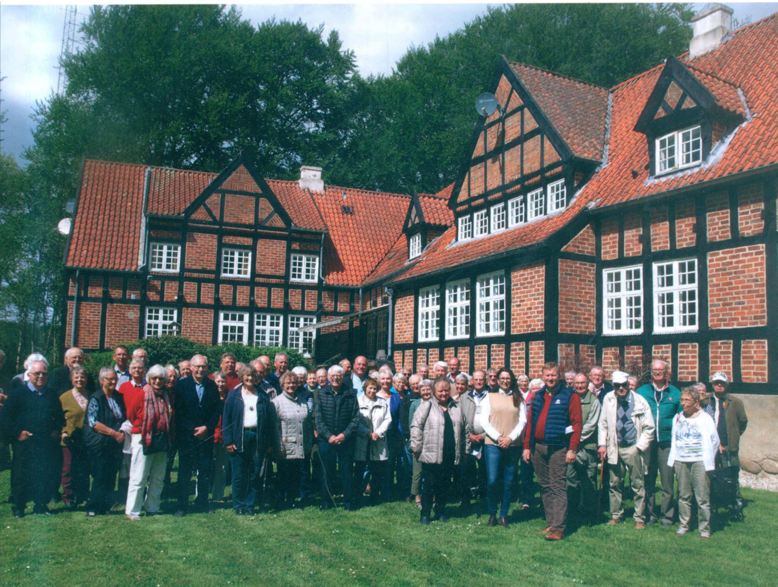
Fra årsmødets besøg på Gammel Wiffertsholm