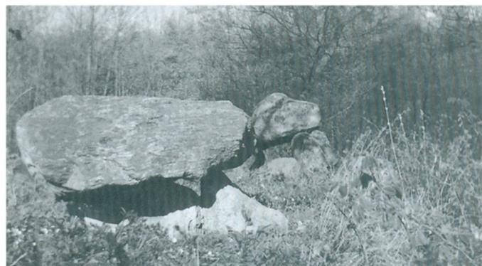
Stendysse i Brandelevholme skov er en anelig langdysse der måler 6,5x18 m med to gravkamre. Det østligste med 2 bæresten og 1 dæksten, det vestligste med 3 bæresten og 1 dæksten med mange skåltegn. Privat foto 1980.

Ældste søn Lars blev gift i 1802 med Birthe Pedersdatter. De boede hjemme på Skovgaard indtil 1806, da de købte Ørbækgaarden i Brandelev.