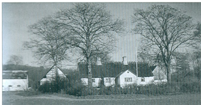
Skovgaard Brandelev 1980