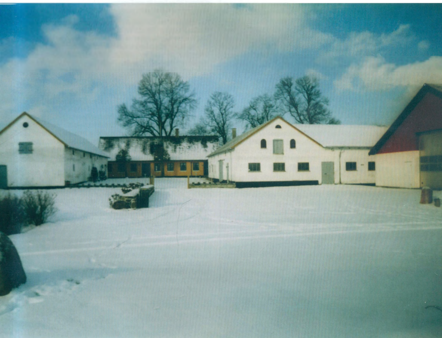
Lindebjerg på Tuse Næs