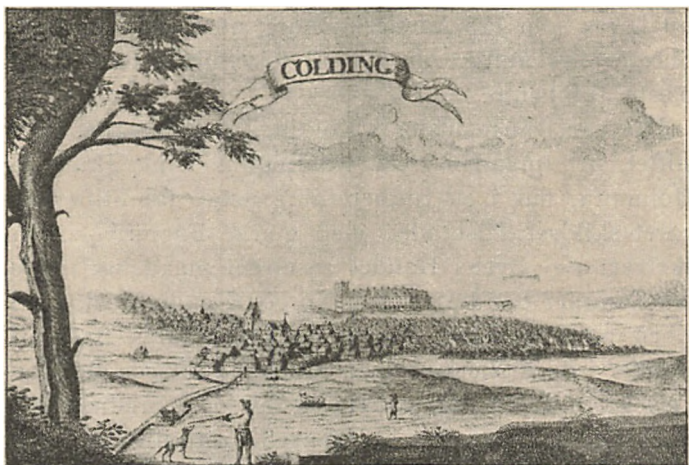
Kolding (set sydfra) i Slutningen af det 18. Aarh.

N AAR Kolding borgerlige Skydeselskab sætter 1786 som sit Stiftelsesaar, er det ikke for at rose sig af sin Alder, tværtimod kan det roligt lægge et Aar til. Efter en Fortegnelse over de ældste Sølvskjolde paa det gamle Kongebaand og Indskriften paa Kongegevinsten har den første Skydekonge tilkæmpet sig sin Værdighed den 12. September 1785. Grunden til, at 1786 er bleven antaget for Stiftelsesaaret, er, at der i den ældste Protokol, der begynder 1789, nævnes tre forudgaaende Konger uden Angivelse af Skydeaar, hvorfor man simpelthen har trukket 3 Aar fra uden at bemærke, at der ikke har været afholdt nogen Skydning 1787 uvist af hvilken Grund. Denne Fejl er først bleven opdaget, da Kongegevinsten, en smukt graveret Sølv Polageske, blev skænket til Museet paa Koldinghus.