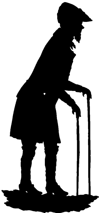
Ovenstaaende Billede er gengivet efter en Silhouet, der endnu findes i den gamle Gaard, hvor han har boet, Gaarden Nr. 7 paa Hjørnet af Adelgade (nu Bredgade) og Østergade.

Naar Folkene var ude paa Arbejde, gik han ofte hen at se paa, om de fik noget udrettet. En Dag kom