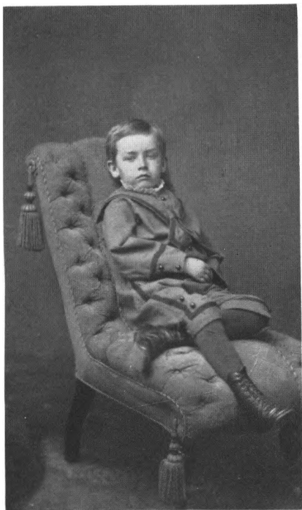
Fra barndommen i Pjedsted præstegård.