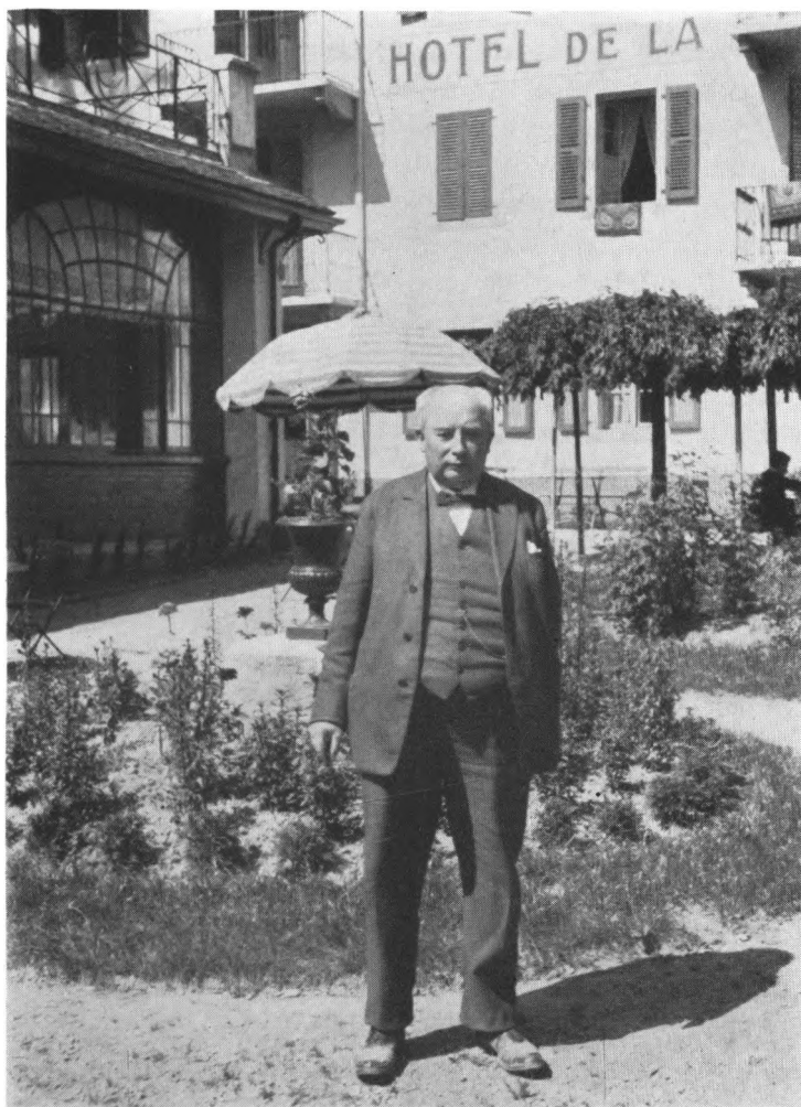
P.i rejse til økumenisk møde.