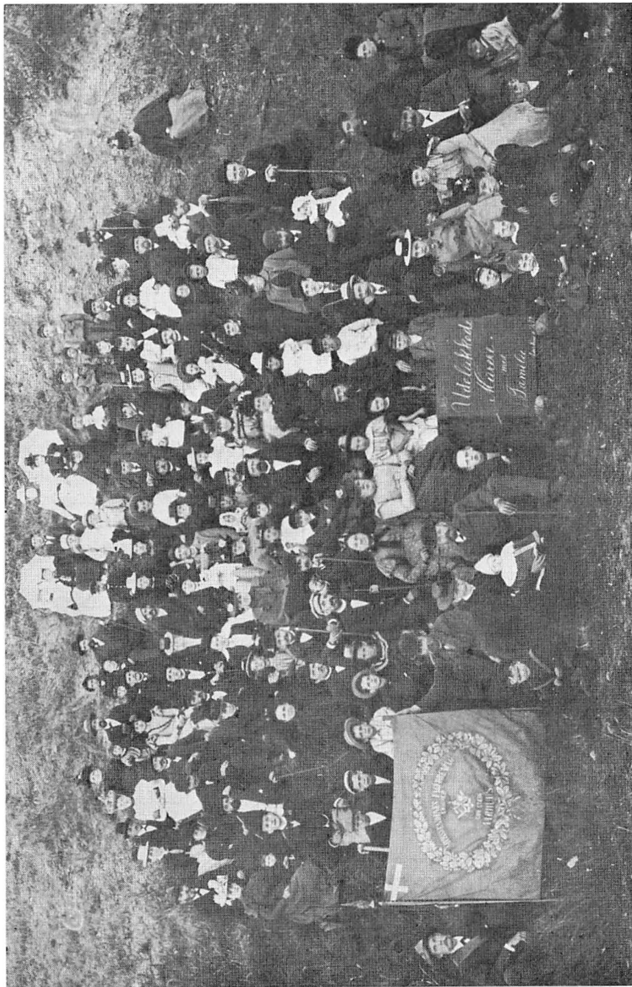
For at få tiden til at gå og for at opmuntre de lockoutede arbejdere arrangerede de fleste fagforeninger udflugter for deres medlemmer med koner og børn. Her ses lockoutede murersvende og deres familier under en sådan udflugt i den lange lockoutsommer.