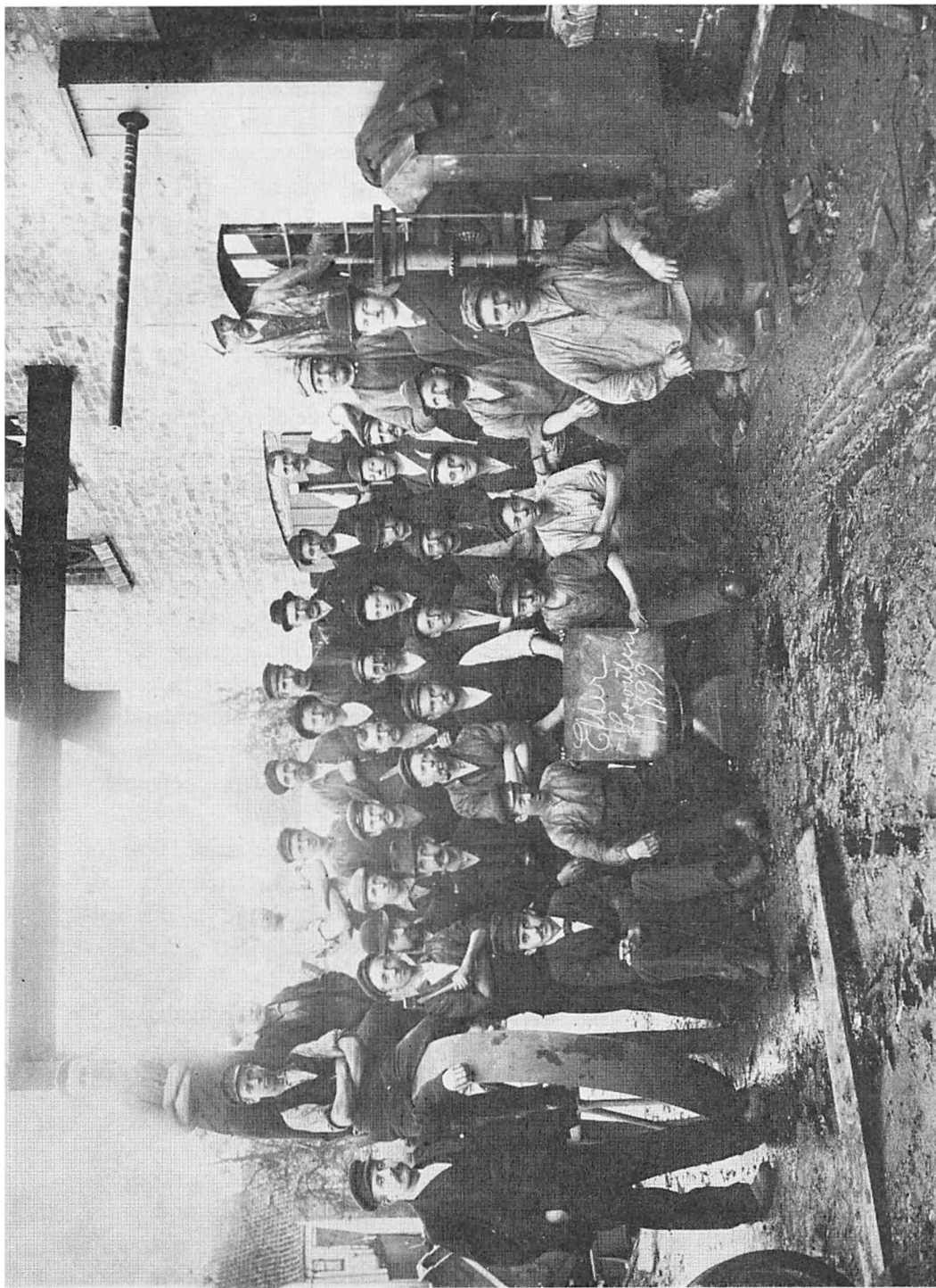
Arbejderne fra L. Andersens klokkestøberi i Mejlgade lod sig fotografere efter arbejdets genoptagelse, et vidnesbyrd om den historiske betydning, man allerede i samtiden tillagde generallockouten og Septemberforliget.