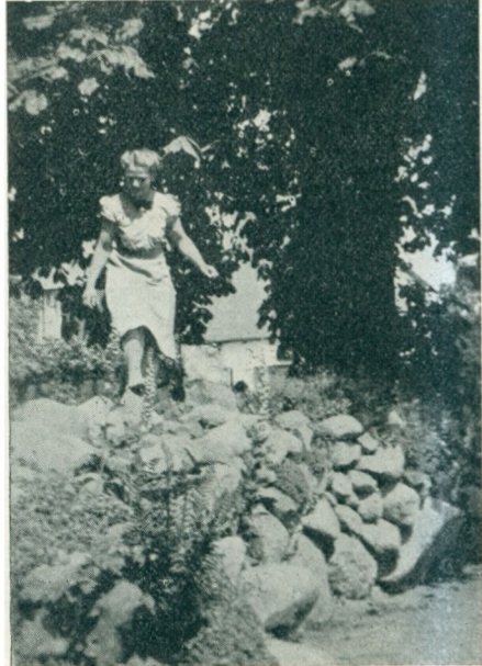
En »Blomst« i Stenhøjen.

i verden, men de havde ogsaa gjort os lykkelige og glade gennem de mange aar, saa vi nu kunde føle den dybeste taknemlighed. Og denne tak vil vi gerne sende til hver enkelt af jer, der læser dette, og til mange, mange flere.