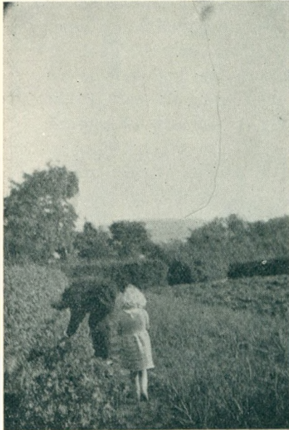
To »Jordbærtyve«. Sommer 1941.