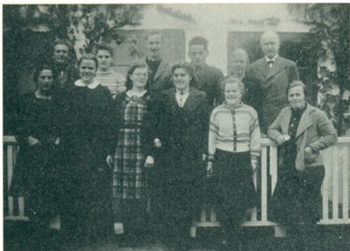
De fleste af Efteraarsholdet 1940.

Jeg nævner dette for jer gamle elever, fordi jeg gerne vil forklare jer, at vi kæmpede for vor skole til det sidste.