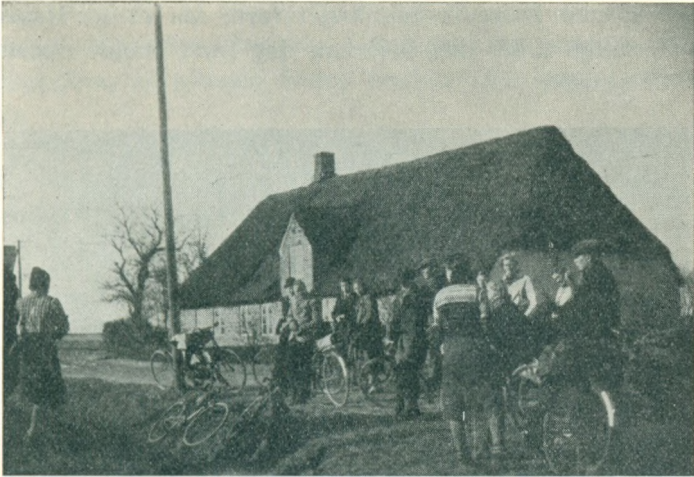
Ved Gallehus. Vinter 1941 i Marts.

D. 12. marts cyklede eleverne til Rudbøl, Tønder, Møgel-tønder, Abild og Løgumkloster paa en 3 dages tur. Det blev en god tur, vellykket i alle maader og rig paa oplevelser.