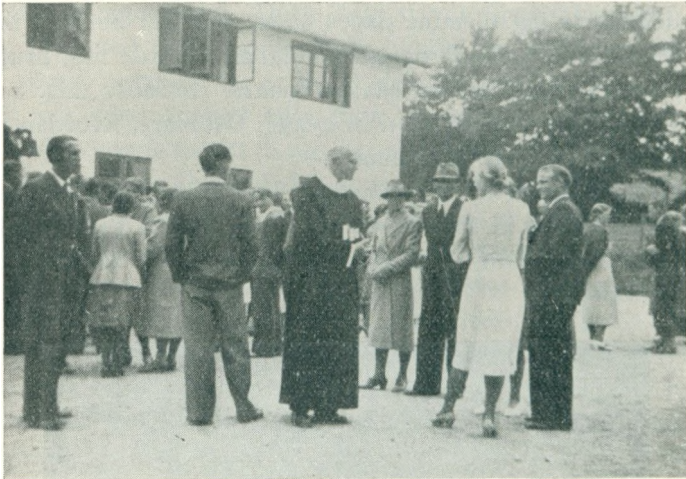
Efter Gudstjenesten ved Elevmøde 1941.

Elevmødet d. 5. og 6. juli var præget af, at det var sidste gang, min kone og jeg stod som skolens ledere. Der var derfor kommen flere gamle elever end til noget tidligere elevmøde. Jeg tror nok, at det for os alle blev festdage, som vi aldrig kan glemme. Den vemod, som naturligvis maatte trænge sig paa hos os alle, fordi det var sidste gang, min kone og jeg fra vor skole og fra vort hjem kunde byde jer velkommen til Rønshoved, blev det gjort os let at bære af et haab og i en tro, der gav os forjættelse om en velsignet fremtid.