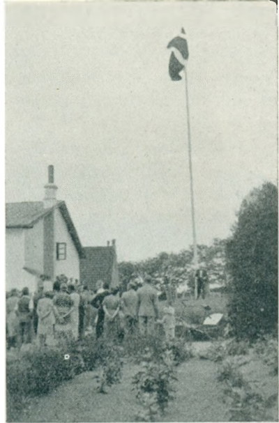
Vort store Danebrog sænkes for sidste Gang i Rønshoved ved Elevmødet 1941.

D. 9. juli gæstedes skolen af Skanderup efterskole.