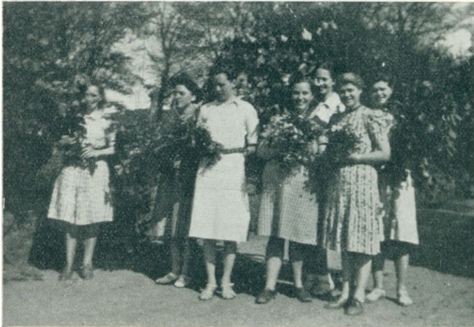
Fo ajle di smaa Blomster dæ' dov æ' te i Aar. —

handlingerne. Disse forhandlinger førte saa til, at Haarder købte skolen d. 16. juni, idet han dog først skulde overtage den til oktober.