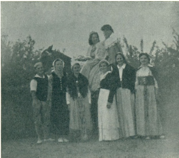
»Riseli gaar i Bure.«

Den 23. havde vi Sct. Hansfest. Før baalet, som jo skulde tændes allerede kl. 21, opførte eleverne »Riseli gaar i Bure«. Det gjorde de kønt, og sangen lød smukt i den skønne, stille sommeraften.