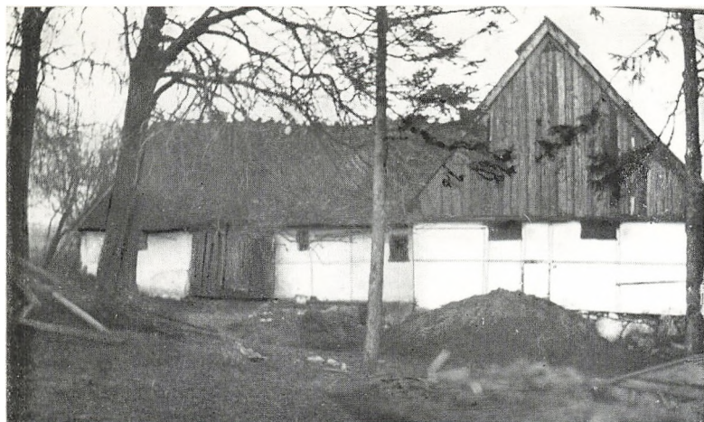
Gammel gård i Karlebo sogn. Gård med lerklinede vægge og bræddegavle. (Skorbækgaard, brændt 1936).