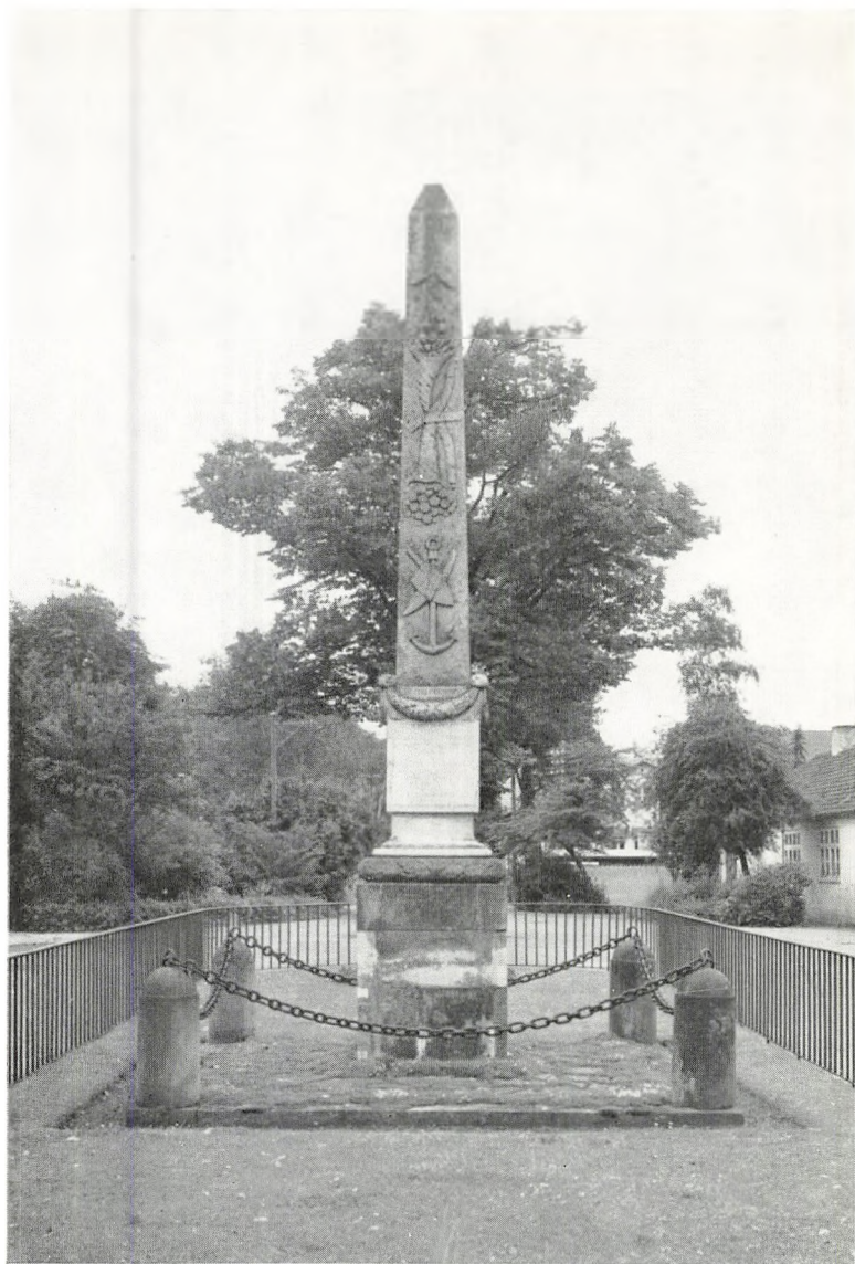
Stolbergsstøtten i Hørsholm. Tegnet af den franske kunstner Jardin.