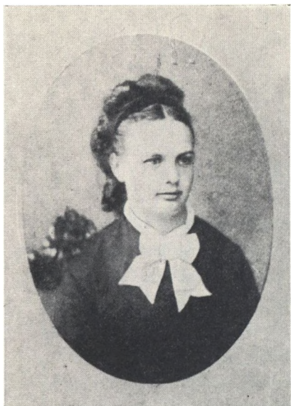
Mor som ung pige