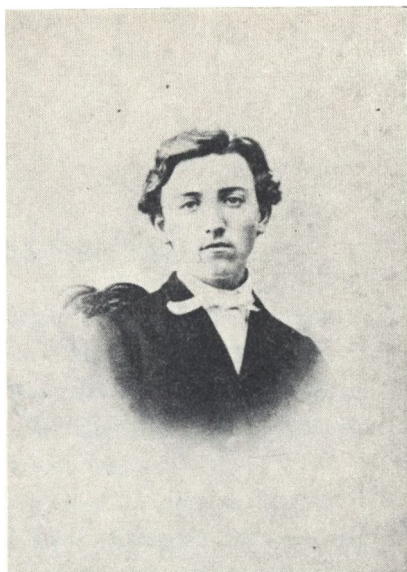
Far som ung