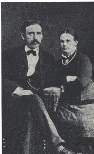
Far og mor som unge