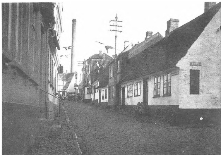
Jørgen Nielsens barndomsgade, St. Jørgensgade i Sønderborg, som den så ud i 1920 under afstemningskampen. Gaden lå i Sønderborgs arbejderkvarter. Fot. i Historiske Samlinger for Sønderjylland.

borgske skib, aldrig mere nåede der en efterretning fra en eneste af besætningen til hjemmet, så fartøjet må sikkert være gået under med mand og mus i en orkan eller tajfun. År efter år ventede vi på at høre noget, men forgæves og efterhånden svandt håbet helt bort, så minderne kun blev tilbage og det sidste minde om skibet og dets triste skæbne er nu et billede af samme, som forefindes i afdelingen for gamle sønderborgske skibe på museet i Sønderborg Slot. Billedet viser her »Salamander« for fulde sejl og med Dannebrog vajende under gaffelen.