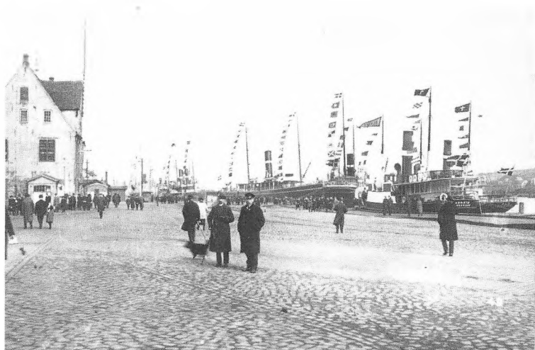
Danske afstemningsskibe ved Flensborgs skibsbro. Til venstre Kompagnihuset. Men de danske tilrejsende kunne ikke opveje dem sydfra.

stort propagandaarbejde i hele Tyskland for at få fat på så vidt muligt ethvert menneske, der var født i 2. zone eller ved længere ophold her havde ret til at stemme. Det siger sig selv, at der efter 54 års prøjsisk herredømme trindt omkring i Tyskland fandtes i tusindvis af personer, der var født i Flensborg som børn af tyske officerer, underofficerer, embedsmænd eller tyske tilflyttede forretningsfolk, håndværkere eller arbejdere, såsom endog børn af omstrefjende zigøjnere, som tilfældigvis havde set dagens lys et eller andet sted i 2. zone og imidlertid efter de nye tyske love ved århundredskiftet havde fået tysk indfødsret, var blevet opspurgte og mobiliseret til afstemningen. 19 Man vil da let kunne forstå, at det var et betydeligt menneskemateriale, tyskerne her havde bragt på benene, og at det ikke var let fra dansk side at opveje