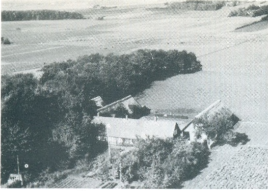
"Enggaard" i Stjær