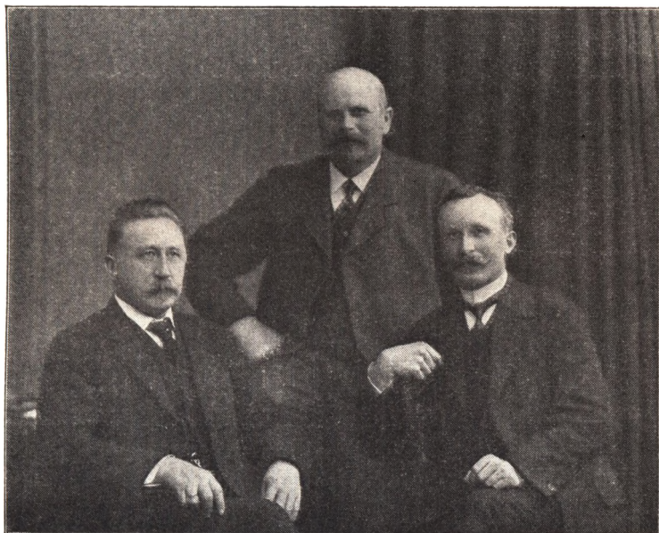
H. P. Hanssen, Kloppenborg Skrumsager og N. Chr. Nissen 1909.

Vi andre vil imidlertid ogsaa i denne Henseende holde Landets, holde den frihedselskende nordslesvigske Befolk-