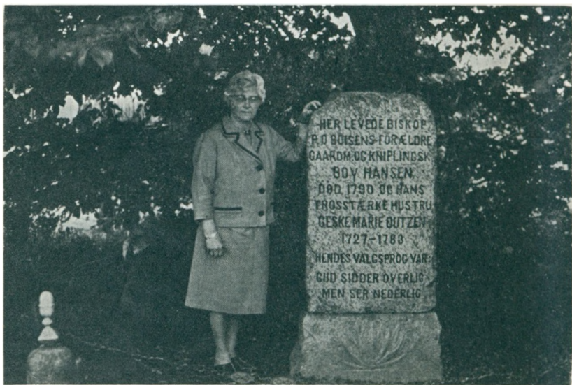
Emmerlev, Sønderjylland, 1967