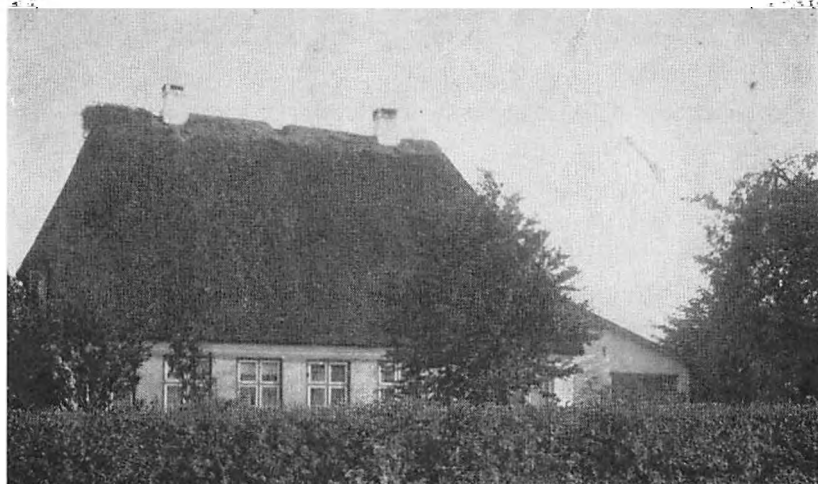
Gården »Kjeldstoft« ca. 1912

tægter foreskrev, hvor stor afstand de stråttækte bygninger skulle have fra nabohusene, og for ikke at støde an mod disse forskrifter, fik sædehuset ikke det gængse antal fag i længden; derimod byggede man i bredden for at få tilstrækkeligt husrum. Dette fik igen til følge, at husets tag blev meget højt. På taget slog storken sig ned, og denne storkerede var ved gårdens sidste brand den eneste i sognet.