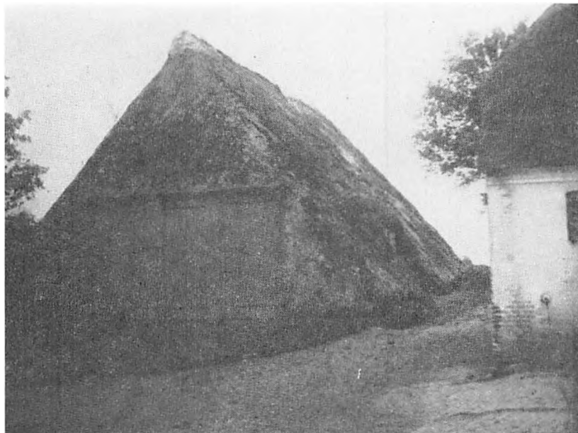
Kraps jordlade, foto 1913

1604 bøde fem daler, fordi han trods hertugens forbud har fejret bryllupsgilde.