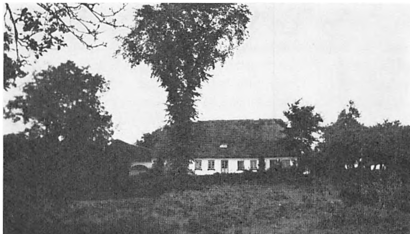
Foto af Vestre Fasbro

for kraft. Møllen stod, indtil gårdene omkr. 1925 fik strøm fra højspændingsværket.