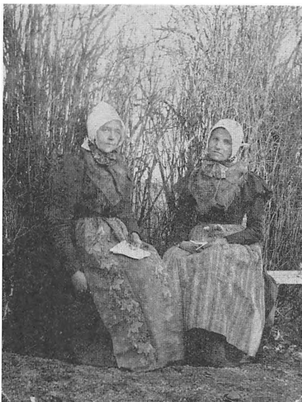
Kvinder fra Barsmark.