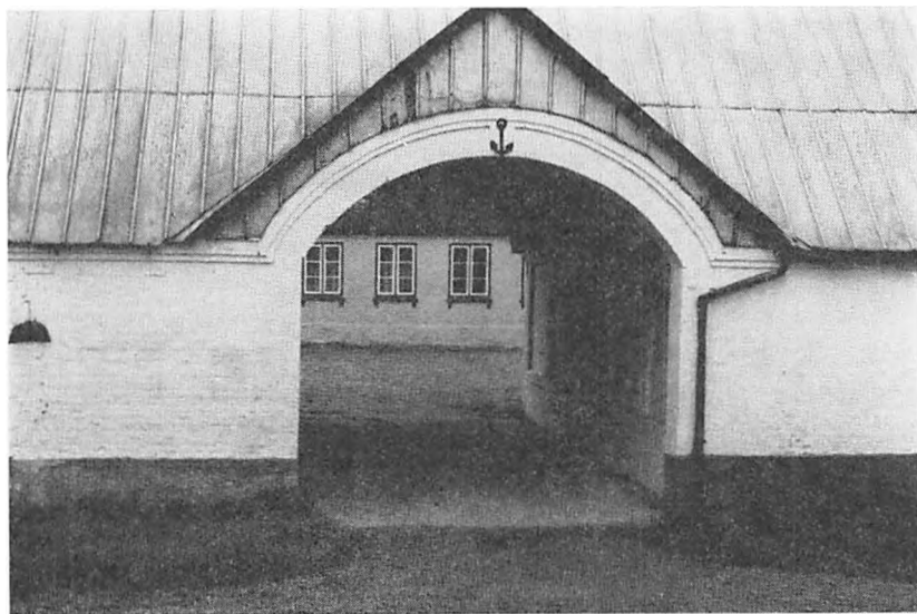
Indkørselsport med anker. Ø. Elbjerg