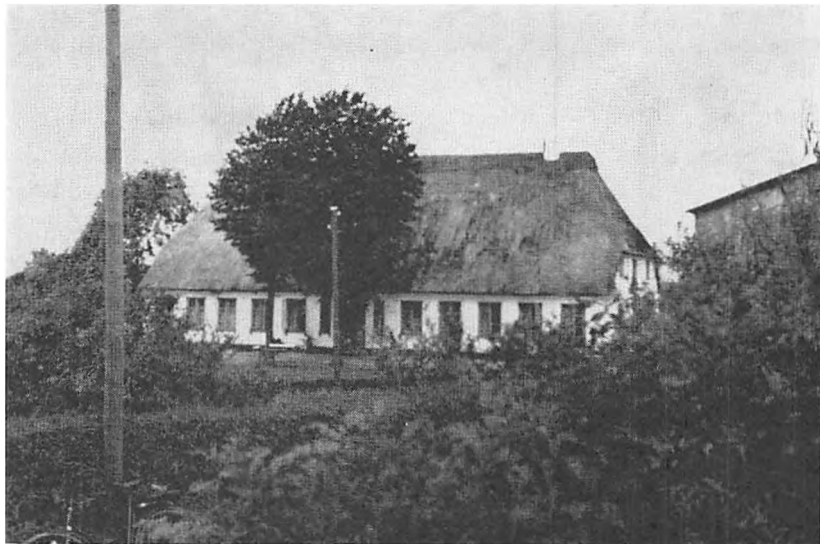
Gården »Vostoft«, foto 1945

Derefter vil vi omtale den store gård Vostoft . Gården ligger ved Barsøvejen, et lille stykke nord for Nørregaden. Navnet møder vi i amtsregnskaberne i året 1600. Ifølge et gammelt sagn skal gården oprindeligt have ligget længere mod øst, i marken Voshøj . Såvel dette marknavn som gårdsnavnet indeholder sandsynligvis samme led; værket » Sønderjyske Stednavne « oplyser, at dette kan være det gammel-danske mandsnavn Osi .