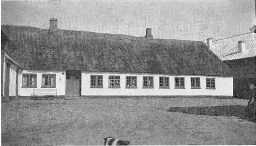
Kraps gård »på Bjerget«, stuehus 1951