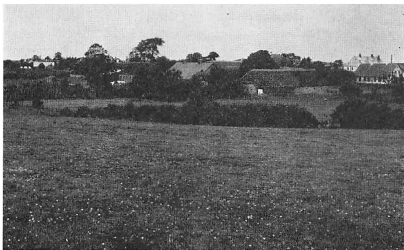
Nørregade, foto 1930