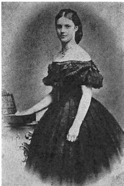
Så charmerende kunne en ung løjting pige være