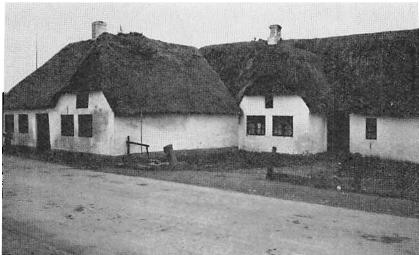
Jep Thaysens Hus i Nørregade (det hus, som brændte i 1897, lå ud til gaden, foran det nuværende)