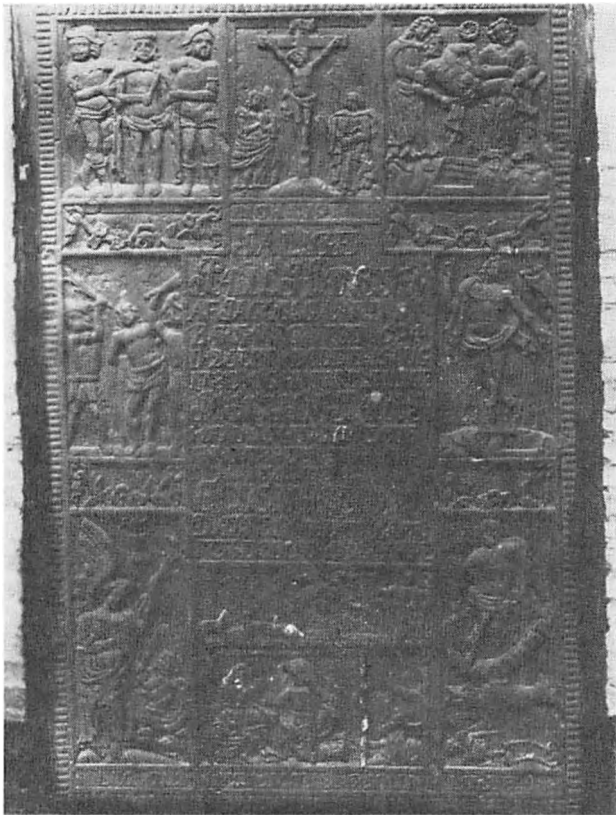
Gravsten på Jakobsgård fra 1780

Øster Løgum, hvor hver af sognets fem landsbyer havde sin særlige begravelsesplads. I Løjt har således alle Barsmark gårde haft deres gravsteder nord for kirken, Barsø og Nørby ligeledes, mens Skovby, Stollig, Dyrehave og Bodum så godt som alle var placeret syd for kirken. Kirkeby havde sine begravelser spredt, så at omtrent to trediedele lå nord for kirken, mens en trediedel lå sønden for denne.