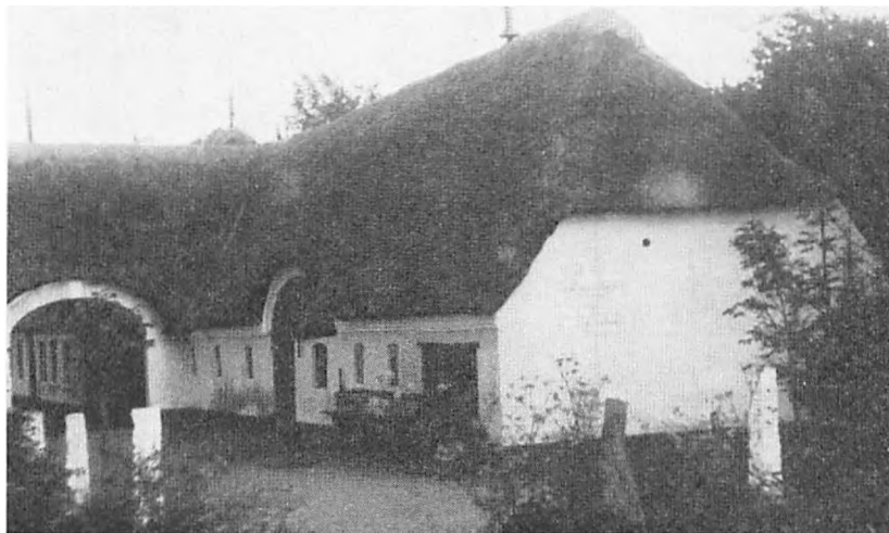
Ø. Fasbro. Foto 1932.