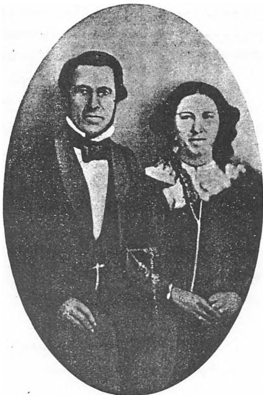
Fugl og hans Hustru som nygifte i 1859.