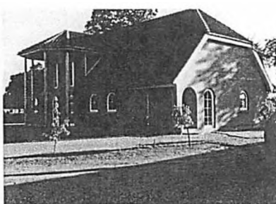
Min tipoldefars rødkalkede gård, anno 1999, usægtelig anderledes

Da jeg på hjemvejen kom til Aalborg for overnatning, kunne jeg jo lige så godt, runde bydelen Hasseris, for at fotografere det hus min bedstemoder har boet i, jeg har aldrig kendt eller set denne bedstemoder, det blev næsten overvældende da jeg så huset, for her har jeg som en stor dreng leveret mælk hver morgen igennem et helt år – uden at vide hvem der boede der. Jo, slægtsforskning er sandelig mere end navne og datoer.