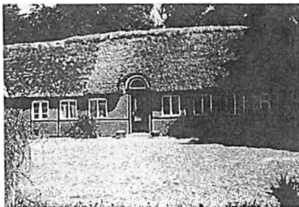
Min tipoldefars gård i Vindblæs, 1853, firelænget, rødkalket med stråtag