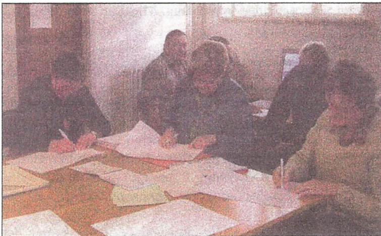
Arbejdsdag i forskerrummet feb. 2008

Det er ikke store forhold, men det kan bruges i mangel af bedre.