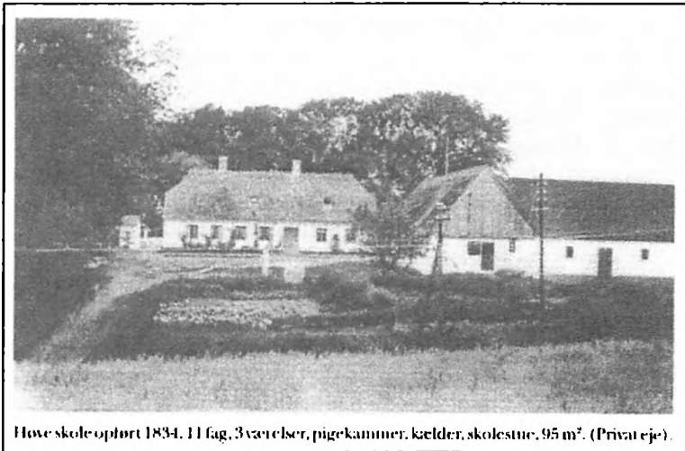
Høve skole opført 1834. 11 fag, 3 værelser, pigekammer, kælder, skolestue, 95 m 2 . (Privat ejr).