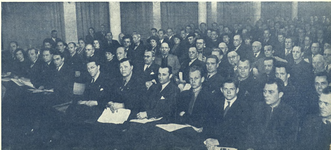
Da Landsforeningen startedes.