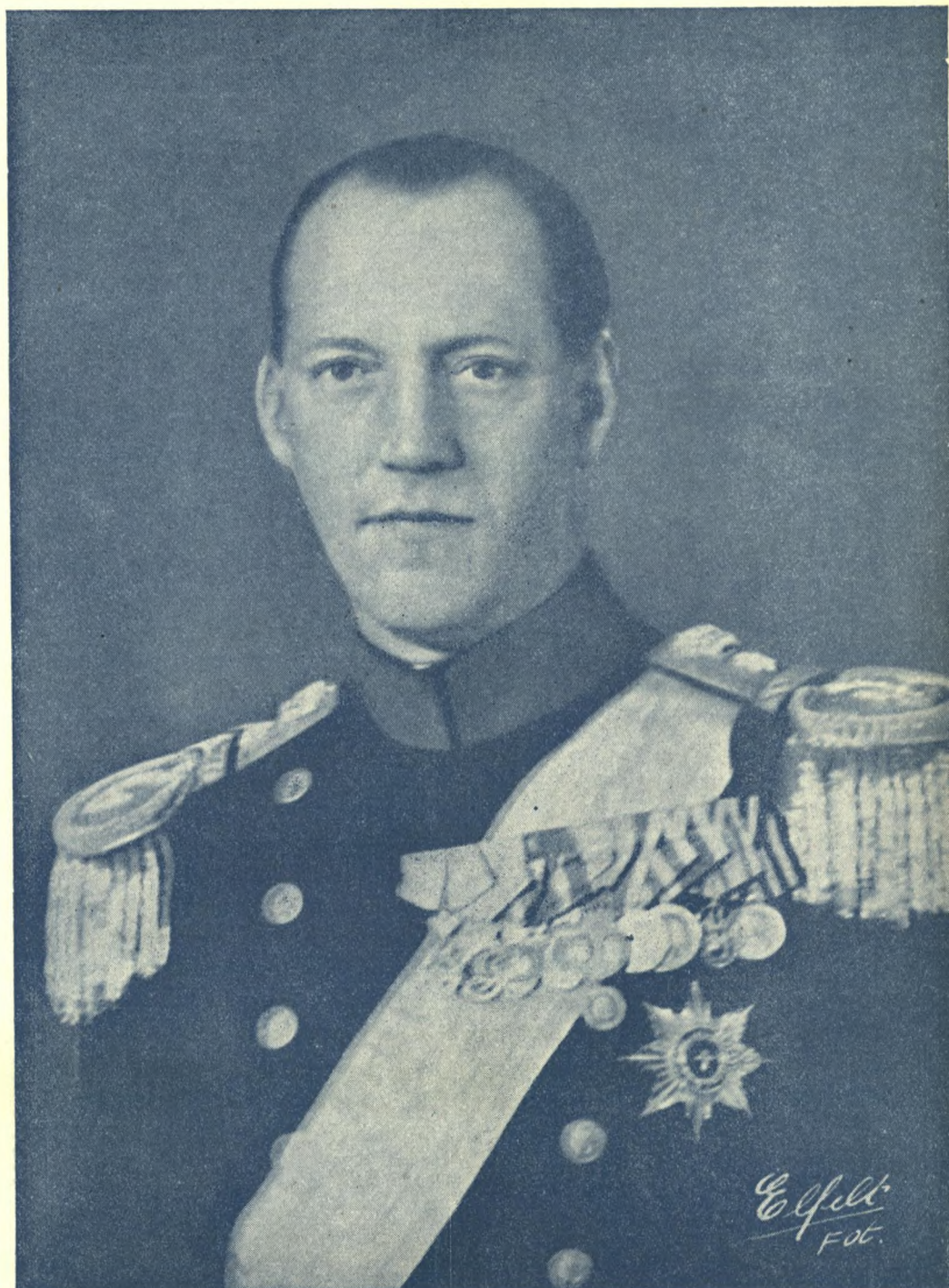
Hs. Kgl. Højhed Prins Axel

Vore Kammerater styrer den norske Statsskude.