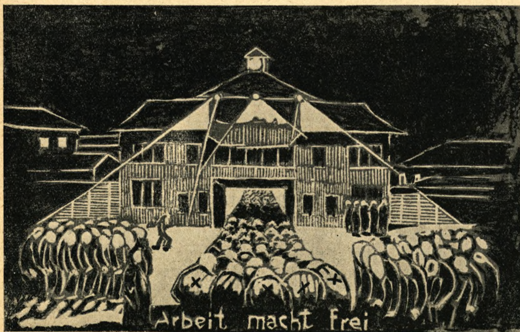
Arbejdskommandoer rykker ud. (Sachsenhausen)

Lägrrets öppnande för oss delegater hade enligt vad som senare berättades oss, när vi kunde tala med verandra utan övervakning, föregåtts av ett intensivt uppröjningsarbete i den del av lägret som skulle begagnas av skandinaverna.