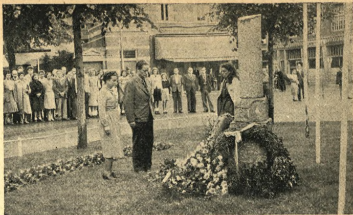
Danske Deltagere i Hollandsstævnet i Sommer nedlægger i Hilversum Blomster ved Mindesmærket for Hollands Faldne fra Frihedskampen.