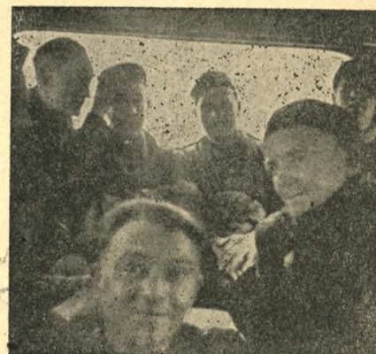
Et Kig ind i Ambulancen

Vejen langs Lejrens Sydside blev ogsaa benyttet af Civilister med Adgangstegn for hver Gang og især Kvinderne færdedes aldeles uberørte af Situationen. En Bøndegaard, fra hvis Vinduer man kunde følge alt derinde, fik god Hjælp og billig Arbejdskraft derfra. Kun naar Ind- og Udmarchen af Arbejdsholdene fandt Sted, var alt afspærret og vi blev da gennet hen til „Zur blauen Brücke”, hvor man kunde faa et Glas tyndt Øl til Madpakken og købe herlige afskaarne Hyacinther og Tulipaner til at smykke Busserne med. De brogede Blomstermarker og skinnende hvide Kirsebær- og Magnolietræer stod i en skærende Modsætning til Mørket bag Pigtraaden. I Skænkestuen forkyndte en stor Plakat: Læg Mærke til, hvem der bruger den tyske Hilsen. Den, som ikke gør det, ist dein Feind! Man saa sjældent nogen bruge den og hørte ofte Soldater skælde ud paa Krigen. De prøvede at faa noget at vide om dens Gang hos os, „for I maa jo da høre