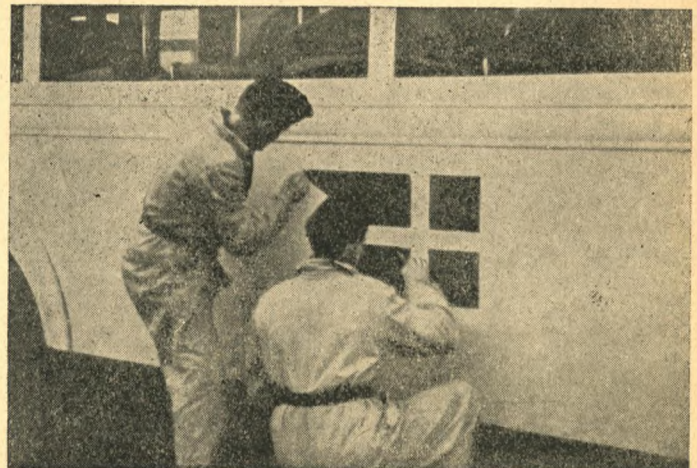
Busserne gøres klar

Da vi senere kom med de hvide Busser med svenske og danske Flag paa Siden, var disse til stor Opmuntring for Fangerne, et Pust fra den frie Verden med frie Mænd. Vi blev anset for at være fornemme, omend maaske ikke kærkomne Gæster, for Vagtposten skuldrede Gevær for