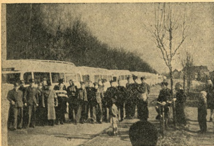
De hvide Busser

Silkeborg Jern- & Staalforretning A/S »Staalgaarden« — Silkeborg