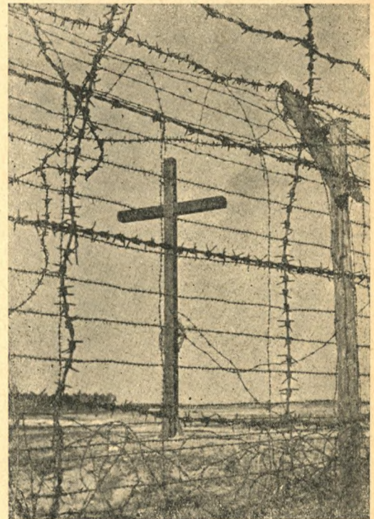
Det eneste, der i Dag er tilbage af Lejren er dette enkle Kors

Aktieselskabet De danske Bomuldsspinderier Vejle — Valby