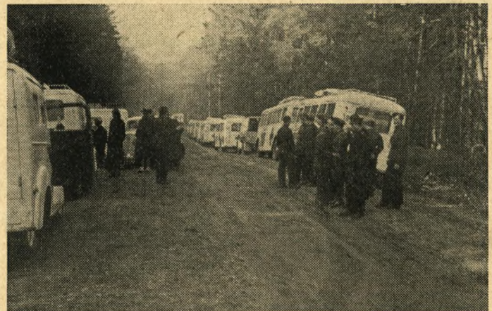
Danske og svenske Vogne ved Friedrichsruhe klar til Indsats

Tyskerne byggede derefter Frøslev-Lejren og de danske Myndigheder drog Omsorg for, at alle nødvendige Materialer blev stillet til Raadighed uden Forsinkelse. Den første Del af