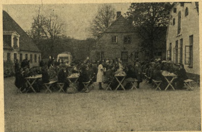
Kvinder fra Ravensbrück faar det første Maaltid ved Krusaa Mejeri