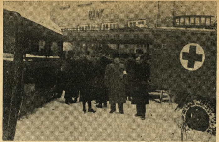
En Hjælpetransport starter

Af disse døde 531 dernede, 10 døde under Hjemtransporten og 44 døde efter Hjemkomsten, hvilket vil sige, at det samlede Antal faldne paa denne Front er 585.