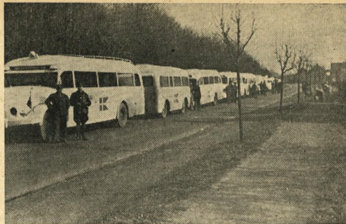
De danske Busser

Det kan nok være, at der kom Fart i Arbejdet med at udruste Ekspeditionen, og allerede i Løbet af 3 Dage sammensatte og udrustede Arbejds-