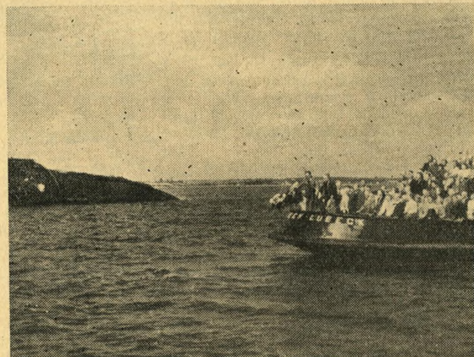
Efter Mindestensafsløringen sejlede Delegerede og Efterladte ud til Vraget af »Kap Arcona« for at nedlægge Kranse