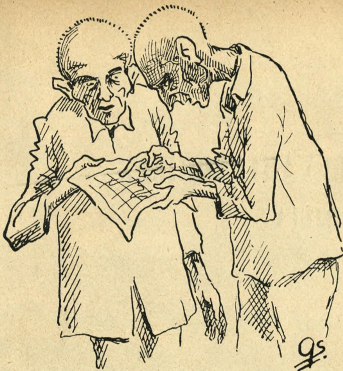
Vi var meget interesserede i Krigens Gang, og utallige Gange blev vore illegale Kort taget frem og ivrigt studeret

faringer, drøftede med Fanger af andre Nationaliteter Forholdene i deres Lande. Jeg husker, hvorledes vi paa en Arbejdsceile, belagt hovedsageligt med Nordmænd og Danskere, gennemførte en hel Foredragsserie med Emner spændende fra Storpolitik til Danmarks Tekstilindustri. Om Foredragenes Kvalitet og Saglighed kunde der selvfølgelig diskuteres, men vi gik alle til Sagen med en, for Tugthusfanger ukendt Energi og Lyst, nogle af Foredragene varede saaledes i op til 6 Timer.