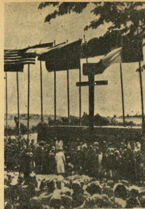
Mindestensafsløring for Ofrene fra »Kap Arcona«

Medens Orkestret dæmpet spillede, foretoges Mindestensafsløringen, og der blev nedlagt talrige Kranse fra