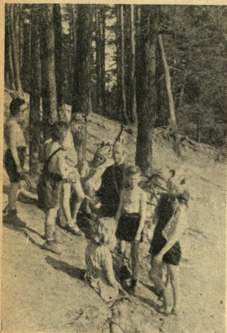
I Børnehjemmet i Steinbeck faar Børnene Lov til at tumle sig frit

Lad mig anføre endnu en Beretning. Det drejer sig om en Pige, født 1931 i Hamborg, hvis Fader allerede 1933 blev dømt til 8 Aars Tugthus, fordi han havde modarbejdet Nazisterne. Hun fortæller: „1941 havde Far siddet de 8 Aar af og kom nedbrudt hjem. Endelig, endelig havde vi vor kære Far igen. Han arbejdede Dag og Nat for at afbetale vor Gæld. Saa levede vi sammen to lykkelige Aar. Det var i Hamborg. Vi var flyttet og havde boet 6 Uger i en ny Lejlighed, da Angrebet paa Hamborg kom 27. Juli 1943. Fire Nætter i Træk varede Bombardementet, indtil Hamborg laa i Ruiner. — — Meget ved jeg ikke at fortælle om Angrebet, for Øjnene stod ud af Hovedet paa mig, og jeg var ude af mig selv ved rundt omkring at se Død og Ødelæggelse”.