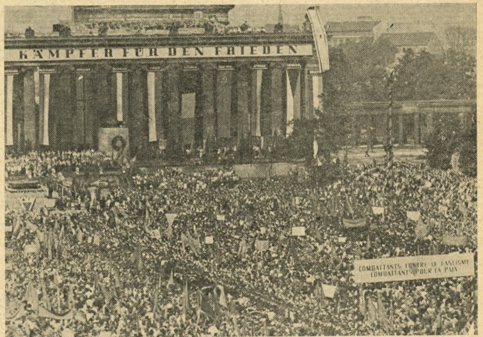
Stævnet i Berlin samlede sig om Brandenburger-Tor

Søndag den 12. afholdtes mindedagen for fascismens ofre. Mødet om Søndagen var ingen moddemonstration mod den demonstration, der nogle dage før havde fundet sted i de