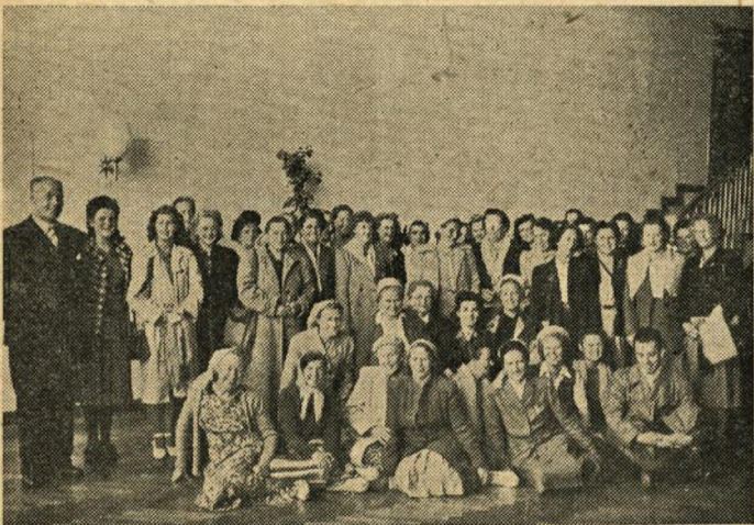
Deltagerne paa Besøg i Sønderborg-Virksomhed

Nu er Grev Folke Bernadotte — vor Redningsmand — død. Det er saa underligt, uden ham var vi ikke kommet hjem igen. Nu er hans Gerning endt, men meget naaede han. Husker I, han sagde: „Jeg skammer mig ik-