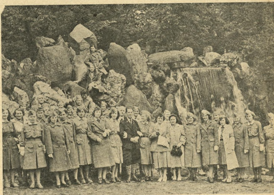
De danske Lotter fotograferet sammen med hollandske Værter

Sagen fortjener al mulig Støtte og vi vil alle gerne yde en Haandsrækning, naar det gælder at løse Efterkrigstidens humanitære Opgaver.