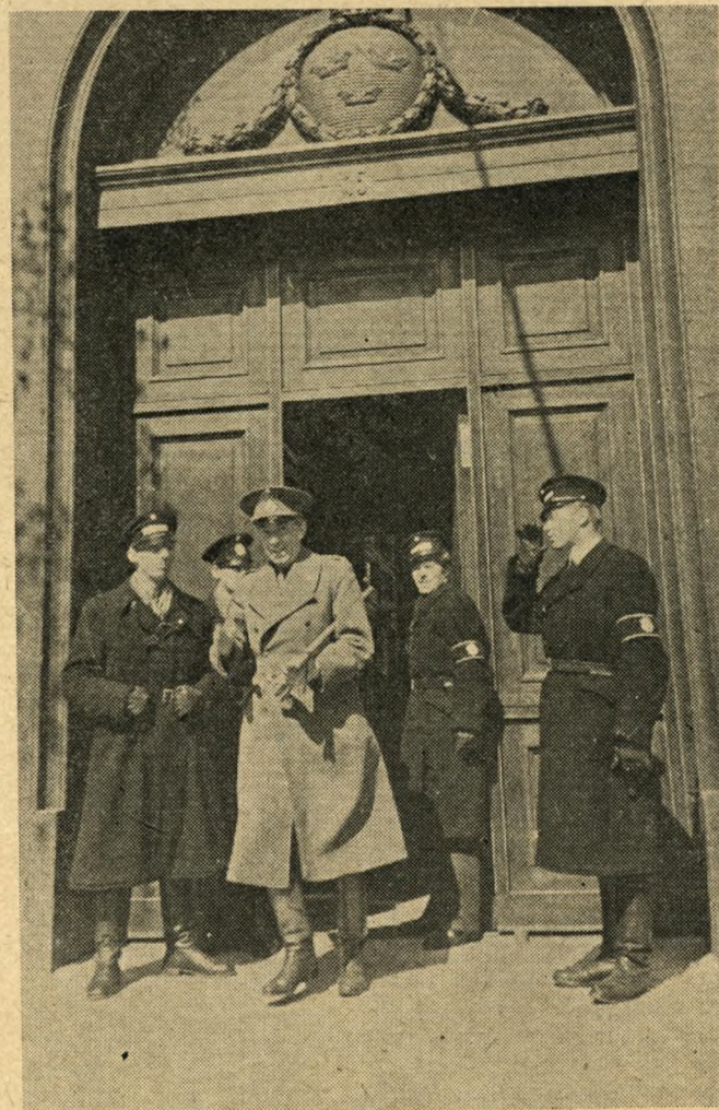
Bernadotte forlader den svenske Ambassade 1. Maj 1945

At Bernadotte fulgte Fangerne med levende Interes-