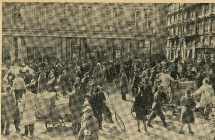
Foran d'Angleterre, hvor Bernadotte boede i de berømte Maj-Dage, samlede der sig hurtigt en større Folkemængde

se, gav sig Udtryk i den Glæde, han viste da en Kreds af Fanger overrakte ham en statelig Bog med alle vore Navne. Paa Treaarsdagen for vor Befrielse udtalte han ved en Mindeudsendelse i den danske Radio: I, som ved, hvordan det føles at være Fange, værdsætter dog sikkert Friheden endnu mere end et fredeligt Liv i Ufrihed. Jeg er derfor overbevist om, at saafremt Eders Frihed endnu en Gang skulde trues, saa er I rede til at kæmpe for Frihed, Sandhed og Ret. Thi den, som kæmper for disse høje Idealer, vinder altid Sejren til Slut.