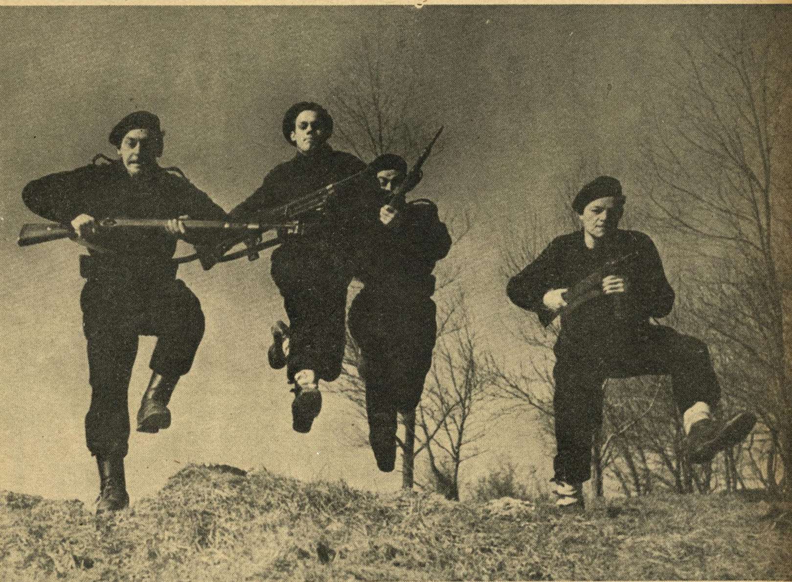
Hjemmeværnet holder øvelse