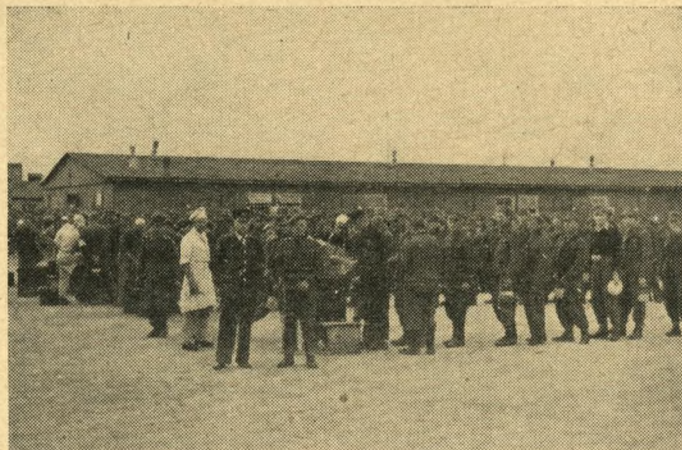
Neuengamme i dag er befolket af de mænd, der svang kniplerne over europas frihedshær bag pigtråd.

Emil Scharnweber, Nyborg, fhv. Neuengammefange nr. 60856.