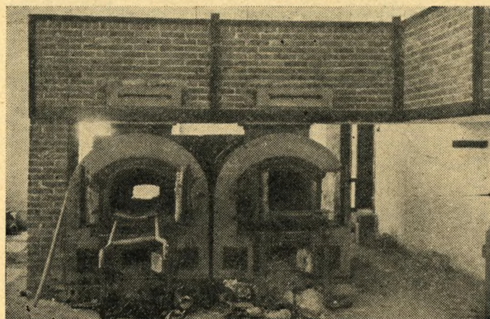
Dette blev den sidste station for tusinder, af Neuengamme-kammeraterne. Det er ikke overdrivelse at sige, at Bernadottes aktion frelste et stort antal danske og norske fanger fra dette uhyggelige rum.

distrikt, som det ville være ønskeligt at nå. — Nogle vil måske ikke nå det, andre vil måske nå det dobbelte. Indsamlingen skal være afsluttet den 15. april d. å.