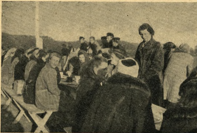
Ved Kruså mejeri fik tusinder af fanger det første måltid mad på dansk grund efter hjemkomsten. Her ses en flok fanger fra Ravensbrück ved bordene udenfor mejeriet. Nogle få skridt herfra rejses monumentet for Folke Bernadotte.

Skal vi endnu engang række hinanden hånden?