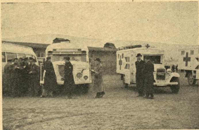
De mest medtagne fanger blev transporteret i sygebiler, der var forsynet med bårer i 2 etager. Andre fanger kunne sidde op i rutebilerne, der var hidkaldt fra store dele af Danmark.