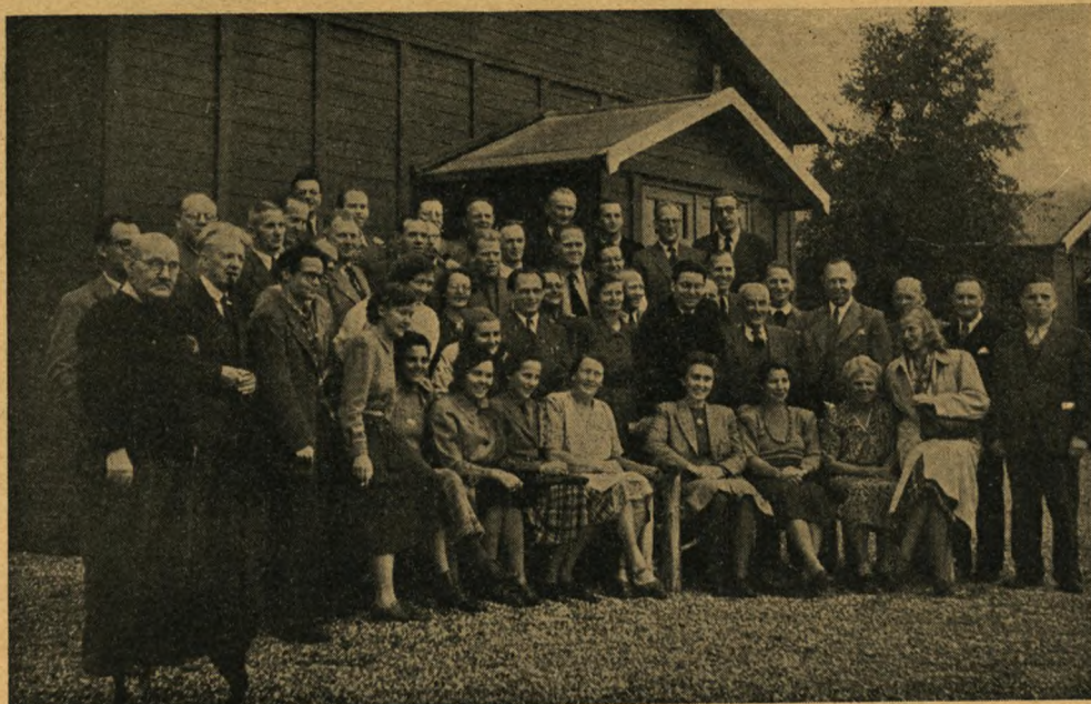
Deltagerne i det dansk-tyske Lærerstævne