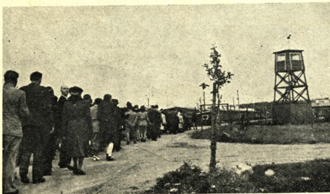
En fangeforening på besøg i Frøslev.