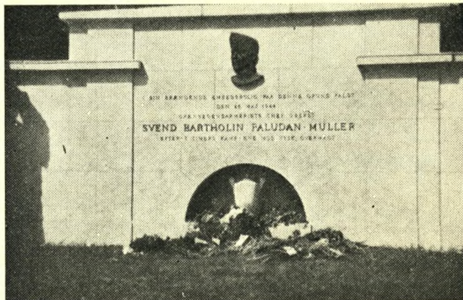
Mindemuren i Gråsten