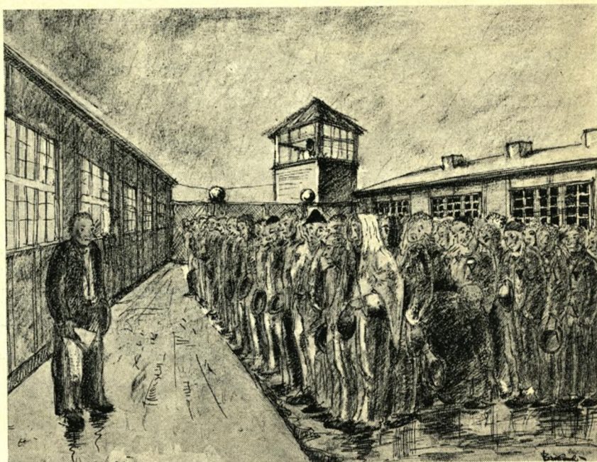
Spiseappell i Dachau