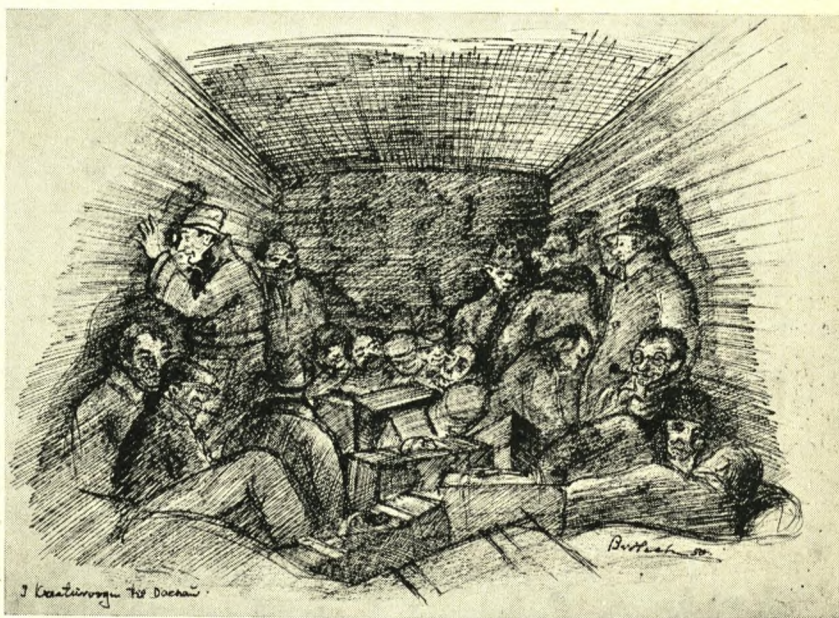
Hver vogn blev stoppet med 50 mand, så vi måtte ligge og stå på skift

Hvem husker ikke Mehr's smørtenor? Han havde et udtømmeligt forråd af sange — ikke altid lige høviske — men vi var ikke kræsne.