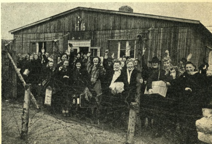
«Pigerne» giver deres glæde luft den 5. maj

fårhuslejrens første dage må nærmest betegnes som kaotiske. Over 2000 mennesker løslodes den 5. maj over hals og hoved, tilbage i lejren forblev 4—500 tidligere fanger, der havde meldt sig til