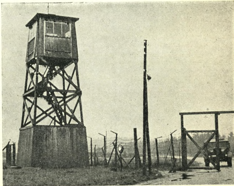
Frøselelejren hedder nu Padborglejren og ved dens sydport står det ene af de tyske vagttårn, der bevares som minde og vartegn.

Efterhånden udviklede selvstyret indenfor pigtråden sig i ret udstrakt grad, og der opstod en mængde kommandoer af forskellig art, som alle var lige vigtige og nødvendige, især for indehaverne. Der var således lejrkontor, pakke- og postkontor, depot, arbejdsfordeling, spise-