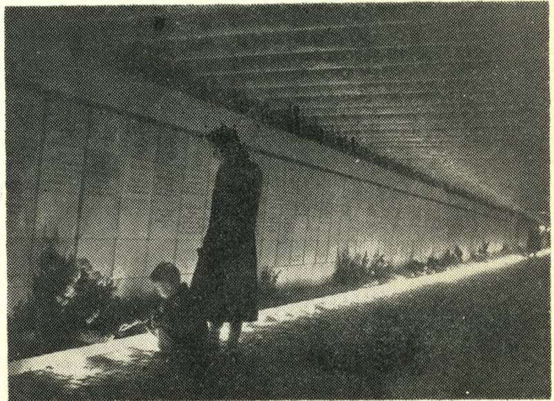
Pergolaen var for første gang oplyst en juleaften. De mange levende lys skabte i al deres stillfærdighed en forunderlig stemning af stor virkning.