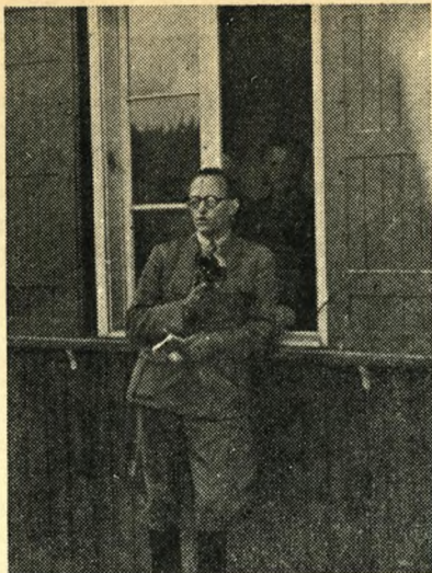
Digmann meddeler befrielsesbudskabet

sammenbidte og hårde, flere med spøg på læben, mens kun ganske enkelte faldt sammen. Efterhånden blev alle forsynet med cigaretter, det bedste købemiddel i tyskland, samt en lille pose af vidundermidlet „Chemocept“ camoufleret som „tandpulver“.