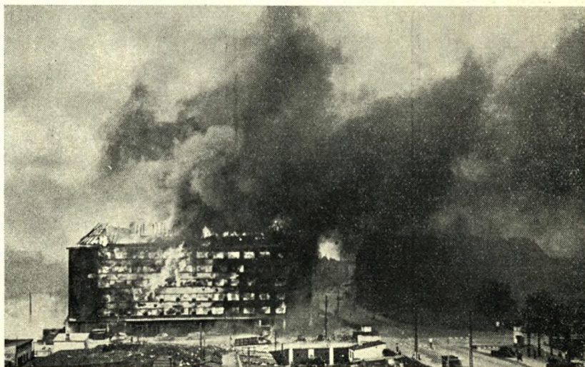
Et flammende bål efterfulgte bombardementet

Selve fængslet var indrettet på loftet, men kun i bygningen mod Nyropsgade og Kampmannsgade. Elevatoren gik kun til 5. sal, og fra denne etage førte en ret stejl trappe op til