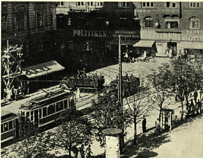
Rådhuspladsen den 29. august 1943.

Efter nogen tids forløb blev alle de tilbageværende fanger ført over i lejr 1, hvor de for første gang blev gjort