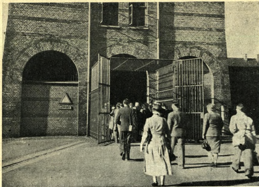
»Gestapofangerne« forlader »Vestre« efter frivilligt besøg.