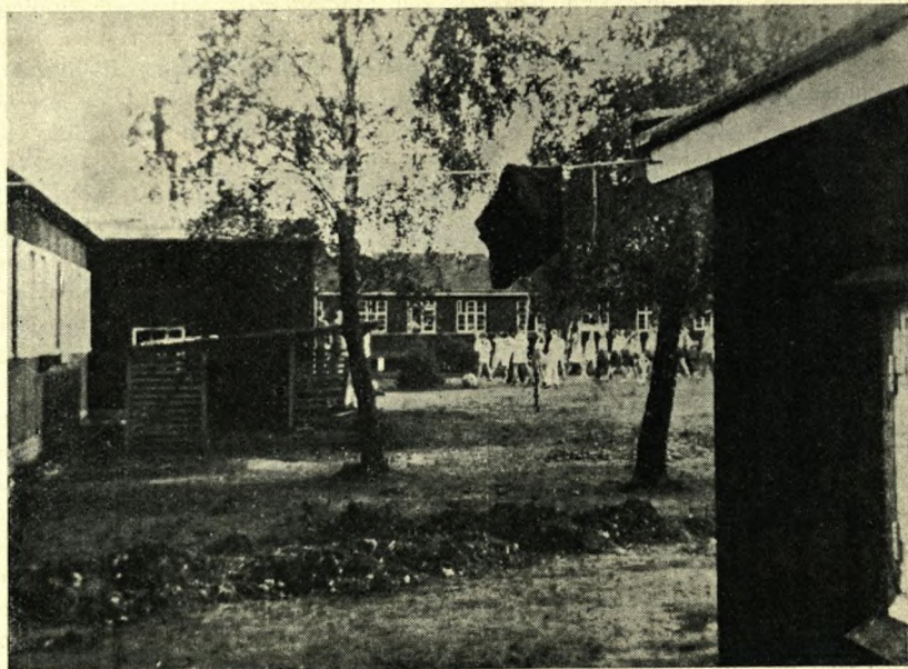
Illegalt foto fra Horserød. Til venstre barak 13. Til højre barak 14.

Da fangerne var klar over at de, dersom situationen bar derhen, at tyskerne overtog den fulde magt i Danmark, vilde befinde sig i en yderst farlig stilling, henvendte de sig til de ansvarlige danske myndigheder med forespørgsel om, hvorledes disse myndigheder havde tænkt sig at ordne spørgsmålet om fangerens forhold i tilfælde af, at tyskerne gjorde skridt til at overtage lejren. De fik det beroligende svar, at de tidnok skulle få be-