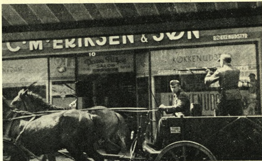
Tysk »promenadekørsel« den 29. august.